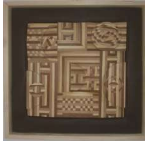
التطبيق السادس للبحث

ويتضح فيه التقسيم المساحات وتنوعه بين الغامق والفاتح مستخدما القشرة الطبيعية الماهوجني والموسكي مما ادي ال ثراء العمل الفني بالرؤية البصرية من خلال تحقيق شفافية العمل الفني .