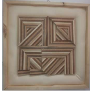
التطبيق الثاني للبحث

منفذ بالأخشاب الطبيعية الماهوجني والموسكي والقشرة الطبيعية الماهوجني والسويد ويتضح بهذا التطبيق التتابعات التكرارية للخطوط والمساحات والالوان في ايقاعات حركية متنوعة مما تحقق نسقا بصريا .