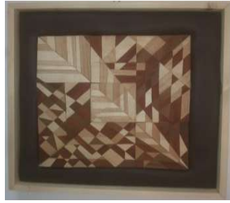
التطبيق الثالث للبحث

منفذ بالأخشاب الطبيعية الماهوجني والموسكي والقشرة الطبيعية الماهوجني والسويد ويتضح بهذا التطبيق التتابعات التكرارية للخطوط والمساحات والالوان في ايقاعات حركية متنوعة مما تحقق نسقا بصريا .