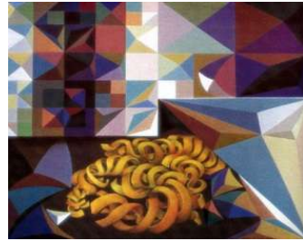
اسم العمل:: علاقة عضوية هندسية الابعاد : ١٠٠X١٠٠سم، السنة: ١٩٨٠ الخامة: زيت على توال يثبت على خشب المصدر: مقتنيات قصر المؤتمرات بالقاهرة

والبناء الإنشائي في أعمال الفنان يمتد من أعماق الفكرة محملاً بالأحاسيس والمشاعر، ومختلطاً بالمواد والأدوات، وصولاً إلى مستويات عظمى للبناء الجمالي، وهذا يذكرنا بالطاقة الكامنة في الأشياء. وتتميز أيضاً أعمال الفنان بمنظور كوني رياضى حركى، فالمفردات التشكيلية وإنطلاقاتها، وتمدها وانشطارها، وإنجازاتها، واتحادهما، وتباينها، وتكاملها، تتحرك من خلال منظومة رياضية محكمة ومرئية تتكامل فيها الأبعاد الجمالية الكونية للعمل الفني. (٨)