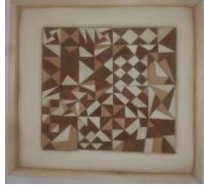
التطبيق الخامس للبحث

ويتضح فيه التباين اللوني بين الغامق والفاتح والايقاع الحركي الغير منتظم التغير والتعدد الاتجاهات والاختلاف المستويات والاختلاف النسب مما يؤدي الي تحقيق نسق بصري جديد تعتمد فيه علي المديول .