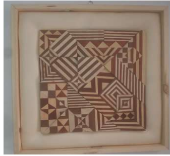
التطبيق الاول للبحث

منفذ بالأخشاب الطبيعية الماهوجني والموسكي الي جانب القشرة الطبيعية الماهوجني والقرو والسيكامور ويتضح من هذا التطبيق اعتماده علي الخطوط والمساحات العضوية والهندسية كما يلاحظ ان تعدد المستويات والاختلاف الاتجاهات والتباين اللوني يساهم في تحقيق منظومه بصرية جديدة في مجال الاشغال الخشبية