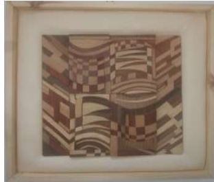
التطبيق الرابع للبحث

ويتضح فيه التباين اللوني والشفافية من خلال القشرة الطبيعية وتحقيق البعد الثالث الحقيقي في تنوع الاسطح الخشابية وتعددتها مما يثري العمل الفني