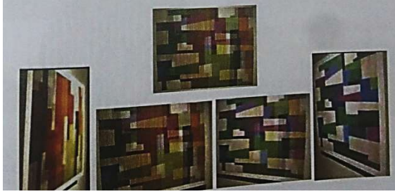
شكل رقم ( ٢ )

احد اعمال الفنان لويس توماسيلو نماذج فنون الحركة الفعلية التي تتكون من عدة مستويات وتختلف رؤية العمل نتيجة تغيير زاوية المشاهد www.nmazca.com