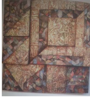
للفنان: عبد الرحمن النشار، العمل الفني تقوم بنائيات علي استلام العناصر الشكلية و النظم البنائية لفنون التراث المحلي (الفن المصري القديم - الفن القبطي - الفن الاسلامي - الفن الشعبي) السنة: ١٩٩٧ الابعاد: ١٢٢ X ١٢٢ سم، الخامة: زيت على توال يثبت على خشب

ويرى الباحث من خلال تخصص أشغال الخشب ومما يتمتع به من مميزات خاصة بالخامة وطبيعتها، وبما يتميز به من تقنيات وأساليب تشكيليه متعددة، وخامات تتميز بسهولة في التشكيل، ومن ثم يمكن استحداث صياغات تشكيلية لإنتاج مشغولة خشبية تظهر فيها الجانب الجمالي والفني، من خلال الاستفادة من القشره الطبيعية والصناعية لانتاج مشغولة خشبية معاصر هو ربطها بفنان مصري معاصر.