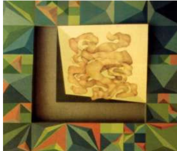
اسم العمل:: علاقة عضوية هندسية الابعاد : ٨٠X٨٠ سم ، السنة: ١٩٨٩ الخامة: زيت على توال يثبت على خشب

فالفنان " النشار " تناول التراث فى أعماقه بأبعاد جديدة، ليس بإعتبارها مفردات ومقتطفات من العناصر المتحفية وإعادة صياغتها أوتحريفها، بل على وعى بالأساس البنائى لفنون الحضارات العربية، لذلك إمتد البناء التصميمى فى أعمال النشار فى أعماق الفكرة محملاً بالأحاسيس والمشاعر، مختلطاً بالمواد والأدوات، وصولاً لمستويات عظمى للبناء الجمالي.