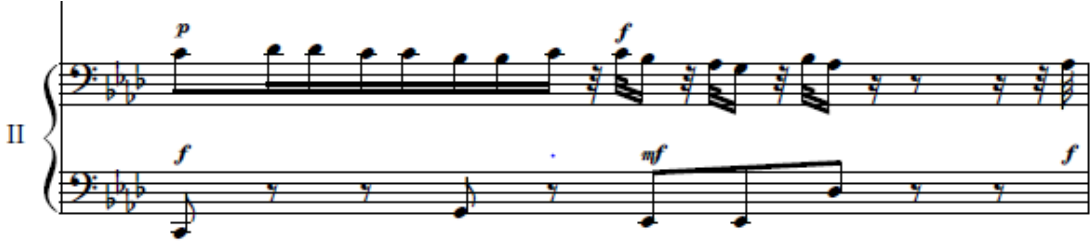
شكل رقم (١٠) (م٦) تتابع لحنى مع الضرب الإيقاعى للعازف الثانى

ظهرت هذه التقنية فى اليد اليمنى للعازف الثانى فى الموازير (م٦، م٧، م١٠) ويتطلب أداء تلك التقنية الأحساس بالوحدة ومرونة لحركة الأصابع لليد اليمنى للعازف، والشكل التالى يوضح ذلك