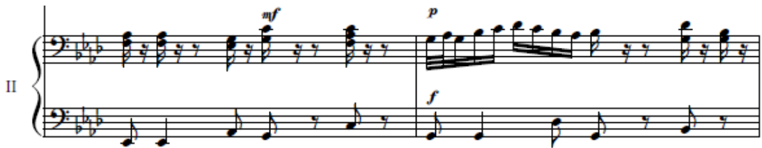
شكل رقم(١٢) (م١٧، م١٨) تألف هارموني على وحدة الدوبل كروش فى لحن اليد اليمنى للعازف الثانى

ظهر فى لحن اليد اليمنى بعض التألفات الثلاثية بزمن الكروش (♩) والدوبل كروش (♩♩) فى اليد اليمنى ( م ١٧ - م ١٩ ) وذلك يشكل صعوبة لدى الدارس . لذا يجب أن تكون اليد والأصابع في استدارة كاملة لتساوى الضغط على النغمات ، وأن تكون نغمات الأوكتاف في قوة واحدة مما يتطلب التدريب عليها ببطء، ومثال ذلك فى (م١٧) فى الشكل التالي: