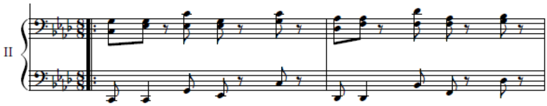
شكل رقم(١١) (م١١)مسافات هارمونية باليد اليمنى وضرب بلدى باليد اليسرى للعازف الثانى

الحركى بين اليدين للتحكم والسيطرة على أداء لحن اليد اليمنى وأداء المسافات الهارمونية المتتالية يتطلب أن تكون اليد والأصابع في استدارة كاملة لتساوى الضغط على النغمات ، كما بالشكل التالي :