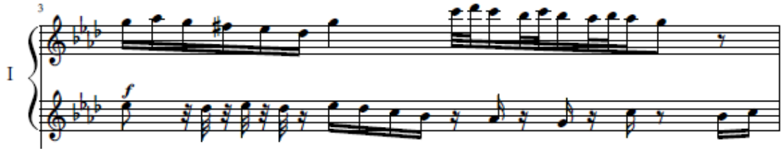
شكل رقم (٤) مازورة (٣م) تتابع النغمات وتقسيمات داخل الوحدة للعايز الأول