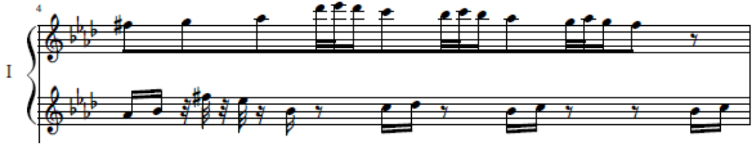
شكل رقم (٥) (٤م) تقسيم داخلي مع مكمل إيقاعي للعايز الأول

تعتمد هذه التقنية على مرونة حركة الأصابع للعايز وضبط الوحدة وقد ظهرت هذه التقنية في الموازير (٤م، ٩م، ٢٤م، ٣٠م) لذا يرى الباحث ضرورة التدريب ببطء شديد مع مراعاة التبادل بين اليدين بأسلوب المكمل الإيقاعي بين اليد اليمنى واليد اليسرى للعايز الأول، ونلاحظ استخدام المؤلف في هذه الموازير لمقام الفريجيان ومقام الليديان كما في الموازير من (٤م-١٠م)، ومثال ذلك في الشكل التالي: