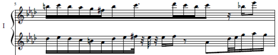
شكل رقم (٦) (٥م) أداء النغمات المتماثلة بمسافات هارمونية للعايز الأول

يظهر في هذه التقنية تتابع للنغمات كما جاء بالتقنية رقم (ب-١-٢) بالإضافة إلى أن النغمات على بعد مسافات مختلفة كما ظهر في (٥م، ٨م، ٢٦م، ٣٢م) ويتطلب أداء تلك التقنية أن تكون النغمتان في قوة واحدة مما يتطلب التدريب عليها ببطء لكي تسمع النغمات متتابعة وبقوة لمس واحدة بين اليدين للعايز، ومثال ذلك في الشكل التالي: