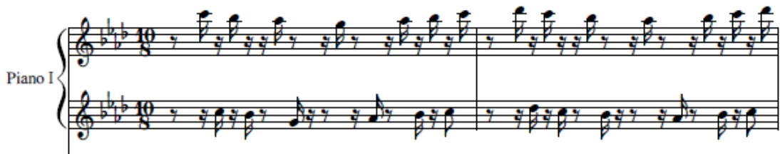
شكل رقم (٢) (م ١، م ٢) تبادل ما بين اليدين لمكمل إيقاعي تقسمات داخل الوحدة للعازف الأول

هذه التقنية تعتمد على التبادل بين اليدين (اليمنى واليسرى) لوحدة الكروش (♩) وفي ضوء الميزان (8/8) سواء في داخل الوحدة أو مابين الوحدات وتعتمد أيضاً على مهارة العازف في كيفية تناول الأصابع لكل يد على حده في شكل متتابع ومراعاة السكتات في اليدين وكأنها فعل ورد فعل في ضوء المكمل الإيقاعي للوحدة وتكمن الصعوبة في عملية التبادل للذاكرة وضبط الوحدة وهي في أغلب المؤلفات بأشكال مختلفة كما في (م ١، م ٢) والتي أكد فيها المؤلف على استخدامه للمقامات العربية والكنسية حيث بدأ في المقام الأصلي للمؤلفة (حجازكاركورد) وينتهي في مقام ليديان مصور على (رى b) ومثال على ذلك الشكل التالي: