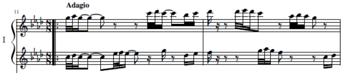
شكل رقم (٣) (م ١١، م ١٢) تبادل ما بين اليدين في تتابع الوحدات للعازف الأول