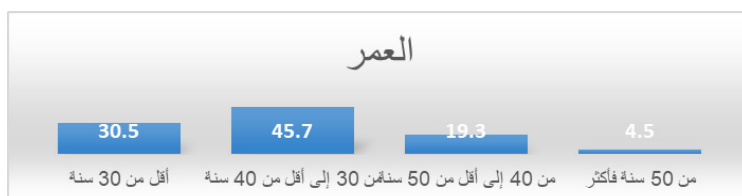
شكل بياني رقم (1) توزيع أفراد العينة حسب العمر.

ويتضح من خلال الرسم البياني رقم (2) أن أكثر من نصف المشاركين 58.7% لديهم مؤهل بكالوريوس، ثم الحاصلين على الدبلوم بنسبة 16.1%، وكانت نسبة الحاصلين على درجة الماجستير 13%.