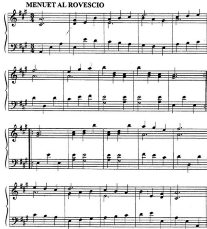
الشكل رقم (٤)