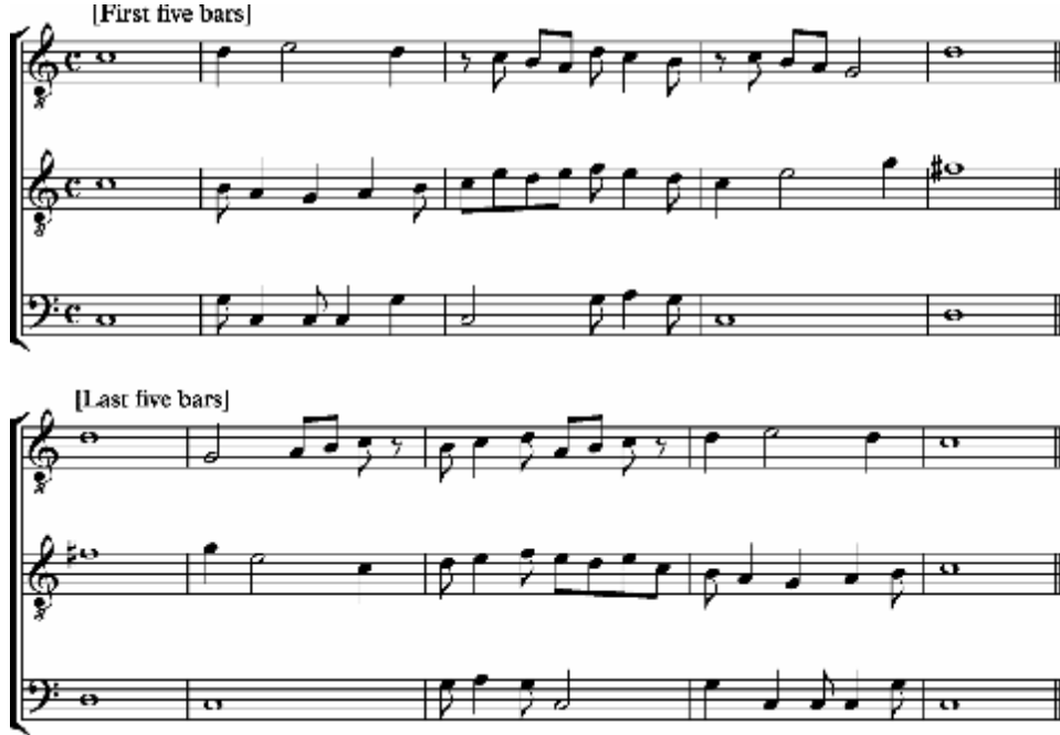
شكل رقم (٢)

Machaut (1) ، الافتتاح والختام من "ma fin est mon startment" نهايتي هي البداية)