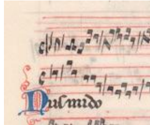
شكل رقم (١)

كما هو مرفق في الشكل رقم (١) ويعد أقدم مثال على أسلوب الريتروجريد، و يُعتقد أن المخطوطة قد تم إنتاجها بواسطة ورشة يوهانس جروش في باريس (٣)