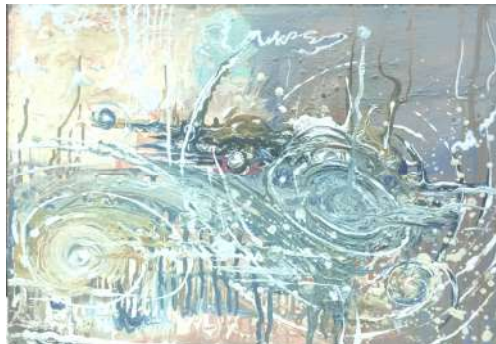
شكل (١١) من أعمال الطلبة