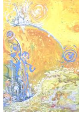
شكل (٧) من أعمال الطلبة