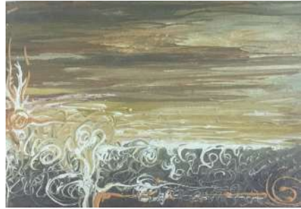
شكل (٩) من أعمال الطلبة