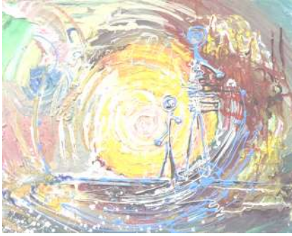
شكل (٨) من أعمال الطلبة