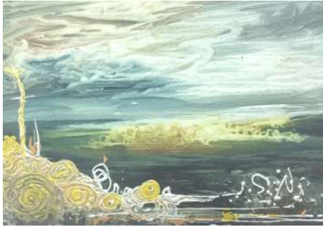
شكل (١٠) من أعمال الطلبة