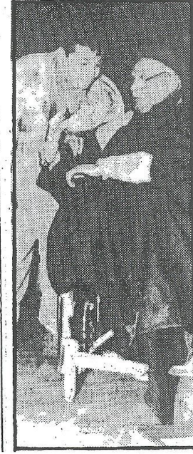
صورة رقم (١٣)