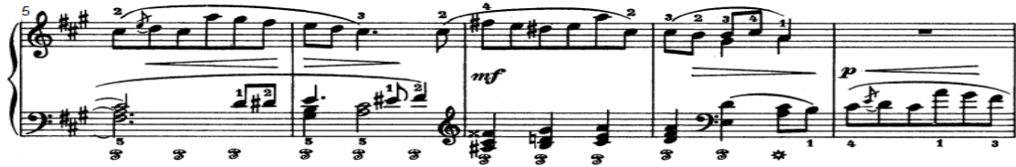
شكل رقم (٦)

- صعوبة أداء تألف هارموني يليه نغمات منفردة ونغمات مزدوجة ثم تألف هارموني بأسلوب أداء متصل.