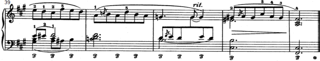
شكل رقم (٥)

من م(٣٨:٣٤) تكرار م(٥:١) ، من م(٤٣:٣٩) أداء نغمات لحنية منفردة باليد اليمنى وأداء تآلفات هارمونية باليد اليسرى وثانية لحنية باستخدام الأداء المتصل وانتهت المقطوعة بأداء تآلف ثلاثي باليد اليمنى ونغمات مزدوجة باليد اليسرى .