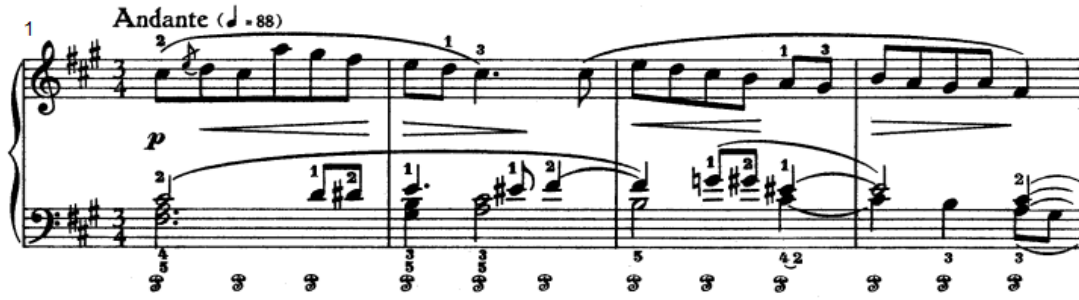
شكل رقم (١)

أداء نغمات لحنية منفردة في اليد اليمنى صعوداً وهبوطاً مع استخدام حلية الأتشيكاتورا باستخدام أسلوب الأداء المتصل ، وأداء نغمات سلمية هابطه وقفزة ثالثة صاعدة ثم خطوات سلمية هابطه فصاعدة باستخدام أسلوب الأداء المتصل ، أما اليد اليسرى فتؤدي تآلفات هارمونية ثلاثية ثم نغمات كروماتيكية صاعدة باستخدام أسلوب الأداء المتصل واستخدام الرباط الزمني .