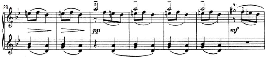
شكل رقم (٩)

تؤدي اليد اليمنى نغمات لحنية منفردة باستخدام القوس اللحنى القصير Slur مع أداء نغمات بأسلوب المتقطع الثقيل portamento ، وتؤدي اليد اليسرى نغمات مزدوجة باستخدام القوس اللحنى القصير، وانتهت الفكره بأداء تآلفات هارمونية ونغمات مزدوجة باليد اليمنى ، وأداء تآلفات هارمونية ممتدة باستخدام الرباط الزمني .