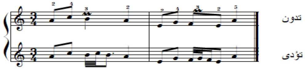
شكل رقم (٢٦)