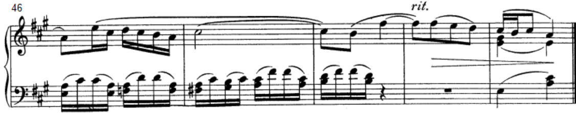
شكل رقم (١٨)