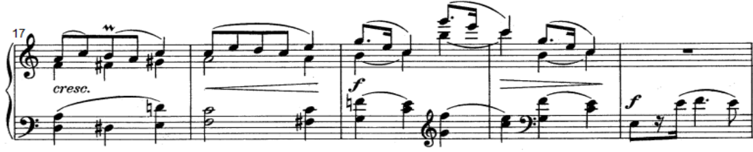
شكل رقم (٢٣)

باستخدام القوس اللحني القصير ثم تكرار نفس النموذج أوكتاف أعلى وتكراره مره ثانية أوكتاف لأسفل ، وتؤدي اليد اليسرى نغمات مزدوجة باستخدام القوس اللحني القصير .