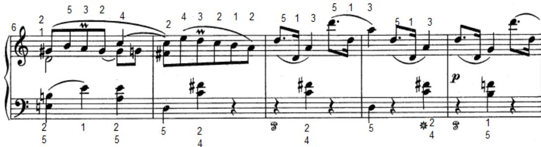
شكل رقم (٢٥)

يوضح اقتراح لترقيم الأصابع من قبل الباحثة