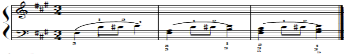
شكل رقم (٧)

صعوبة أداء تألف هارموني يليه نغمات منفردة ونغمات مزدوجة بأسلوب أداء متصل - أداء تمرين مقترح للتغلب على صعوبة أداء تألف هارموني يليه نغمات منفردة ثم تألف هارموني بأسلوب أداء متصل .