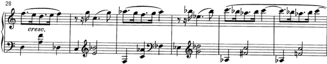
شكل رقم (٢٤)

تؤدي اليد اليسرى التيمة الأساسية للفكره الأولى منفردة في م (٢٢،٢١) ، م (٢٦،٢٥) سيكوانس لحنى هابط ل م (٢٤) وهو عباره عن نغمات سلمية هابطه ثم مسافة الثالثة اللحنية الصاعده، م (٢٨) تصوير ل م (٢٦) على بعد خامسة صاعده، م (٣٢،٣٠) تصوير م (٢٨) على بعد ثالثات صاعده، م (٣١،٢٩) تصوير ل م (٢٧) على بعد ثالثات صاعده وهي أداء مسافة الخامسة اللحنية هبوطاً وصعوداً باستخدام القوس اللحني القصير، م (٣٤،٣٣) هي تكرار م (٣٢) باستخدام اسلوب الأداء المتصل مع وجود رباط زمني وأداء نغمات كروماتيكية في الباص، م (٣٧:٣٥) أداء نغمات لحنية متتابعة هابطة وأداء حلية الموردينت ، وأداء تبادلي بين أصابع اليد اليمنى باستخدام أسلوب الأداء المتصل، م (٤٠:٣٨) تصوير م (٣٧:٣٥) على بعد ثلاثة كبيرة هابطه مع الانتهاء بنغمات أريجية صاعده .