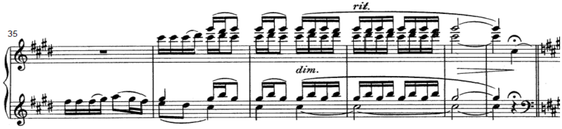
شكل رقم (٢٠)

صعوبة أداء نغمات مزدوجة متتالية في اليد اليمنى