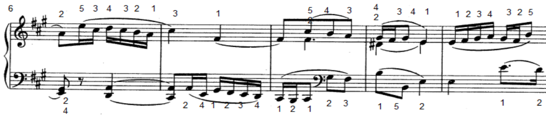
شكل رقم (١٩)