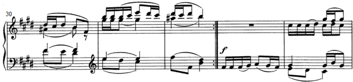
شكل رقم (١٧)

جملة مطولة نتيجة للتصوير وهي قائمة على أداء نغمات مزدوجة في اليد اليمنى ونغمات مفردة باستخدام اسلوب الأداء المتصل والرباط الزمني ، وتؤدي اليد اليسرى نغمات مفردة ومزدوجة باستخدام القوس اللحنى القصير واستخدام الرباط الزمني ، م (٣٢،٣١) تصوير م (٣٠،٢٩) على بعد اوكتاف لأعلى ، م (٣٦،٣٥) تصوير م (٣٤،٣٣) أوكتاف لأعلى .