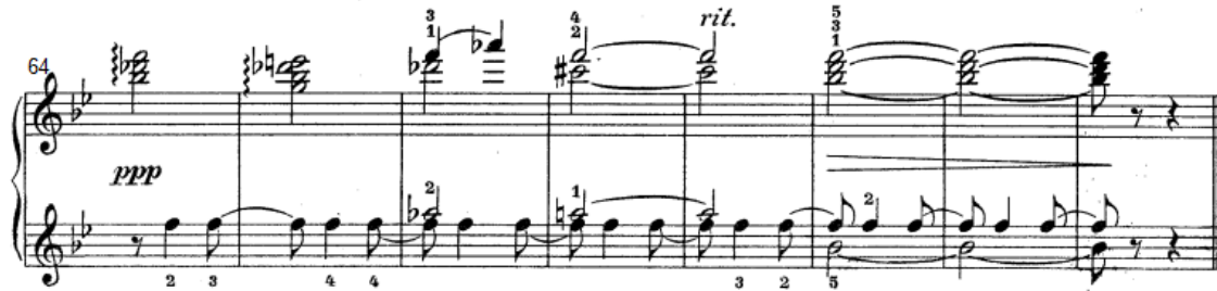
شكل رقم (١٠)

هي تكرار حرفي للفكرة الأولى وانتهت الفكره بأداء تآلفات هارمونية ممتدة باستخدام الرباط الزمني في اليد اليمنى ومصاحبة سنكوبية في اليد اليسرى مع استخدام نغمة باص ممتدة باستخدام الرباط الزمني .