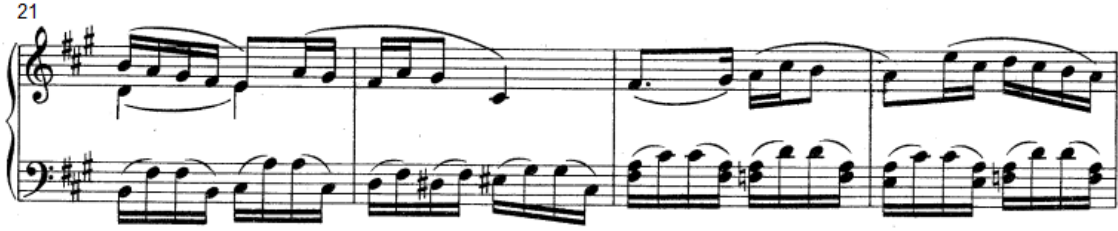
شكل رقم (١٦)

انتقلت التيمة اللحنية لليد اليمنى وتؤدي في البداية على شكل نغمات مزدوجة باستخدام اسلوب الأداء المتصل ، وتؤدي اليد اليسرى مصاحبة باستخدام القوس اللحنى القصير .