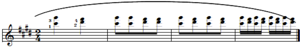
شكل رقم (٢١)

تمرين مقترح للتدريب على أداء النغمات المزدوجة المتتالية بإسلوب الأداء المتصل