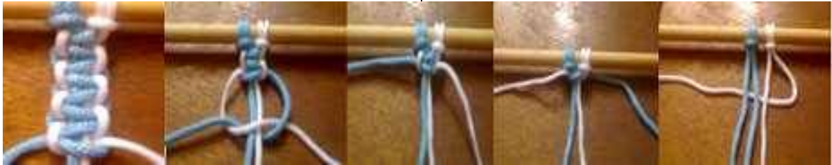
صور 2،3،4،5،6،7 توضح خطوات تنفيذ غرزة العقدة المربعة. ( http://pinterest.com )

وهي من العقد الأساسية في المكرمية وتحتاج إلى أربعة خيوط فيها الخيطان الداخليان يتشابكان مع الخيطين الخارجيين لتتكون العقدة المربعة وزخارف هذه العقدة تعطي إمكانيات متنوعة. ( http://blog.redheart.com )