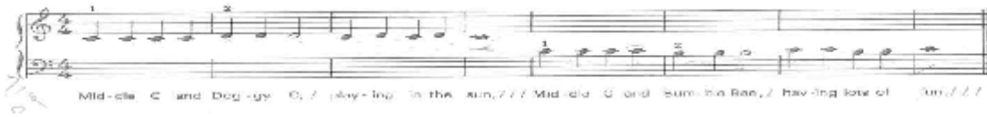
التمرين رقم (٨)

تقييم الجلسة : أدى الأطفال التمرين بشكل جيد.