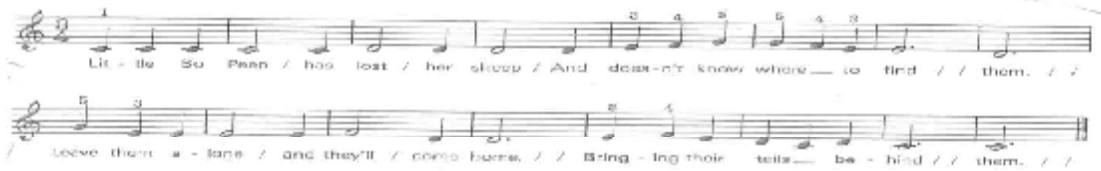
تمرين رقم (١٥)