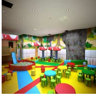
شكل (١٠) يعد الأثاث العامل الرئيسي والمهم في تصميم أو تزيين الفضاءات الداخلية

العلاقة القوية التي تجمع بين الابداع والتصميم يساهم في توسيع نطاق التفكير الابداعي في تطوير منتجات الاثاث باستخدام الخامات المتنوعة المعاصر بأشكال مختلفة ومتخصصة حسب نوع الوظيفة داخل الحيز الداخلي، الذي أدى الى الوصول ابداعات جديدة، فزاد اهتمام المصمم الداخلي بالتصميم الاثاث مما يكون له تأثير كبير على ارتياح الانسان وأصبح مرتبطا بالتكوين البصري للحيز الفضاء الداخلي عن طريق شكله ومقاييسه وألوانه.