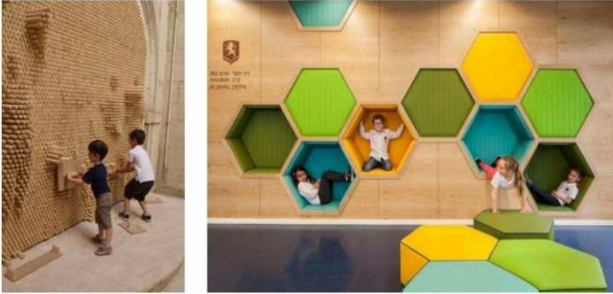
شكل (١) فكلما زادت القيمة المضافة للأعمال الفنية واصبحت ذات قيمة نفعية ووظيفية ترضي عليها جمالاً

ويعتبر الجدار هو الغلاف للفراغ المعماري فهو قد يوحي بالاحساس بالانغلاق أو الاستمرارية كما يحدد شكل الجدار ودرجة شفافيته العالقة بين الداخل والخارج، فقد استعاض مفهوم العناصر البنائية الثقيلة بالعناصر الانشائية الخفيفة والانتقال من مفهوم الصلابة والعناصر الثقيلة والتقسيم إلى مفهوم الخفة واستخدام الشفافية، فكلما زادت القيمة المضافة للأعمال الفنية واصبحت ذات قيمة نفعية ووظيفية ترضي عليها جمالاً وابداعاً آخر يثري من العمل الفني ويزيد من استمتاع المتلقي له، فأصبحت الجداريات تتحدث مع تحقيق قيمة البعد الثاني للجدار وكأنها تتحاور مع المتلقي فيصبح جزءاً من ذلك العمل الفني (1).