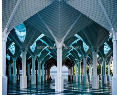
شكل (٩) تنوعت أساليب المعالجات التصميمية للفضاءات المعاصرة استناداً إلى مفهومي الوظيفة والتعبير