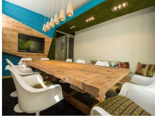
شكل (٨) ان لكل خامة تحتاج الى مهارة وفن في طرق معالجتها