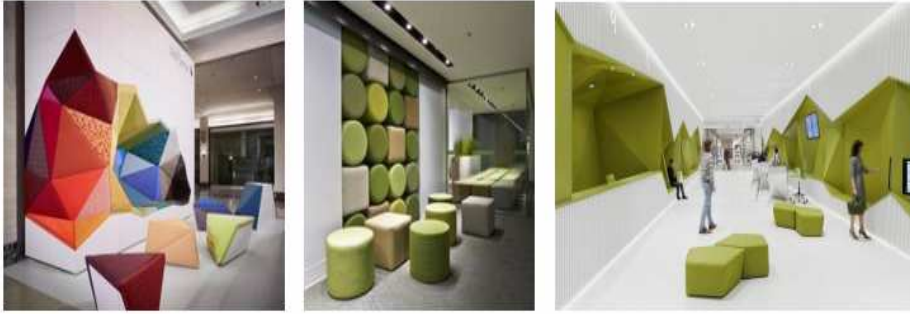
شكل (٤) تأثيرات سيكولوجية للألوان على الإنسان فإن الألوان تُؤثّر على النفس

هناك تأثيرات سيكولوجية للألوان على الإنسان فإن الألوان تُؤثّر على النفس فعندما يتم النظر إلى اللون أو الإحساس به ف يحدث في النفس إحساسات تؤدي إلى اهتزازات، بعض هذه الأفكار توحي لنا بالارتياح والطمأنينة والأخرى تؤدي إلى الاضطراب، فعند القيام بعملية تصميم لحيث داخلي ما ينظر إلى تأثيرات اللون السيكولوجية ومن بينها ما يؤثر على حجم الفضاء الداخلي الظاهري وبسبب خداع النظر وفيما يتعلق بالمسطحات والحجوم فالألوان الباردة وعلى الأخص الزرقاء الفاتحة فهي تظهر الفضاء الداخلي بأنه أكثر سعة وأكبر حجماً من حجمه الحقيقي .