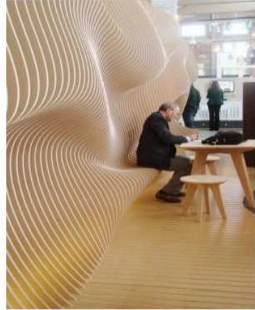
شكل (٢) الجدار هو الغلاف لل الفراغ المعماري فهو قد يوحي بالاحساس بالانفلاق أو الاستمرارية كما يحدد شكل الجدار