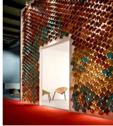
شكل (٣) يمكن استخدام خامات متنوعة على الاسطح باستخدام التفاصيل والزخارف