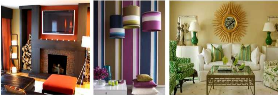
شكل (٥) منظومة الالوان في الحيز الداخلي