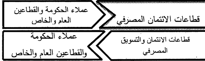
شكل رقم (٦)

ويعكس الشكل التالي الخط الفاصل بين التوجهين السابقين هو مضاعفة جهود العاملين بالتسويق الائتماني لطرق أبواب كافة القطاعات والفئات المختلفة في المجتمع من واقع المسؤولية الاجتماعية.