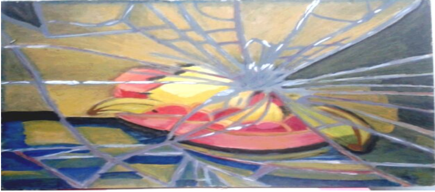
شکل رقم (١٠) أعمال طلبة

نرى في هذا العمل الفني تحطيم واضحا لمجموعة من الفاكهة حيث تظهر الخطوط مقسمة للمساحات المبيّنة في العمل الفني معتمدا على التوازن والتنظيم بالرغم من اختلاف شدة الخط وحجم المساحات المتنوعة في العمل الفني إلا انه يحتفظ باستقرار الوحدات في العمل الفني وتناول مفرداته المنكررة دون قوالب تنظيم معينة في العمل الفني كما يعطى لنا في ذلك العمل الفني التدرج اللوني في الخطوط المتنوعة فهناك نجد شدة في الضوء في الخطوط معينة وتخفيف حدة الضوء في خطوط اخرى يعطى شعورا بالانكسار الناتج عن التهشيم في المرأة