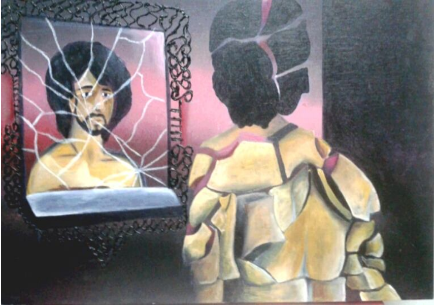
شكل رقم (٨) أعمال طلبة

فى هذا العمل الفنى يعكس صورة محطم للشخص فى المرآة انعكاسات لذاته الداخلية ونجد انه فى الواقع جسده