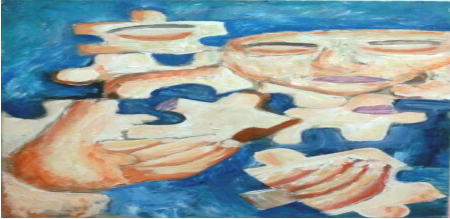
شكل رقم ( ٢ ) أعمال طالبة