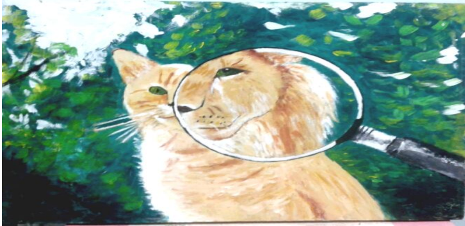
شكل رقم (٤) أعمال طالبة

في هذا العمل الفني نرى اكتشاف للمنطق الشكلي مع إظهار الجانب الأخر من اللوحة حيث يعطى توازن بين العلاقات الشكلية حيث القطه والجانب الأخر تظهر أنها وجه اسد و قد يكون هناك تقارب في الشكل الظاهري إلا انه قد يكون اختلاف في القوى الكامنة داخل كل من الاسد والقطه