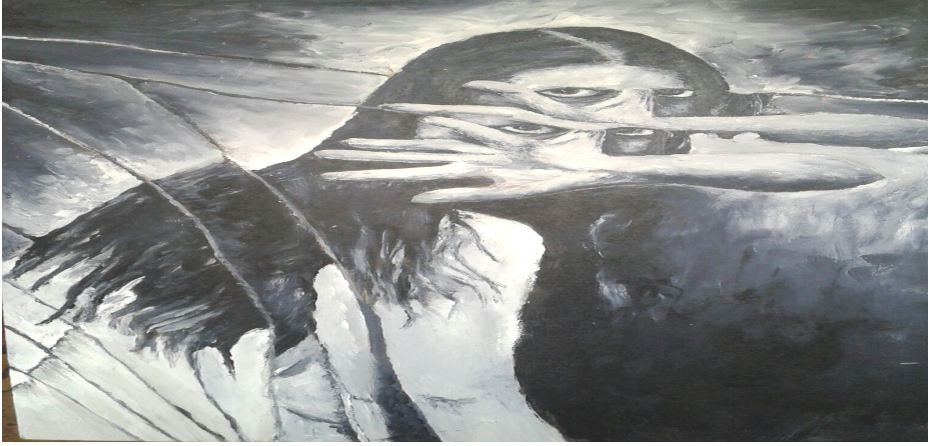
شكل رقم (٦) أعمال طالبة

هذا العمل الفني نرى صوت القيم الفنية والجمالية من خلال الايقاع الذى نراه فى اللوحة نتيجة تحطيم المرأة والذى يحدث التكرار فى ملامح الفتاه من العيون واليد والشعر، ينقل لنا الشعور بالخوف الذى يمتلك تلك الفتاه مع استخدام التناسب فى توزيع اللون الأبيض والأسود فقط .