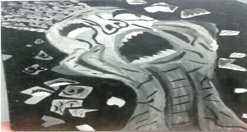
شكل رقم ( ٣ ) أعمال طالبة

في هذا العمل الفني نرى انعكاس الشخص في قطع متناثرة من المرايا المحطم الصغيرة ويحاول تجميعها أجزاءها المتشعبة حتى يكتمل الكل ويختص العمل الفني قد تحقق من القيم والمعاصر الجمالية للعمل الفني حيث التبادل بين الشكل والأرضية وتغير مساحات الشكل المنعكس في قطع المرآة المتناثرة مع عمليات الحذف إلى بعض الأجزاء مع الحفاظ على ترابط أجزاءها والاتزان بين العلاقات الشكلية مع العلاقات العددية