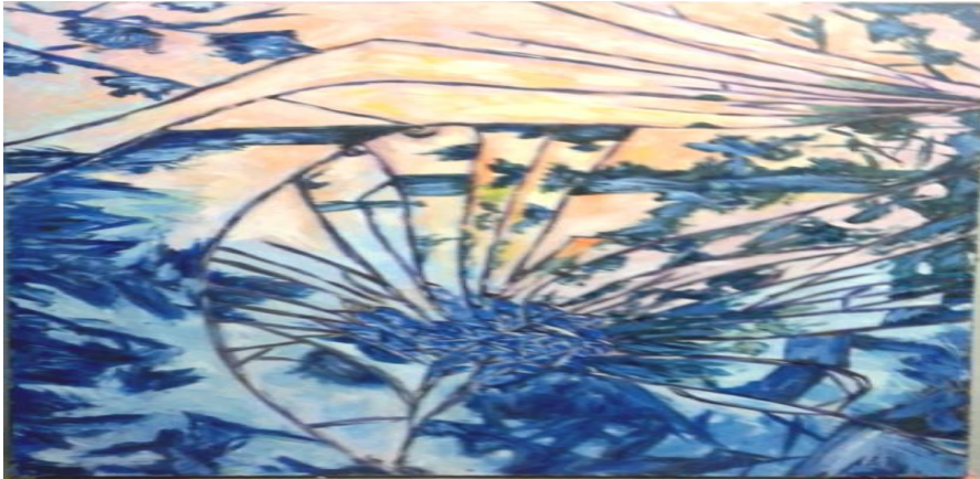
شکل رقم ( ٩ ) أعمال طلبة

نرى في هذا العمل الفني الالتواء إلى للشكل نتيجة تأثير عدسة المرآة المكبرة والتي تخضع جميع عناصر العمل الفني لإمكانيتها حيث الخط والشكل والأرضية مع اختلاف في الحجم للأشكال المنعكسة يعطى جمالا للعمل الفني ويتم أيضا التناسب في توزيع اللون في مساحات الأرضية بألوان تتناسب مع الشكل مما يعطى شعورا قويا بالتوازن في العمل الفني