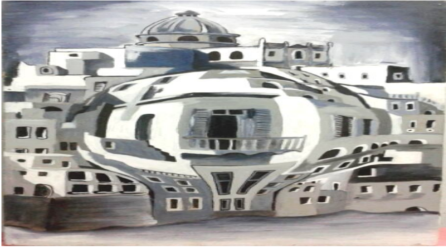
شكل رقم (٧) أعمال طالبة

هذا العمل الفني نرى صوت القيم الفنية والجمالية من خلال الايقاع الذى نراه فى اللوحة نتيجة تحطيم المرأة والذى يحدث التكرار فى ملامح الفتاه من العيون واليد والشعر، ينقل لنا الشعور بالخوف الذى يمتلك تلك الفتاه مع استخدام التناسب فى توزيع اللون الأبيض والأسود فقط .