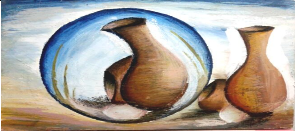
شکل رقم ( ٨ ) أعمال طلبة

نرى في هذا العمل الفني الالتواء إلى للشكل نتيجة تأثير عدسة المرآة المكبرة والتي تخضع جميع عناصر العمل الفني لإمكانيتها حيث الخط والشكل والأرضية مع اختلاف في الحجم للأشكال المنعكسة يعطى جمالا للعمل الفني ويتم أيضا التناسب في توزيع اللون في مساحات الأرضية بألوان تتناسب مع الشكل مما يعطى شعورا قويا بالتوازن في العمل الفني