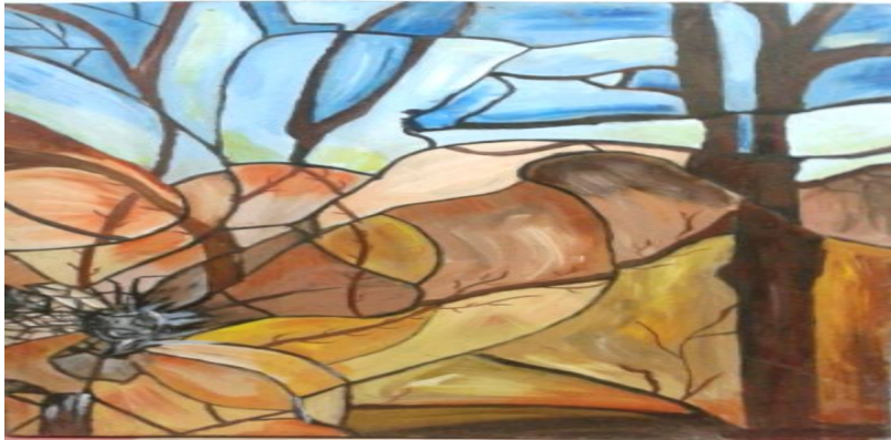
شكل رقم (٥) أعمال طالبة

فقد نجد في العمل الفني انه قد يولد من الضعف قوة لا حصر فيها حيث نجد ترابط في الشكل والمعنى و انعكاس المضمون الجوهري في العمل الفني .