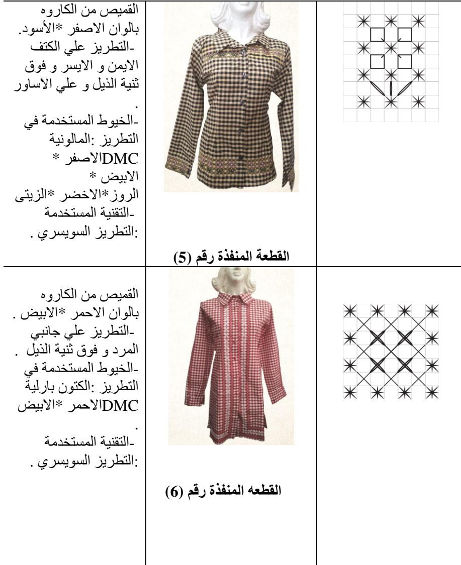
القطعة المنفذة رقم (5)