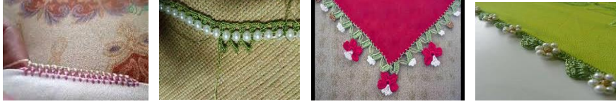
الاشكال رقم ( ٣ ، ٤ ، ٥ ، ٦ ) توضح بعض النماذج من التطريز التركي

و توضح الاشكال التالية بعض من النماذج المختلفة لأسلوب التطريز التركي :