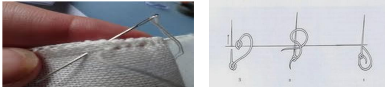
شكل رقم (٧، ٨) يوضحان الخطوة الاولى من التطريز التركي،

(١) الخطوة الاولى: يمسك الخيط باليد الشمال و يلف في اتجاه عقارب الساعة من الامام الي اعلي حول السبابة ثم ندخل الابرة تحت الخيط الموجود و يغرز في القماش ويرفع الخيط من السبابة الي الابرة مكونا حلقة حول حافة القماش ثم تثبت و تكرر لتتكون صف من الغرز الحلقية مكون من غرزة البطانية الضيقة ، و الاشكال الاتية توضح خطوات العمل .