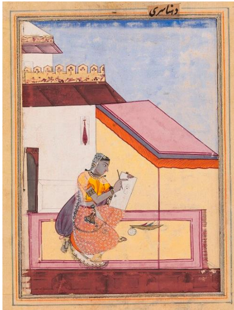
لوحة : (٢)

جاءت مقدمة التصويرة عبارة عن أرشية باللون الأحمر وضع عليها كرسي لتجلس عليه السيدة وزهرية الزرع وقنينة شراب، أما عن خلفية التصويرة فقد شغلها المصور بجزء من منزل السيدة الذي يظهر من الداخل باللون الأبيض وبه فتحه باب معقودة، والجزء الآخر جاء باللون الأصفر، وعبر عن الأفق باللون الأزرق الفاتح اشتملت التصويرة من أعلى على كلمة "كن كلي" وترجمتها: "جنكالي Gunakali"