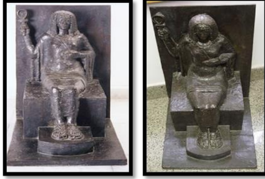
شكل رقم (٩) الوجه القبلى

أهالى الوجه البحرى الممثلون فى هذه الشخصية الرمزية المتميزة الملامح