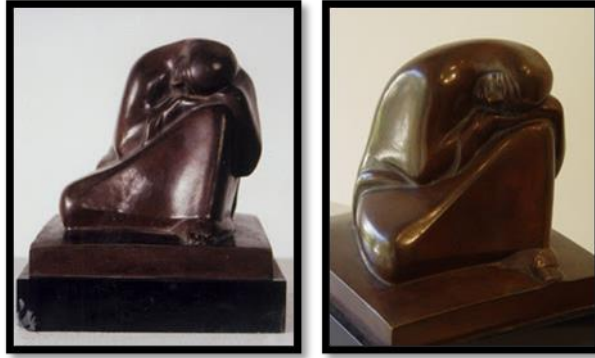
شكل رقم (١٤) الراحة

وهذا التمثال هو أشهر تماثيل محمود مختار واحبها الى قلوب عشاق فنه، تتمثل فيه أروع صفات نحته مع تكامل شخصيته الفنية فى تعبيره عن رمز مصر الزراعية ورمز الأمومة وربة الأسرة ونموذج العمل ونبع الحياة.. فهو اجمل اعمال مختار خارج دائرة الادب السياسى رغم انه مشحون بالتعبير الوطنى، كما انه يعبر عن الانوثة المكتملة الناضجة ولكنها ليست انوثة الجوارى، فهى معتده بنفسها فخورة باكتمال نضجها، محتشمة رغم انها تكشف عن مفاتها، ثابتة ساكنة وفى نفس الوقت تتفجر حيوية وحياة.. انها تقدم باختصار ما نسميه "سحر الفن" الذى يستحوذ على المشاهد ويملك عليه احساسه ولا يستطيع مقاومة التطلع اليه والاحساس بالطرب والسعادة