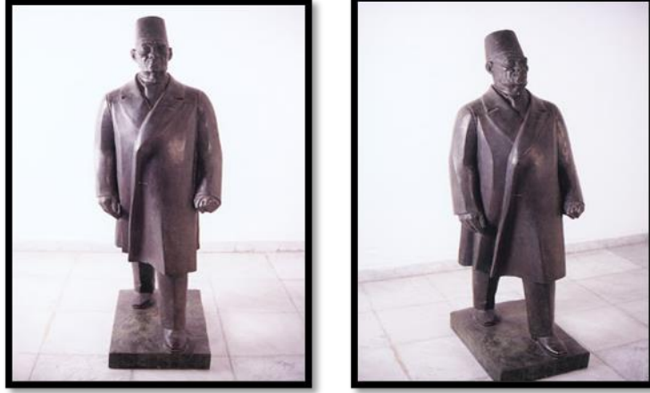
كل رقم (٦) تمثال سعد زغلول بالإسكندرية