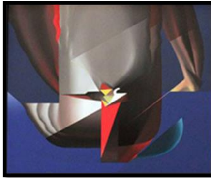
شكل رقم (٢) معرض "عرس الشهيد للفنان أحمد نوار (عمل ١)