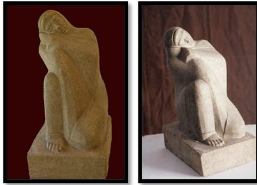
شكل رقم (١٠) قيلولة (إغفاءة)

ولقد كان الفنان مختار أحد طلائع النهضة المصرية المعاصرة المبشرة بالتقاؤل بالبعد القريب حيث تمثلت فى أعماله قدرة الفنان الإنسان على أن يعبر عن روح جنسه وشخصية عصره .. ومعالم بيئته وأن يؤكد ذاتيته من خلال تعبيره الشامل عن شخصية المجموع، فلكل تمثال من تماثيله يتضمن الأحداث التى أحاطت به ومناطق القوة والجمال بالإضافة إلى دور هذه التماثيل فى إحياء الذاكرة للتعريف بفترة النهضة ومواجهة التخلف ومقاومة الاستعمار الإنجليزى والحصول على الدستور وبدايات التحرر لقد كانت العشرينيات من القرن العشرين هى سنوات النهضة نزع مظاهر التخلف والتبعية.. لقد كان مختار المثل أحد قادة حزب الثورة الوطنية حزب الوفد الذى صنع أمجاد العشرينيات من القرن الماضى ومن أهم تماثيله: