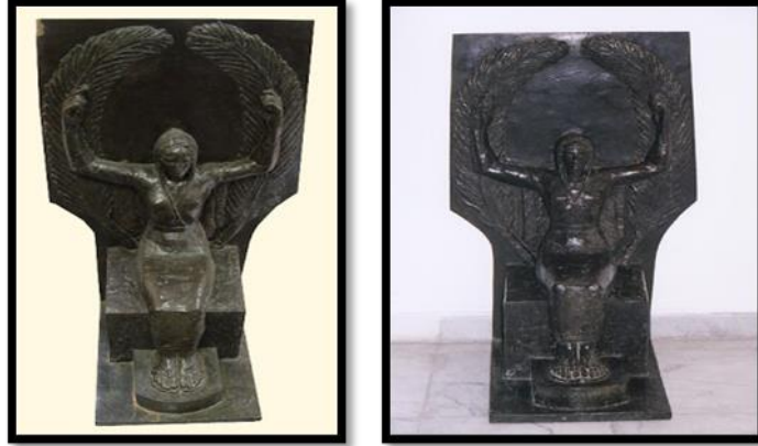
شكل رقم (٨) الوجه البحرى

سعد وخطبه من كلمات بشرية الى كتل منحوتة، وانتقل بها من العبارة الى الرمز)