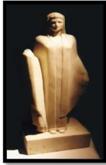
شكل رقم (١٢) الفلاحة

هى التى تستخدم عادة - بعد لفها لتوضع على رأس الفلاحة تحت الجرة عندما تحملها وهى مملوءة بالماء فى طريق العودة.. يقول بدر الدين أبو غازى عن هذا التمثال انه يصور 'فلاحة تصلح رمزاً لشعب بأسره، فى خطوطها وحدة متناسقة تحقق التوازن البنائى للتمثال، ويتمثل ذلك فى يدها التى تسند الجرة، ويدها الأخرى التى تضعها فى شاعرية تشكيلية على صدرها، فيتحقق ايقاع يتردد مع باقى خطوط التمثال ومسطحاته، مع الاستخدام الذى للخطوط الرأسية المستقيمة ومايدخله عليها من تكسير محدود يدل على براعة وذكاء، مع نضج فى الفكر الفنى. اما خلفية التمثال فالخطوط تتقابل وتبتعد، يستخدم الممثل العظيم منجزات الفن التجريدى ويستوعب تجارب الفن الحديث دون ان يتقيد بأى مدارس.. انه يستخلص منها ما يتفق مع احساسه الفنى ثم يقوم بصياغة عمله الفنى فى حبكة بنائية محكمة.