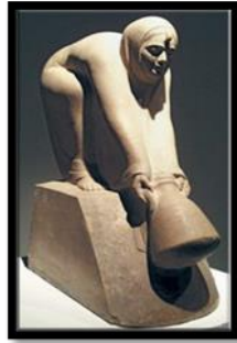
شكل رقم (١٦) تمثال للفنان محمود مختار يوضح شكل من أشكال مشاهد الريف

كتفيه، يمسكها بيمناه بينما يسند عليها يسراه في وضع استرخاء رائع من الناحية الجمالية تشكلياً، الرأس المرفوع يلتفت يميناً وينظر الى بعيد، الفراغ بين العصا والذراع في كل جانب عبارة عن مثلثان يرددان شكل المثلث الكبير الذي تشكلت منه كتلة التمثال العليا، بينما طيات الأكمام المثمرة تصنع تدرجاً بين اتساع الشكل من أعلى ورقته في النصف السفلى.. اما كلب الحراسة عند قدمي الحارس فهو يكمل المشهد، ويدخل في كتلة التمثال العامة ويحقق احساساً باتساع القاعدة الضيقة لتتحمل (تشكلياً) ثقل وضخامة النصف العلوي.. الحارس يقف في وضع ترقب واستعداد وهو هنا يعبر عن حرص الفلاح على حماية أرضه من عبث الطامعين من المستعمرين والغزاة.. فقد كانت مصر في عصر محمود مختار بلد زراعي وحسب.. وحارس الحقول يشبه في شكله العام "خيال المآته" الذي يقام في الحقول كدمية تخيف الطيور التي تهدد المحاصيل