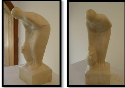
شكل رقم (١١) على شاطئ التربة

(الظهيرة) لتستريح قليلا، فتنام وهي جالسة مسندة رأسها على يدها مستعدة لتلبية أى طلب من ابنائها أو زوجها. والجانب الانساني في هذا التمثال مع قوة ملاحظة الفنان لامهات جيله ومدى معاناتهن هو من مثيرات الاعجاب بهذا العمل، فقد أنجز تشكيلا يتميز بصلابته النحتية وكتلته المعبرة، وهو ما يطلق عليه اسم (الطرز البنائي في النحت) حيث احترم الفنان كتلة الحجر وأبقى على شكلها الأصلي دون أن يخرقها بفجوات عميقة أو تقويب وفراغات وهذا التكامل بين الشكل والمعنى هو أحد مميزات الفن الناجح العميق الأثر في المشاهدين.