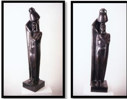
شكل رقم (١٣) تمثال حاملة الجرة

الصرحي المتعلقة بالسمو واستقامة الخطوط واتجاهها الى أعلى، كما توصل الى حلول جمالية (شكلية) لتغلب على زهامة كتلة الملابس الفضفاضة التي لا تشف ولا تضيق حتى تظهر تفاصيل الجسم، وهذه الحلول توصل اليها عن طريق حركة اليدين خلف هذه الملابس ليتوصل الفنان عن طريق تتابع طبقات الرداء الى مستويات وتضليعات تقترب من الأعمدة.. ان الحلول المعمارية في معالجة الملابس حققت نتائج جمالية تشكيلية وفي نفس الوقت ابرزت ما ينشده الفنان من حيوية الشكل مع الاحساس بالسمو والعظمة.. انها ليست مجرد فلاحه ولكنها رمز لمصر في عظمتها وزهوها. ونلاحظ أن الفنان دخل في حوار ومنافسة، مع النحت المصري القديم، فنزع عنه طابعه الديني وانحساره في فكرة "الأخرة"، وتحول بفن النحت الى الحيوية والتأكيد على ضرورة التقدم في الحياة المعاصرة، وجعل النحت في خدمة الآمال الانسانية في حياة أفضل، بدلاً من تأجيل الحياة الأفضل الى مابعد الموت