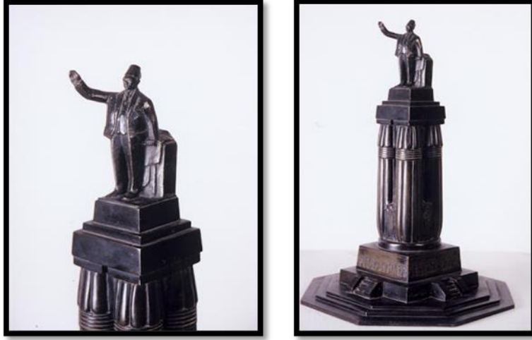
شكل رقم (٧) صرح سعد زغلول