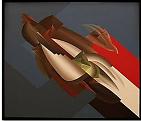
شكل رقم (٣) معرض "عرس الشهيد للفنان أحمد نوار (عمل ٢)