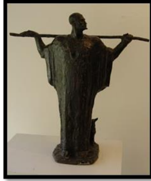
شكل رقم (١٥) حارس الحقول

ولو للحظات بين أوقات العمل. المرأة هنا رمز للعمل والجهاد، وتخلو تماماً من أى احتفال بأنوثتها، ويتم تعويض ذلك بالعلاقات الشكلية بين المثلثات المتقابلة والمختلفة الاحجام، فهي جماليات شكلية تعوض الجماليات الحسية، تخاطبنا بالمثل العليا للعمل ورعاية الأسرة والأمومة، وهي صفات غير صريحة ولكننا نستشفها من تعبيرات التمثال.. لقد كانت ربة الأسرة في عصر مختار تحمل على اكتافها اعباء جسام وتبذل جهداً مضنياً ليلاً ونهاراً في سبيل راحة أسرتها، فوسائل الرفاهية المنزلية وادوات الغسل والطهي وأنابيب المياه والانارة بالكهرباء.. كلها لم تكن قد عرفت بعد.. وكانت ربة الأسرة تعمل ليلاً ونهاراً من أجل راحة بقية الافراد، ان هذا التمثال ينشط ذاكرة المشاهدين