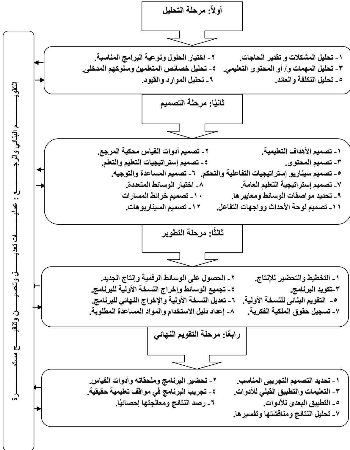
شكل (٣) نموذج محمد عطية خميس (٢٠٠٧)