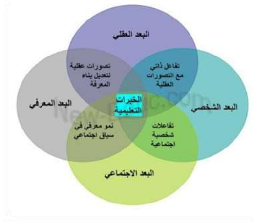
شكل (٢) أبعاد تصميم الأنشطة التعليمية

التعلم، ومن النظريات الحديثة التي ارتبطت بالتطور التكنولوجي المعاصر النظرية الاتصالية التي تسعى لوضع التعلم عبر الشبكات في إطار اجتماعي فعال والتركيز على نشاطات التعلم التفاعلية لتشجيع مستويات التفكير العليا مع توفير التفاعل الاجتماعي للطلاب والمعلم بصور مختلفة.