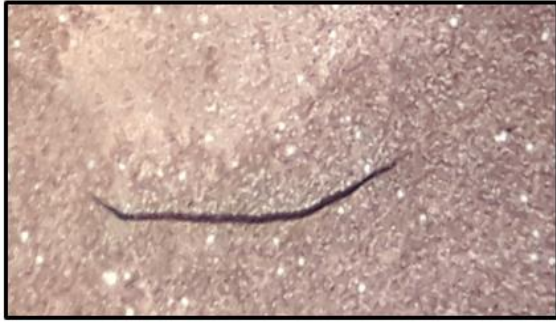
شكل (2) يرقة الديدان الخيطية الدقيقة باستخدام طريقة التصبغ بصبغة كيمزا (Giemsa stain) تحت قوة تكبير X 40