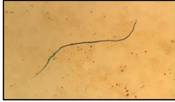
شكل (1) يرقة الديدان الخيطية الدقيقة باستخدام طريقة التركيز (Knott concentration method) تحت قوة تكبير X 40