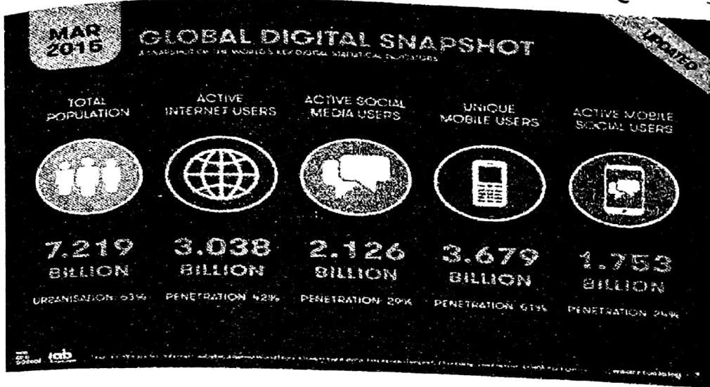
شكل رقم (١) مستخدمي التكنولوجيا الرقمية في العالم

ويتوقع بحلول عام ٢٠٢٠ أن تكون الهواتف المحمولة هي أداة الاتصال الأولية للإنترنت بالنسبة لمعظم الناس في العالم، فاستخدام الهواتف المحمولة لم يعد مجرد وسيلة للتحدث، ولكنه أصبح وسيلة من وسائل الاتصال بالإنترنت وبث المعلومات.