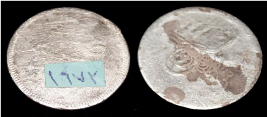
(لوحة رقم ٩) ترجع الي عهد الخديوي عباس الثاني سنة ١٣٢٧هـ