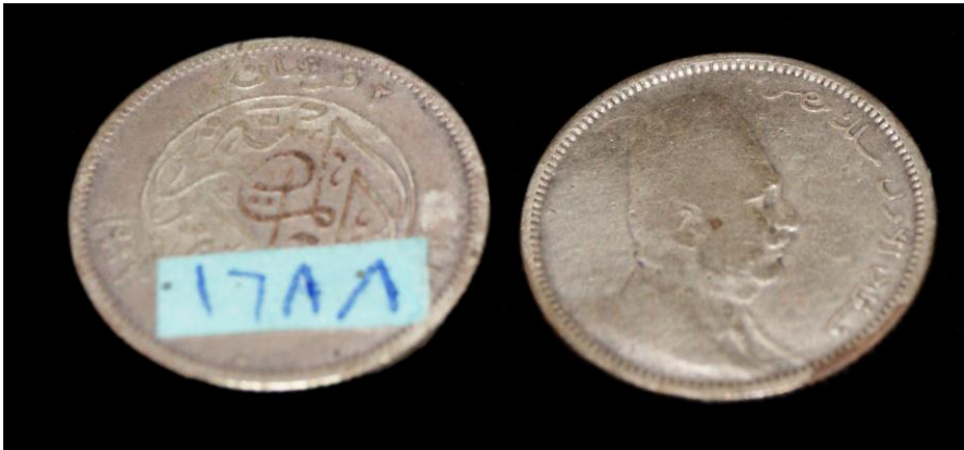
(لوحة رقم ٢٤) ٢ قرش في عهد الملك فؤاد ١٣٢٨هـ