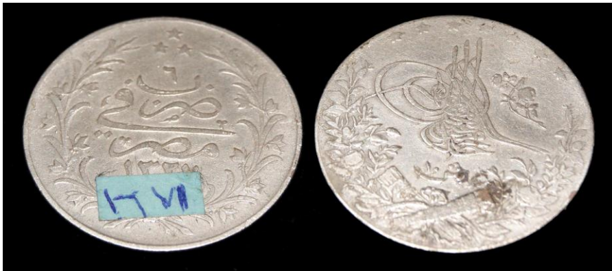
(لوحة رقم ٧) ترجع الي عهد الخديوي عباس الثاني سنة ١٣٢٧هـ