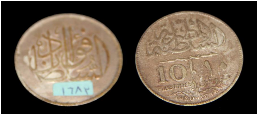
(لوحة رقم ١٩) في عهد الملك فؤاد ١٣٢٨هـ