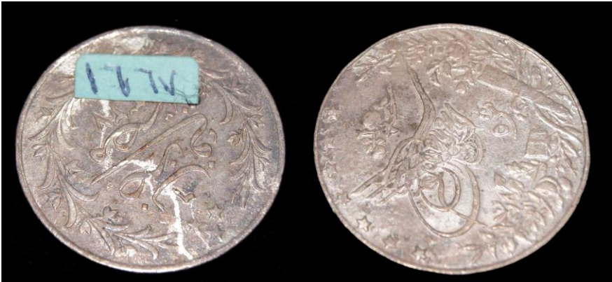
(لوحة رقم ٤) ٥ قرش من عهد السلطان عبدالحميد والخديوى توفيق سنة ١٢٩٣هـ