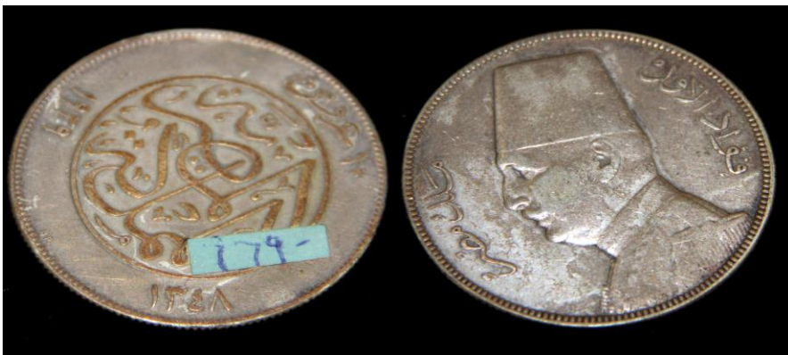
(لوحة رقم ٢٥) ١٠ قرش من عهد الملك فؤاد ١٣٤٨هـ