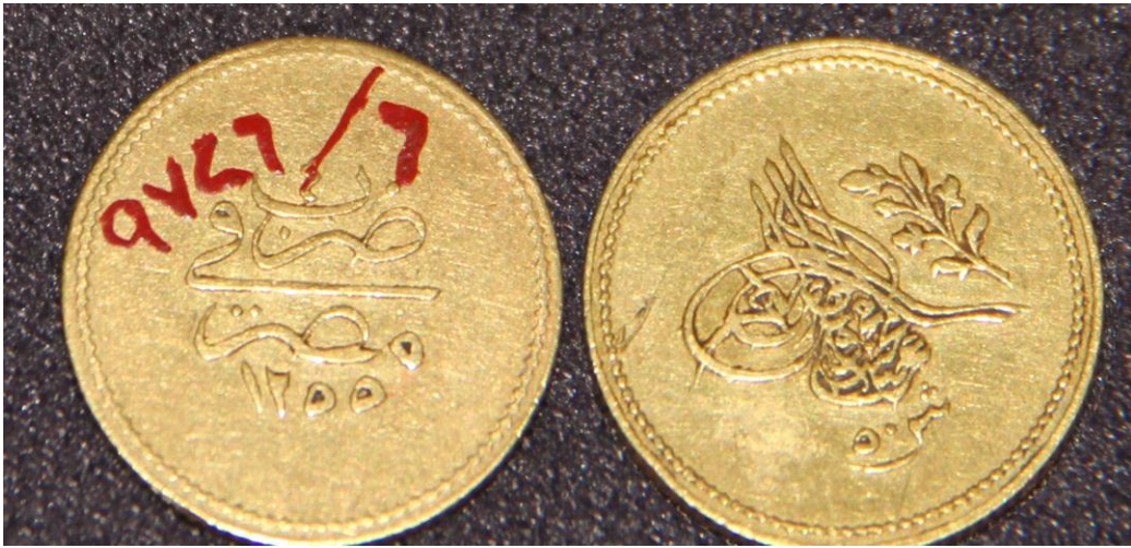
(لوحة رقم ١) ٥٠ قرش عهد السلطان عبدالمجيد في ولاية محمد على سنة ١٢٥٥