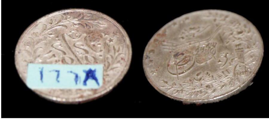
لوحة رقم (لوحة رقم ٥) ٢ قرش من عهد السلطان عبدالحميد والخديوى توفيق سنه ٥١٢٩٣