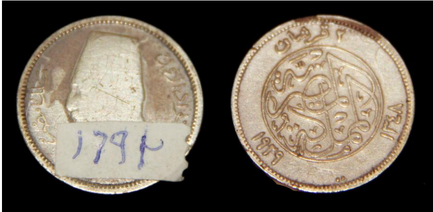
(لوحة رقم ٢٧) ٢قرش من عهد الملك فؤاد ١٣٤٨هـ