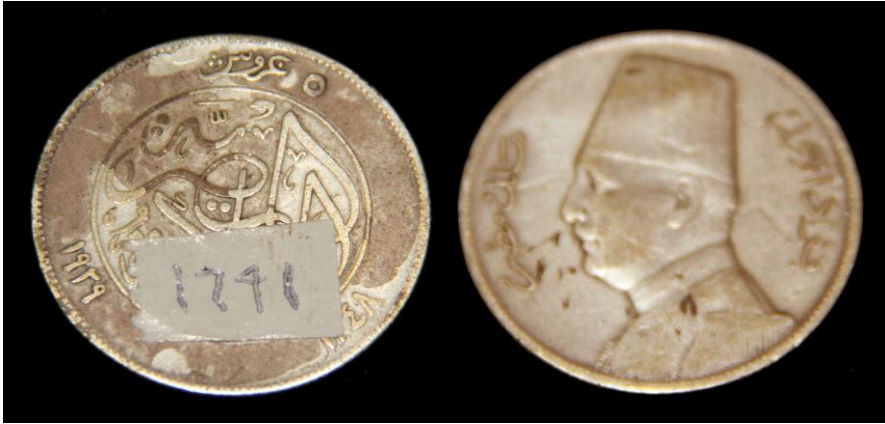
(لوحة رقم ٢٦) ٥قرش من عهد الملك فؤاد ١٣٤٨هـ