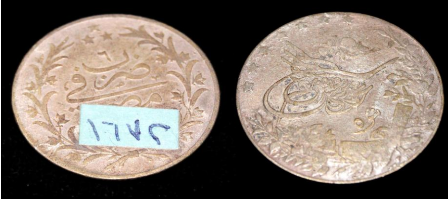
(لوحة رقم ٨) ترجع الي عهد الخديوي عباس الثاني سنة ١٣٢٧هـ