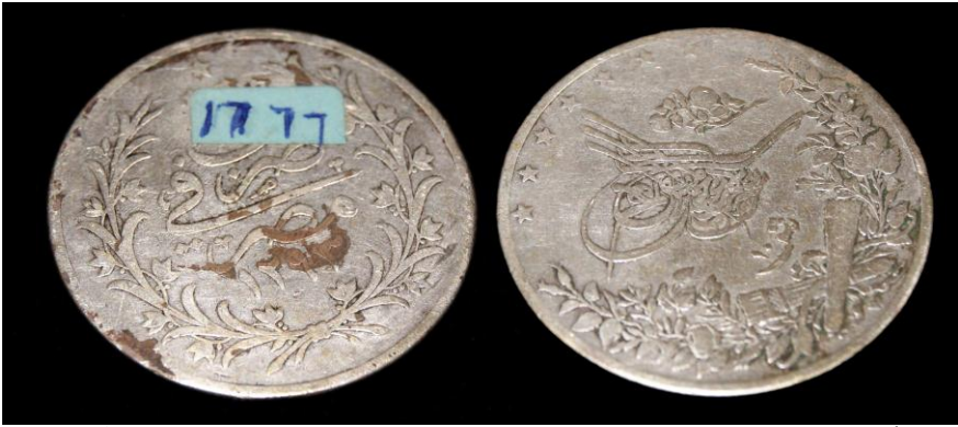
(لوحة رقم ٣) ١٠ قرش من عهد السلطان عبدالحميد والخديوى توفيق سنة ١٢٩٣هـ