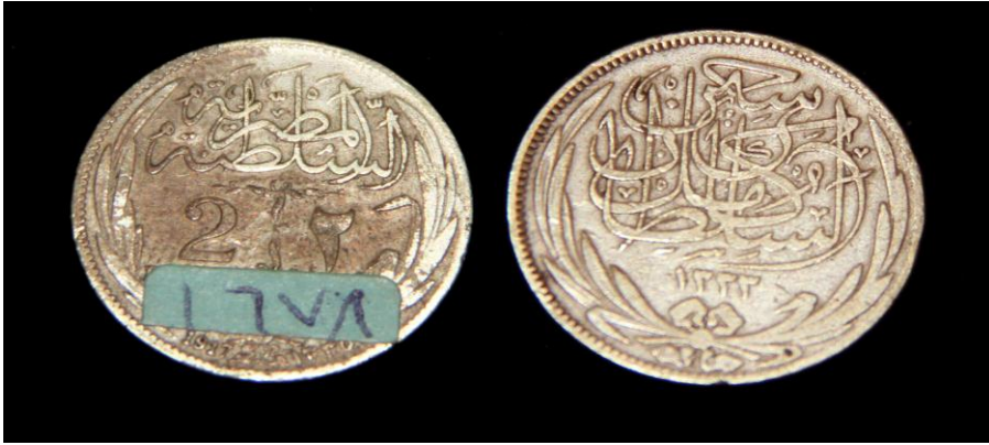
(لوحة رقم ١٥) لوحة رقم من عهد السلطان حسين كامل ٥١٢٩٣