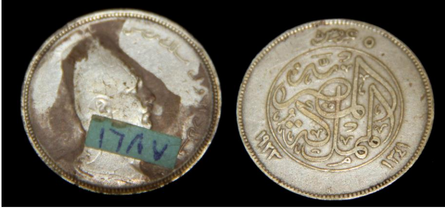
(لوحة رقم ٢٣) في عهد الملك فؤاد ١٣٤١هـ