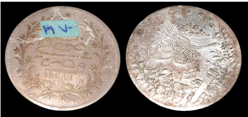
(لوحة رقم ١٠) ترجع الي عهد الخديوي عباس الثاني سنة ١٣٢٧هـ