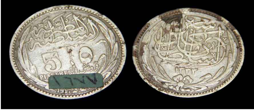
(لوحة رقم ١٤) لوحة رقم من عهد السلطان حسين كامل ٥١٢٩٣