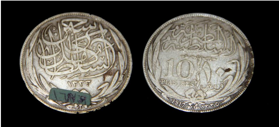
(لوحة رقم ١٣) لوحة رقم من عهد السلطان حسين كامل ١٢٩٣هـ