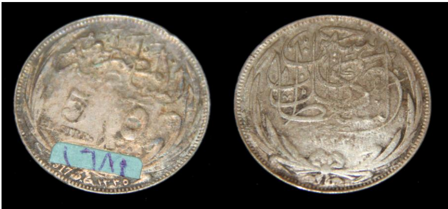
(لوحة رقم ١٨) لوحة رقم من عهد السلطان حسين كامل ١٢٩٣هـ