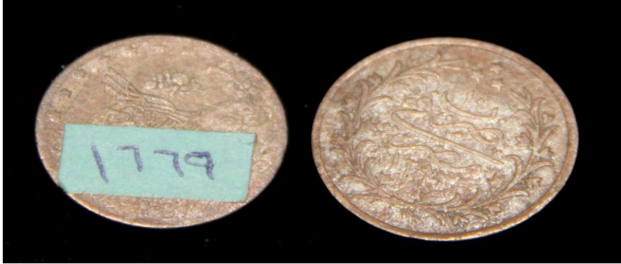
(لوحة رقم ٦) من عهد السلطان عبدالحميد والخديوى توفيق سنه ٥١٢٩٣