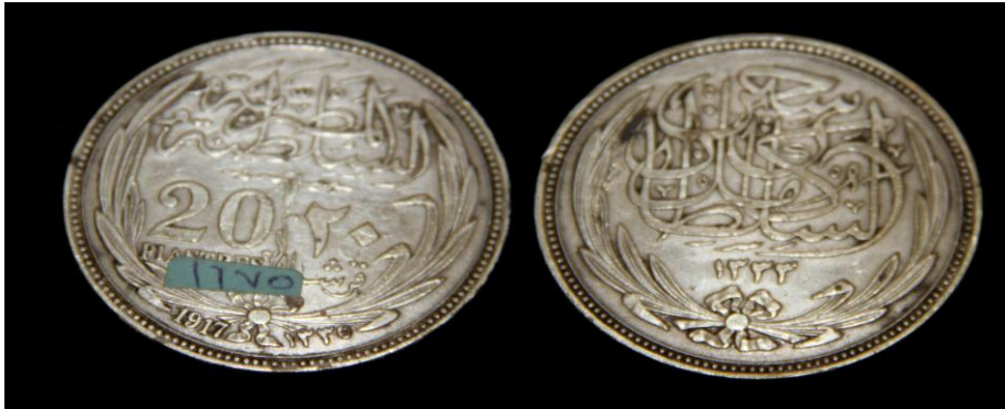
(لوحة رقم ١٢) لوحة رقم من عهد السلطان حسين كامل ١٢٩٣هـ