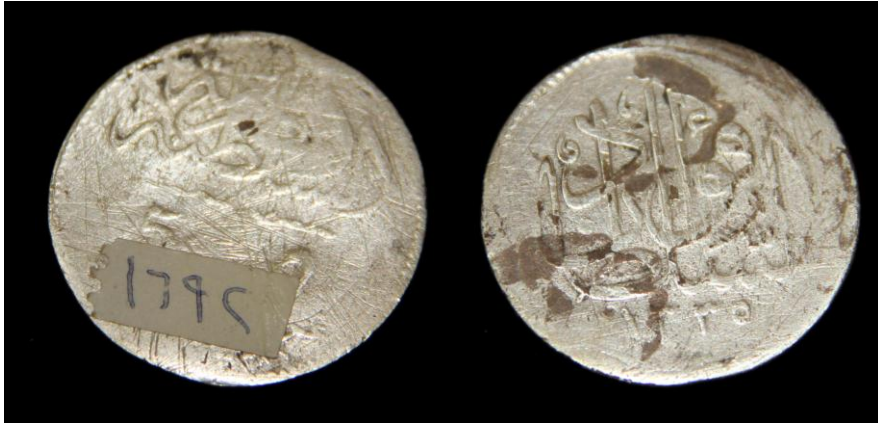
(لوحة رقم ٢٠) في عهد الملك فؤاد ١٩١٧ هـ