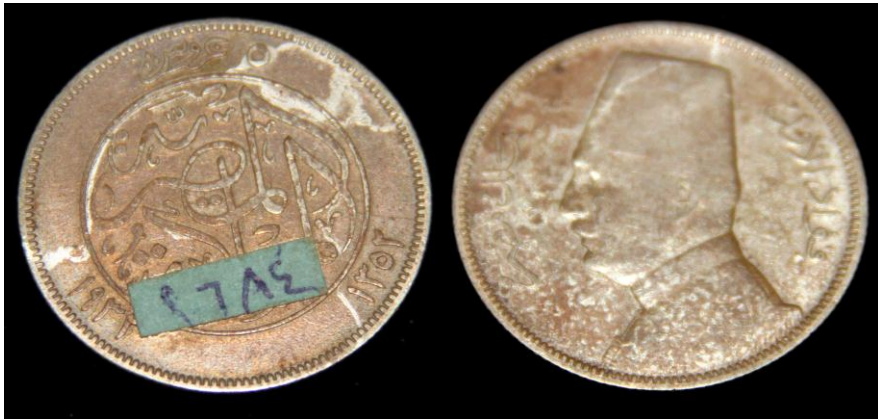
(لوحة رقم ٢١) في عهد الملك فؤاد ١٩١٧ هـ