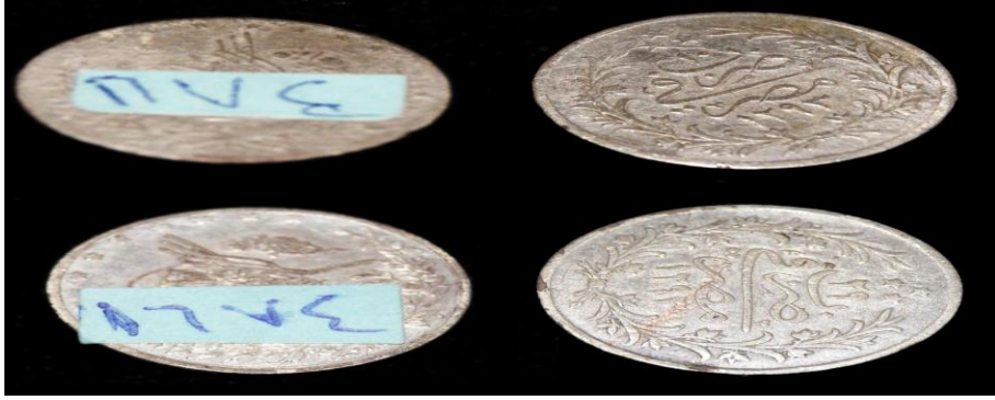
(لوحة رقم ١١) لوحة رقم من عهد الخديوي عباس الثاني ١٢٩٣هـ