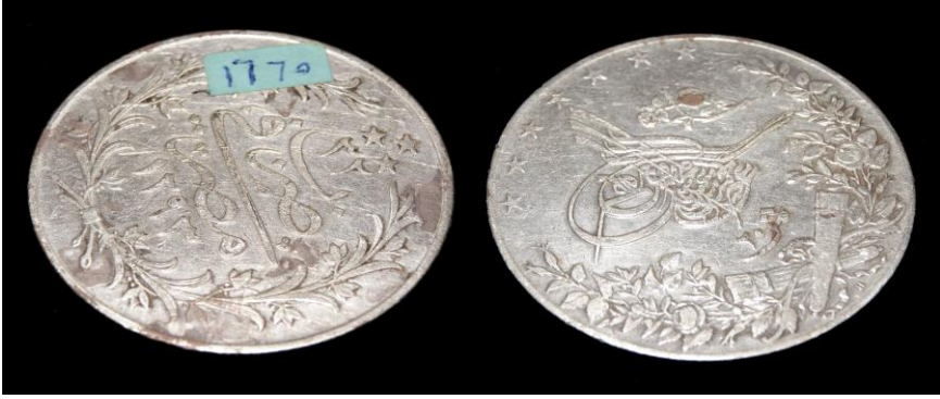
(لوحة رقم ٢) ٢٠ قرش من عهد السلطان عبدالحميد والخديوى توفيق سنة ١٢٩٣هـ