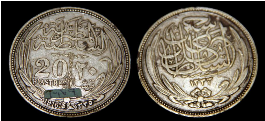
(لوحة رقم ١٦) لوحة رقم من عهد السلطان حسين كامل ٥١٢٩٣