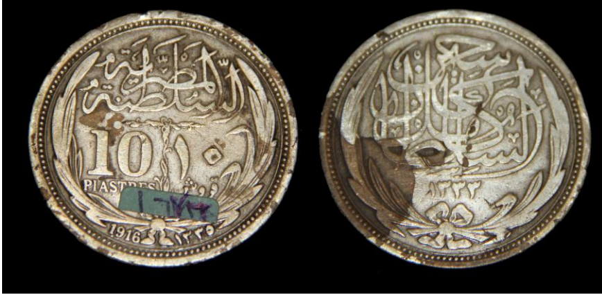
(لوحة رقم ١٧) لوحة رقم من عهد السلطان حسين كامل ١٢٩٣هـ