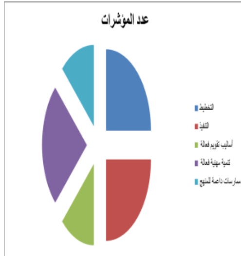
شكل (٢) مجال المعلم