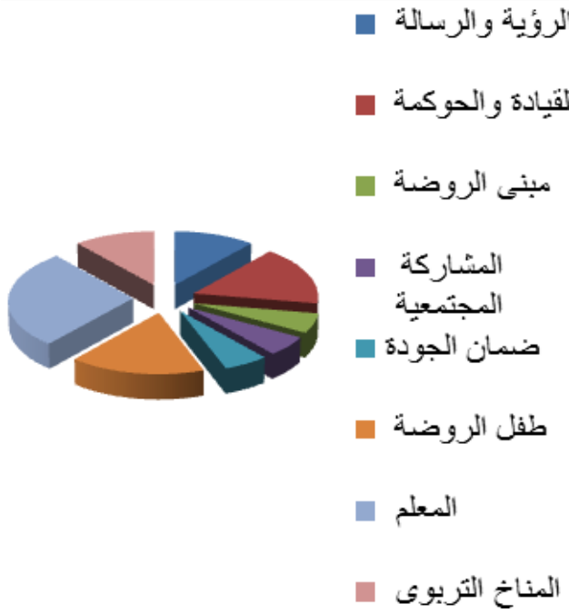
شكل (١) مجالات الجودة