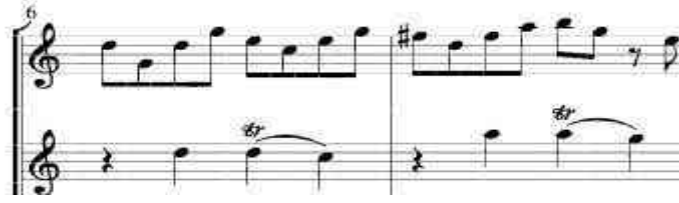
شكل رقم (٩)