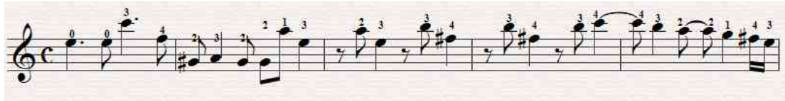
شكل رقم (٥)

النموذج باستخدام ترقيم لأصابع المقترح من قبل الباحثة