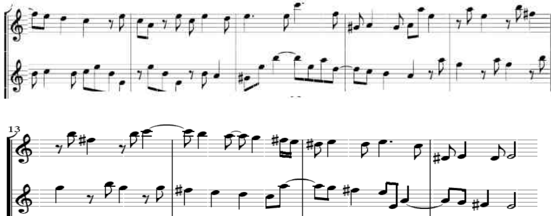
شكل رقم (٣)

الفكرة b تبدأ من ( ٨ : ١٦) وتنتهي بقفلة تامة في سلم الدرجة الثالثة مي الصغير.