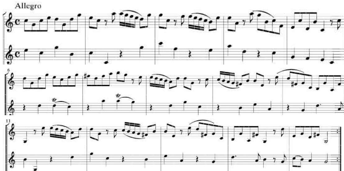
شكل رقم (٧)

الفكرة a تبدأ من (١ : ١٥) وتنتهي بقفلة تامة في سلم صول الكبير