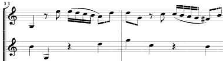
شكل رقم (٨)

ظهرت في م (٢، ٣)، (٧، ٨)، (١١، ١٢) وتتمثل هذه الصعوبة في أداء النغمات السلمية بقوس لحنى واحد ليجاتو للكمان لأول كما في الشكل التالي: