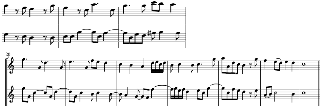
شكل رقم (٦)