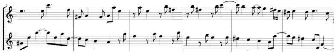
شكل رقم (٤)

ظهرت من م (١٠ : ١٥) وهي تتمثل في أداء الوضع الثاني واستخدم ام لإصبع الرابع لأداء نغمتين متتاليتين كما في الشكل التالي: