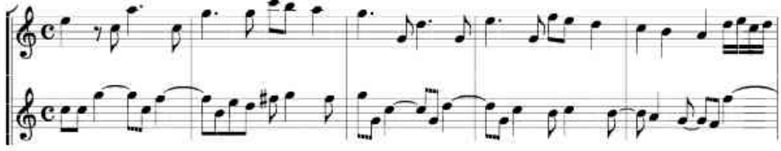
شكل رقم (٢)

ظهرت من م (٢ : ٧) وتتمثل في إتقان الرباط الزمني في الصوت اللحني الثاني والحصول علي التنغيم الجيد بين الصوتيين اللحنين كما في الشكل التالي: