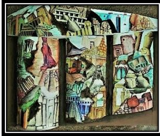
(٦ - ١) عمل فني طلابي بمجال الرسم والتصوير، ١٠٠سم*١٥٠سم، ألوان مائية وأقلام حبر.