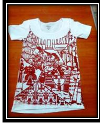
(١- ب) عمل طلابي (تيشرت) طباعة شاشة حريرية.