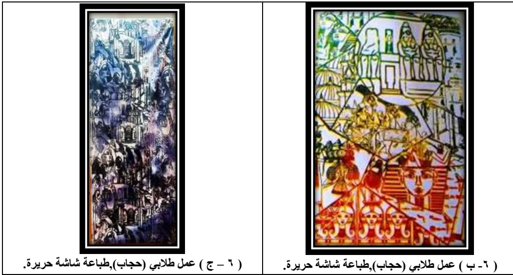
(٦ - ج) عمل طلابي (حجاب)، طباعة شاشة حريرة.