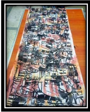
( ١- ج ) عمل طلابي (حجاب) طباعة شاشة حريرية.