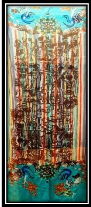
(٤ - ج) عمل طلابي (حجاب),طباعة شاشة حريرية.