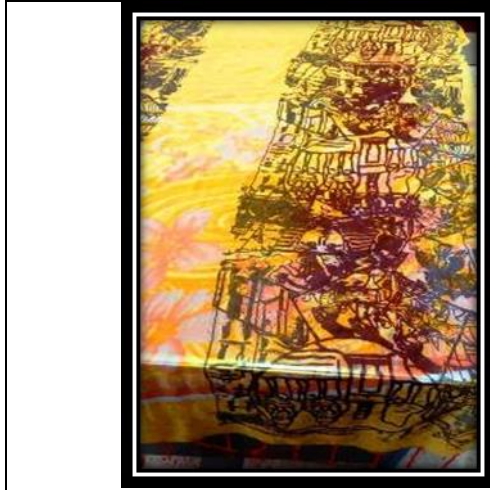
(٢ - ج) عمل طلابي (حجاب)، طباعة شاشة حريرية.