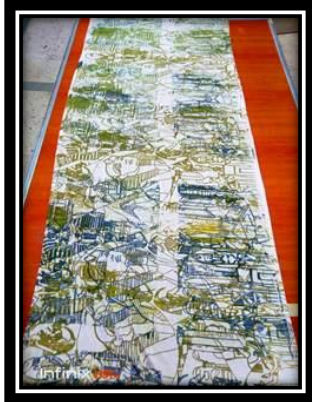
(٣- ج) عمل طلابي (حجاب), طباعة شاشة حريرية.