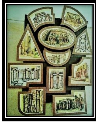
(٣- أ) عمل فني طلابي بمجال الرسم والتصوير, ١٠٠سم*١٥٠سم, ألوان مائية وأقلام حبر.

قراءة العمل الطباعي وتحليله :التنوع والاختلاف في حركة العناصر والتوليف والدمج بين الشكل والأرضية والإيقاع المنغم بين الأشكال الهندسية ساعد العين على التحرك ببسر في جميع أنحاء العمل المطبوع واختلاف الكتل والحجوم والهرموني بين المساحات مؤكدة بتقنية الطباعة بالشاشة الحريرية ساعد على تقديم صيغ تشكيلية جديدة بصورة معاصرة مبتكرة تمتع عين المشاهد.