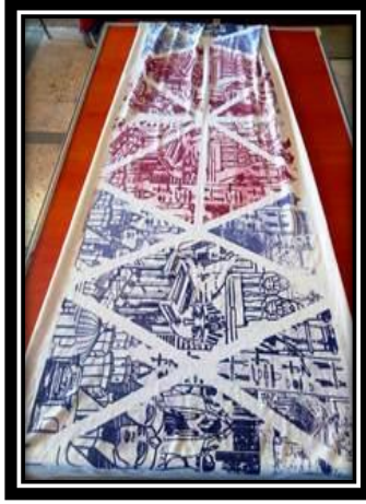
(٥ - ج) عمل طلابي (حجاب), طباعة شاشة حريرة.