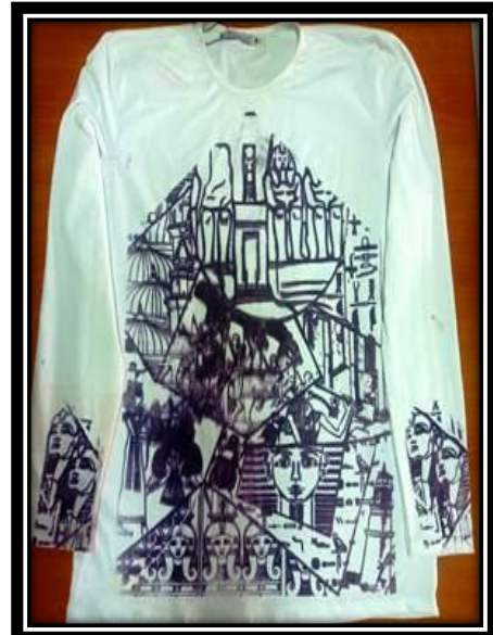
(٤- ب ) عمل طلابي (تيشرت),طباعة شاشة حريرية.