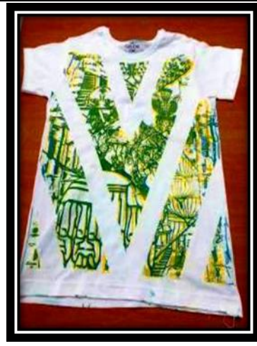
(٢ - ب) عمل طلابي (تيشرت)، طباعة شاشة حريرية.