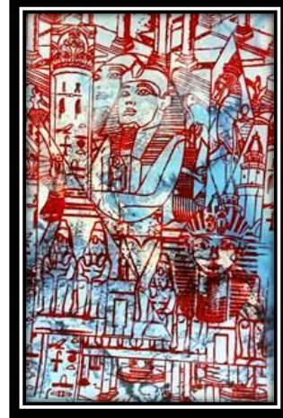
(٥ - ب) عمل طلابي (حجاب), طباعة شاشة حريرة.