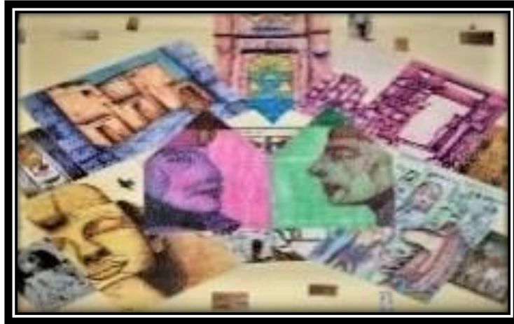
(٥ - أ) عمل فني طلابي بمجال الرسم والتصوير, ١٠٠سم*١٥٠سم, ألوان مائية وأقلام حبر.

قراءة العمل الطباعي وتحليله : اختلاف الكتل وتعمق المساحات والانسجام اللوني والتنوع في الخطوط وإحساس الظل والنور , وترجمة هذا بالتقنيات اليدوية الطباعية, ساعدت عين المشاهد على التحرك بيسر في جميع أركان العمل ؛ مما قدم صياغة تشكيلية طباعية تمتع عين المشاهد .