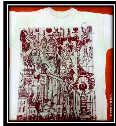
(٣- ب) عمل طلابي (تيشرت), طباعة شاشة حريرية.