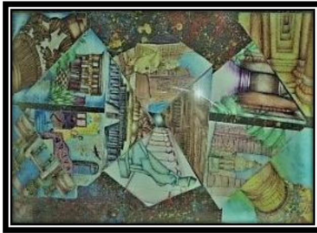
(٤ - أ) عمل فني طلابي بمجال الرسم والتصوير, ١٠٠سم*١٥٠سم,ألوان مائية وأقلام حبر.

التقنية المستخدمة في الأعمال المطبوعة وهي الشكل (٤-ب) - (٤-ج): هو ترجمة تشكيلية طباعية مستوحاة من المعالم الأثرية للقدماء المصريين لمدينة الأقصر برؤية معاصرة غنية بالملامس والبصمات الطباعية توضح مدى التجسيم والعمق والتجريد مع تعدد الملامس وترجمتها بصورة مباشرة لعين المشاهد. استخدم تقنية الشاشة الحريرية والبصمات مع التأكيد على العديد من الملامس ؛ لتحقيق ثراء طباعي للعمل. القيم التشكيلية للعمل الفني : التنوع والانسجام بين الخطوط والإيقاع بين الملابس والألوان والتكرار المنغم بين المساحات وإحساس الظل والنور, ساعدت العين على المشاهدة بصورة أكثر تعمقاً والتحرك بسهولة في كل أجزاء العمل المطبوع. قراءة العمل الطباعي وتحليله :المعالجة الطباعية وتعدد الملامس والوعى التقنى في الطباعة وبهجة الألوان وتنوع التكرار المنغم ,حقق ثراءً طباعياً وملمسياً للعمل الفني المطبوع ,والتناغم والاختلاف بين المساحات وترجمة هذا بالتقنيات الطباعية , ساعدت على امتاع عين المشاهد ,وتقديم قيم تشكيلية طباعية جديدة ومبتكرة .