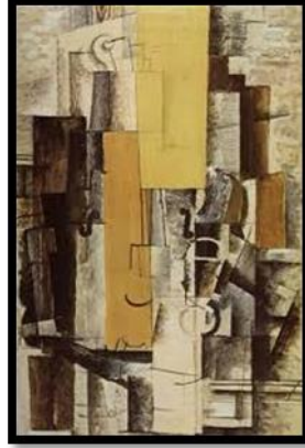
شكل (١) جورج براك، ١٩١٣، الكمان والانبوب، فحم وزيت على قماش، ٦٠*٨١ سم، مجموعة خاصة. ( https://www.georgesbraque.org )