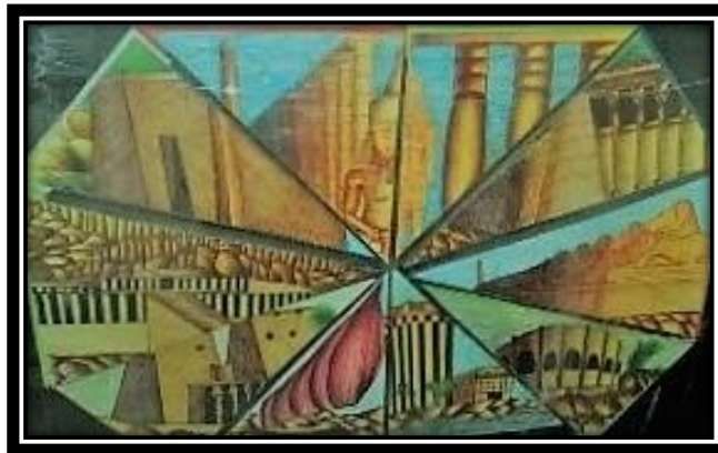
(١-أ) عمل فني طلابي بمجال الرسم والتصوير, ١٠٠سم*١٥٠سم, ألوان مائية وأقلام حبر.

طباعة الملامس والخطوط بتقنية الشاشة الحريرية؛ مما أدى إلى التنوع في حركة العناصر واختلاف أحجامها وكثافتها وانتشارها في اتجاهات مختلفة, في صيغة انتشارية بشكل تكرارى نتج عنها حلول غير منتهية لمفردات تشكيلية, مما ساعد العين على التحرك بيسر في جميع أنحاء العمل المطبوع , كما أدى إلى تقديم صيغ فنية متنوعة بصورة معاصرة.