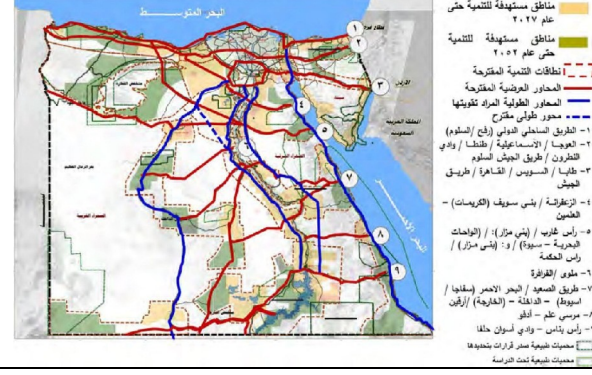
شكل رقم ٥ - يوضح محاور الانتشار الطولية والعرضية المقترح تنميتها - مصر ٢٠٥٢، المصدر: المخطط الاسترااتيجي القومي للتنمية العمرانية - الهيئة العامة للتخطيط العمراني ٢١١٣ - ص٥١٥