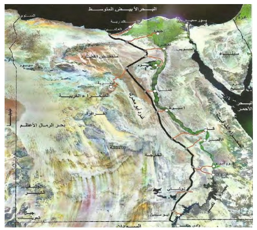
شكل رقم ٦- يوضح مسار ممر التنمية والتعمير

تتمثل الفكرة في اقامة طريق طولي موازيا لوادي النيل يرتبط بة بعدة افرع يسمى ممر التنمية بعدد ٨ حارات كما موضح بالشكل رقم (٦) بجانبة طريق سكة حديد جديد، وخط مياة ينقل المياة من بحيرة ناصر إلى العلمين بهدف توفير مقومات الحياة يتفرع منه طرق كالتالى: محور الاسكندرية، محور طنطا، محور القاهرة، محور الفيوم، محور البحيرة، محور المنيا، محور أسيوط، محور قنا، محور الاقصر، محور كوم امبو اسوان، محور توشكي، محور ابو سمبل.