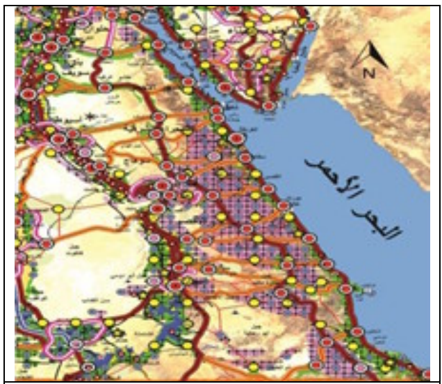
كل رقم ٢ - يوضح المحاور والتجمعات العمرانية المقترحة باقليم البحر الاحمر والصحراء الشرقية، المصدر: عصمت عاشور – الخريطة القومية المقترحة للتنمية المستدامة لجمهورية مصرالعربية لسنة ٢٠٥٨م.

* إقليم البحر الاحمر والصحراء الشرقية (محور جذب سكانى):ويضم محاور الصحراء الشرقية بطول البحر الأحمر من جنوب السويس، رأس غارب، الغردقة، رأس بناس، حلايب وشلاتين وسفاجا ومحور المثلث الذهبى قنا – سفاجا – القصير (محور تنموى اقتصادى مستدام) عدد السكان المقترح للاقليم عام ٢٠٥٨م حوالى ٢٩٥, مليون نسمة كما موضح بالشكل رقم(٢) إقليم البحر الأحمر والصحراء الشرقية والمحاور المقترحة عليه، بالاضافة إلى التجمعات العمرانية باحجامها المختلفة.