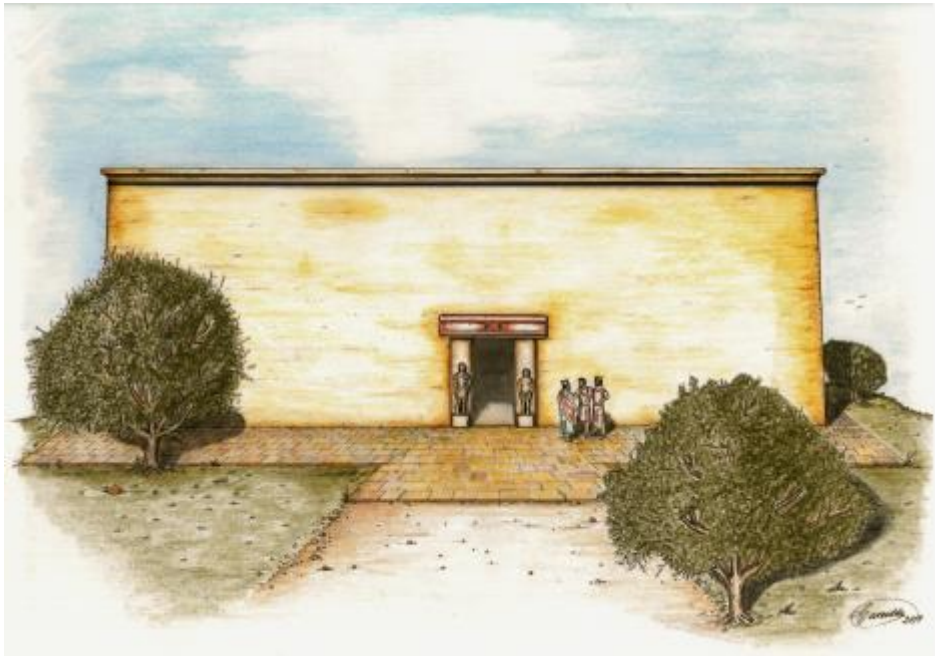
(شكل ٢) إعادة تكوين فنية لشكل المعبد في الحقبة الهلنستية ©رسم ج. كارزيدا.