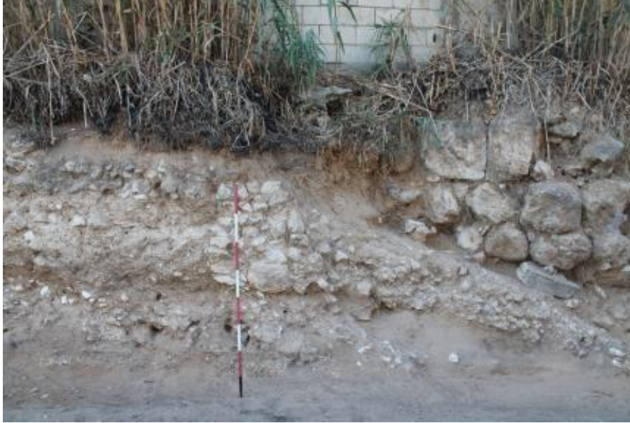
(صورة ٢) الخراب، مقطع من الموقع الأثري المسمى تل القاسمية ©تصوير إ. أوجيانو.

كان مشهد المنطقة الساحلية بين صور وصيدا مختلفا تماما عن المشهد الطبيعي الحالي، إذ كان الساحل يشتمل على مستنقعات ربما كانت توفر مأوى جيدا للقوارب، ويعتقد من خلال الدراسات الجيولوجية والأركيولوجية التي قامت بها البعثة الأثرية حديثاً أن أحدها بُني بالقرب من مصب نهر الليطاني، حيث كان يوجد تل محاط كلياً أو جزئياً بالمستنقعات. هذا الموقع المكتشف حديثاً يعود تاريخه إلى الحقتين الفارسية والهلمستية، وقد سُمي بتل القاسمية (صورة ٢).