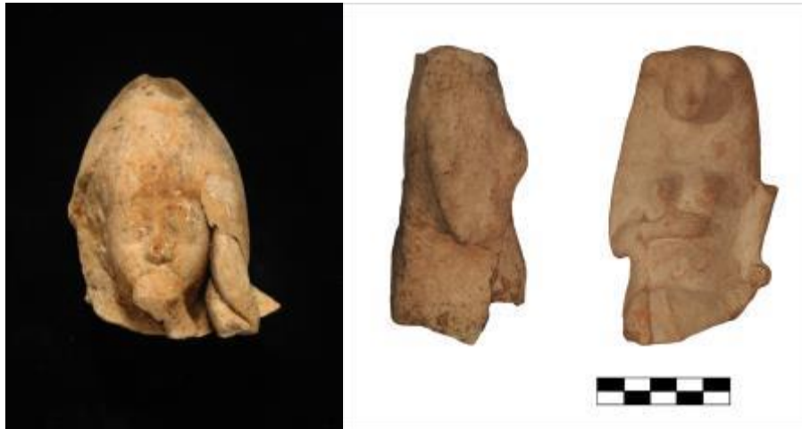
(صورة ٧) الخرايب، نماذج من دمي طينية من الحقبة الفارسية الإخمينية ©تصوير إ. أوجيانو.

ما هي الطقوس الدينية التي كانت تمارس ضمن المرحلة الأولى في مكان العبادة هذا؟ يمكننا الآن القول: إنّ الطقوس كانت عبارة عن تقديم نذور ومنها الدمى الطينية (صورة ٧). وكانت تُستخدم ضمن الطّقس عينه المزهريات والأطباق والأوعية الصغيرة كحاويات لكميات صغيرة جدًا من الحبوب أو غيرها من الأطعمة أو الصّوف أو لخصلة من شعر المتعبد، أو في بعض الحالات لتقديم سائل مثل النّبذ أو الرّيت أو الماء.