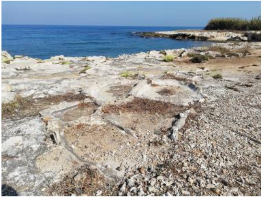
(صورة ٤) عدلون، مآحات حديثة العهد ©تصوير إ. أوجيانو.