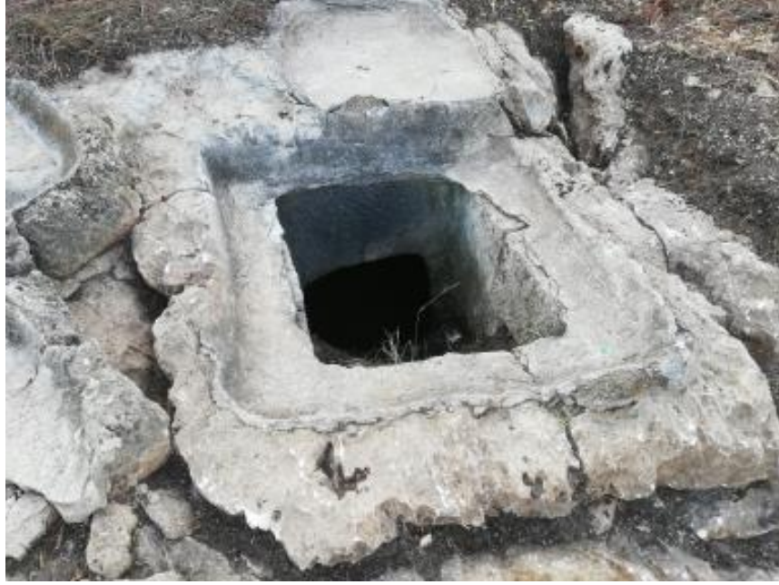
(صورة ٣) عدلون، فوهة غرفة جنازية محفورة في الصخر ©تصوير ل. تيراباسي.