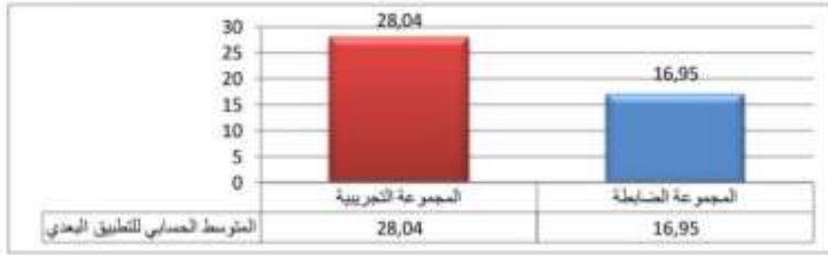
شكل (1) يوضح الفرق بين متوسطي درجات طلاب المجموعة التجريبية وطلاب المجموعة الضابطة في اختبار مهارات الفهم القرائي

وتعزو الباحثة هذه النتيجة إلى فاعلية استعمال تطبيقات جوجل لتعليمية التي تتيح للطلاب قراءة الدروس وامكانية اعادة قراءة المادة التعليمية كونها موجودة في ملفات Google التعليمية وان الطالب يستطيع ان يعيد قرائتها وسماع النصوص من خلال التسجيل الصوتي الذي تركها المدرس في موقع Google Classroom و Google Drive والبريد الالكتروني في ال Gmail، الموجود في حساب الطالب.