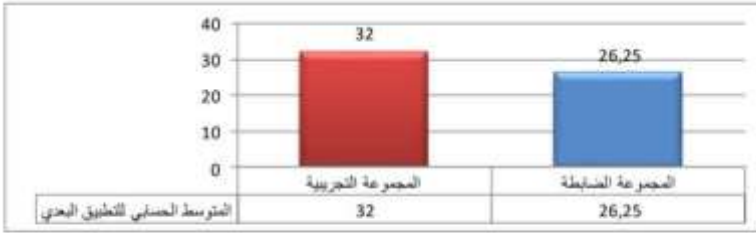
شكل (2) يوضح الفرق بين متوسطي درجات طلاب المجموعة التجريبية وطلاب المجموعة الضابطة في اختبار المفاهيم النحوية

الطلبة وامكانية القراءة المشتركة والسماع و تطور النقاش من موضوع الدرس إلى موضوعات أوسع متعلقة بموضوع الدرس ؛ انه ساعد الطلبة على تكوين تصور مقبول عن المفهوم النحوي فضلا عن توجيههم إلى تقديم التفسير والتوضيح لإجاباتهم من خلال القراءة والاجابة عن الاسئلة.