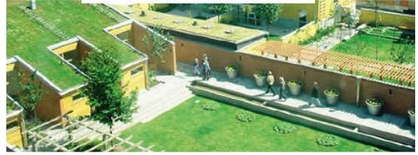
图 6 植被屋顶对水的调节作用 保温隔热作用

بعيدا عن أوروبا تجري تجربة المدينة الخضراء بالقرب من مدينة دونغنانغ في الصين، وهي اول مدينة يتم التخطيط لها على اساس بيئة نظيفة تماما ويمكن ان تكون مثالا لمدينة الصين الاخرى في المستقبل، خصوصا وانها مقبلة على مرحلة نمو متسارع تستهلك معها قدرا كبيرا من الطاقة وتفرز ايضا كما كبيرا من العوادم والنفايات.