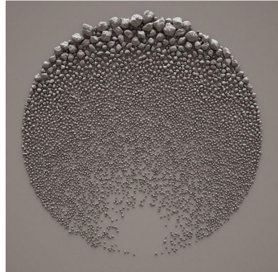
(شكل 6) ريتشارد لونج، الحقل الحجري - 1994م

https://www.artranked.com/topic/Richard+Long#&gid=1&pid=10