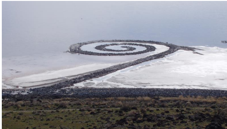
(شكل 5) روبرت سميثون، حاجز الماء الحلزوني - 1970م

"تم نقل ذلك في عام 1979 في فيلم (الحاجز المائي الحلزوني)، عملياً لا أحد رأى العمل أبداً في الحقيقة، لكن تم مشاهدته على نحو واسع في صحافة الفن وفي الفيلم السينمائي المميتون، الذي استعمل الاحتمالات والوقت بشكل ذكي لوضع "رصيف الميناء الحلزوني" في سياق أفكاره الأساسية." (Finchberg, 2000)