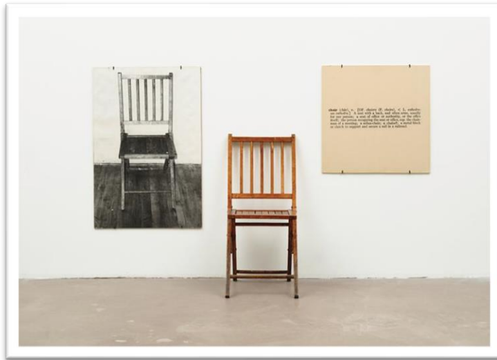
(شكل 2) جوزيف كوسوث، كرسي وثلاث كراسي، كرسي خشبي وصورة فوتوغرافية وبيان مطبوع-1965م - متحف الفن الحديث - نيويورك.

هكذا يصبح ما قدمه كوسوث Kosuth من عنوان (واحد وثلاثة كراسي) ما هو إلا لتركيز الانتباه عند المشاهد بمختلف المناهج في تمثيل الشيء، بعيدًا عن التعبير الذاتي للفنان نفسه، بشكل فعال داخل عمليات لغوية مرتبطة بالصورة الحقيقية والنص المقروء.