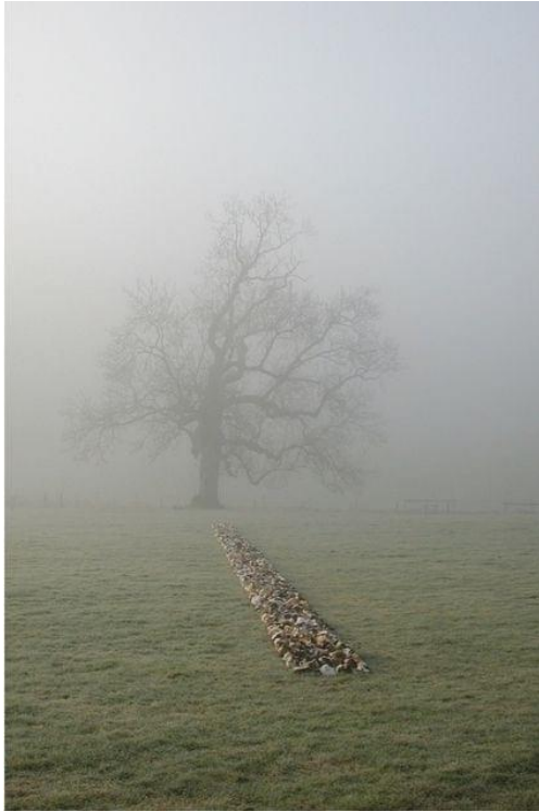
(شكل 7) ريتشارد لونج، من الممكن صنع خط عن طريق المشي،

ففي (شكل 6) نلاحظ اختياره مجموعة من الأحجار - كأحد أشكال التعبير عنده في موقع معين، وبعد ذلك يقوم بتغيير بسيط في المنظر الطبيعي الذي غالبا ما يكون بعيداً ومنعزلاً، ثم بعد ذلك يتم تعديل وجوده بتصميم أشكال منتظمة داخل قاعات العرض، ويرتبط ذلك العمل بجذور عميقة لفن المينيمال والفن المفاهيمي في كثير من الجوانب، إلا أنه يرتبط بشكل فعال بما يقدمه لون بنفسه نحو الطبيعة وإضفاء روح رومانسية على إنتاجه. كما في عمله المسمى (من الممكن صنع خط عن طريق المشي). (هاشمي، 2019) ويعتبر (شكل 7) أول عمل نحتي تم تنفيذه عن طريق السير عبر الحقل، وقد حدد الفنان خط السير على أساس أنه خط مستقيم مائل عبر المنطقة بأكملها، والخبرة الجمالية الوحيدة التي حصل عليها المشاهدون من هذا العمل هي خريطة تصور المشهد الطبيعي الذي مشي خلاله.