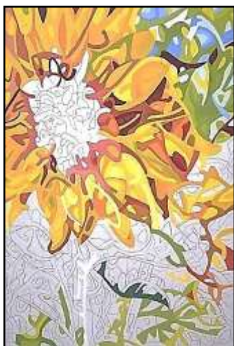
٣- مراحل التنفيذ باللون