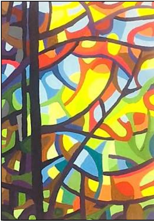
(١٤) اسم الطالب : أسماء حمدي علم الدين