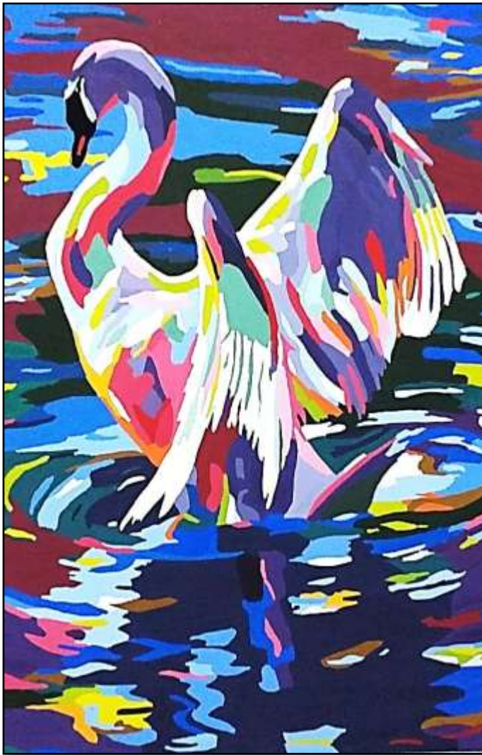
٤- اللوحة الزخرفية الاولى

اسم الطالبة : شيماء فرج خليفه المقاس : ٣٠×٢٠ سم الخامة : ورق كانسون، وألوان (بوستر)