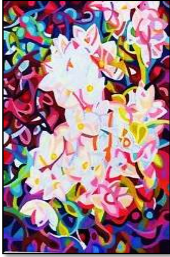
٣- مراحل التنفيذ باللون