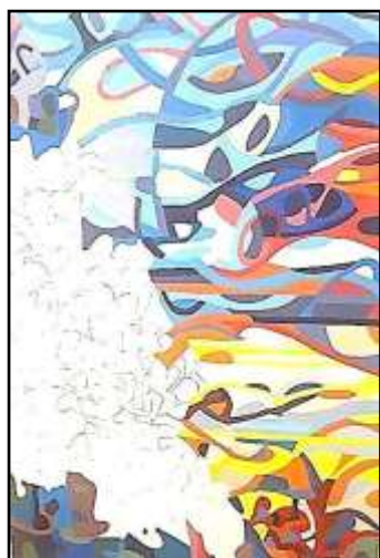
٣- مراحل التنفيذ باللون