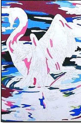
٣- مراحل التنفيذ باللون