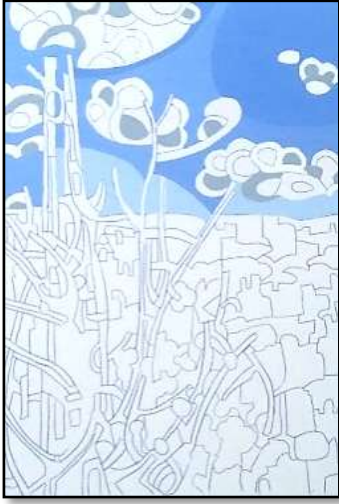
٣- مراحل التنفيذ باللون