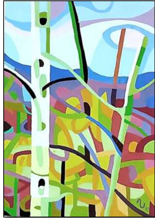
(١١) اسم الطالبة : فاطمه فتوح سنوسي