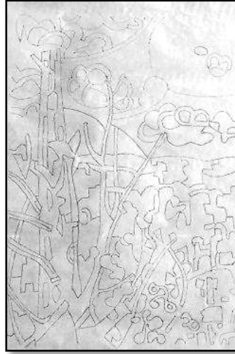
٢- التنفيذ على الكالك