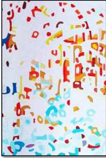
٣- مراحل التنفيذ باللون