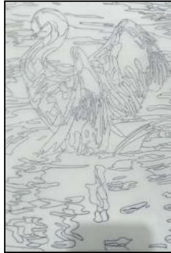
٢- التنفيذ على الكالك