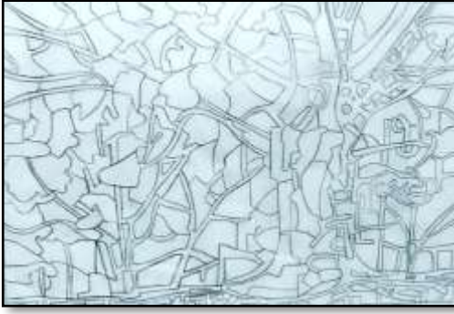
٢- مراحل التنفيذ باللون