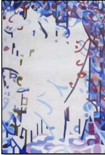
٣- مراحل التنفيذ باللون