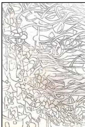
٢- التنفيذ على الكالك