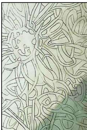
٢- التنفيذ على الكالك