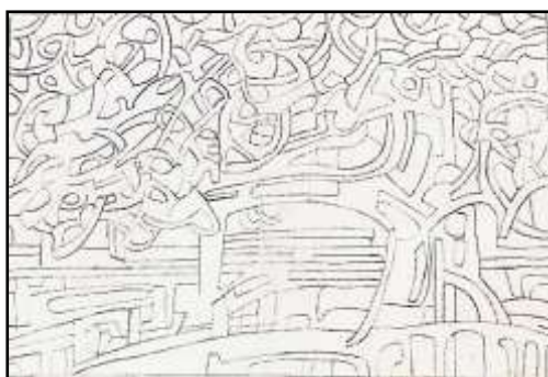
٢- مراحل التنفيذ باللون