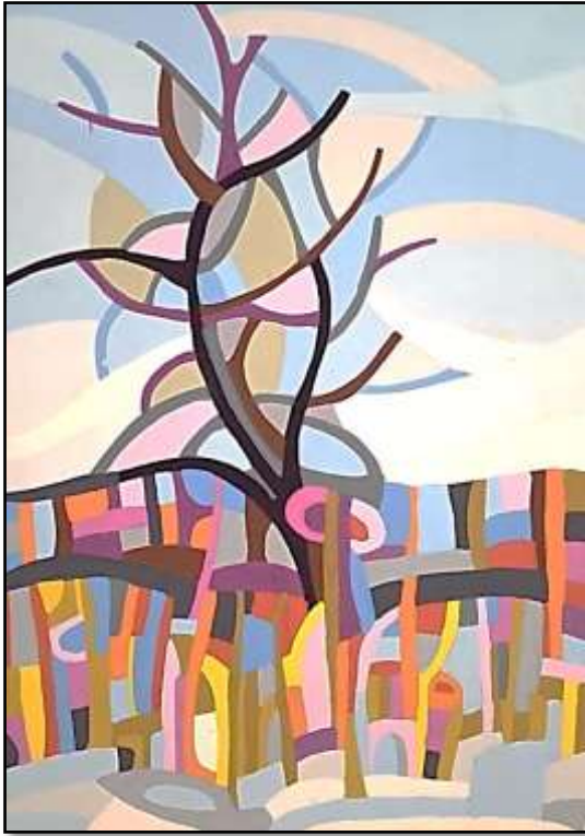
(١٦) اسم الطالبة : نورا فوزى خليل