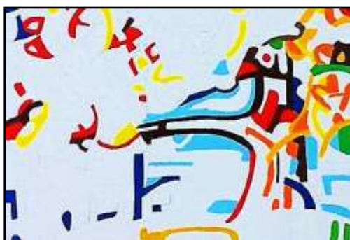
٣- مراحل التنفيذ باللون