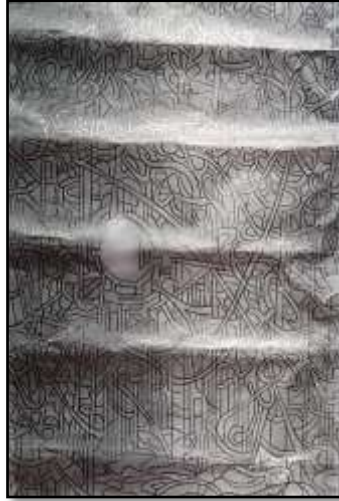
٢- التنفيذ على الكالك