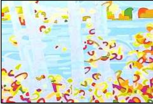
٣- مراحل التنفيذ