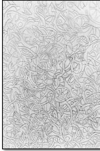
٢- التنفيذ على الكالك