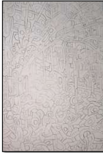
٢- التنفيذ على الكالك