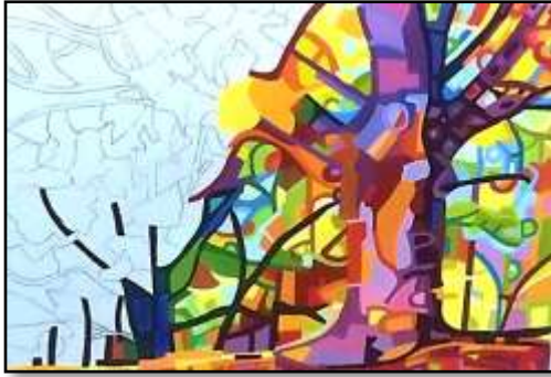
٣- مراحل التنفيذ