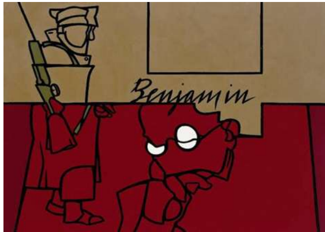
شكل (١) فاليريو أدامي (Valerio Adami) م ١٩٣٥

ويعد فاليريو أدامي (Valerio Adami) من أهم المصممين اللذين اثروا في منهج التفكيكية حيث لاقى أعمال أدمي إهتماما نقديا لدي الفلاسفة التفكيكيين فرسوماته وتصميماته الفنية تنافس التكعيبية (Cubism)، وتتميز بأستخدام أسلوب التقطيع والتجزئة، حيث يتم تمثيل الشكل على هيئة أجزاء مختلفة بجانب بعضها بحيث ترجع عن طريق التشكيل الي أصلها الحقيقي وفي كتاب (الحقيقة في التصوير Truth In Painting) تناول دريدا أعمال فاليريو وبحث في أسلوب إنشاء التقارب بين السياسة والفن والفلسفة والفن والأصل والتقليد والامضاء والاسم الحقيقي فكانت كلماته "في الصفة، لعمل أدامي وذلك بأستخدام معرضا تصميمات الفنان أدامي Valerio Adami كذريعة لمناقشة وظيفة الحرف والاسم الملائم في الرسم، مع الإشارة الي السرد، الاستنساخ الفني، الأيديولوجية، الصوت والسياسة. فكانت كلماته كرد فعل لمنهج أدمي منذ ١٩٧٠م بمعالجة القضايا السياسية في فنه، وأدرج الموضوعات السابق ذكرها كما بالشكل (١)" (٣)