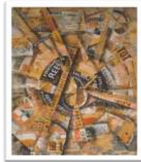
شكل (٧) كارلو كارا ، ملصق يوضح توظيف الشرائط الكتابية من خلال أحجام واتجاهات متنوعه

٢- المدرسة المستقبلية Futurism (١٩٠٩ - ١٩٢٩) : ومن رواد المدرسة المستقبلية الشاعر "فليبو توماسو مارينيتي" Filippo Tommaso Marinetti (١٨٧٦ - ١٩٤٤) ومعه الفنانين "جياكومو باللا" Giacomo Balla (١٨٨٧ - ١٩٥٨) ، "إمبرتو بوتشيوني" Umberto Boccioni (١٨٨١ - ١٩١٦) ، "كارلو كارا" Carlo Carrà (١٨٨١) ، وكان إتحاهم الفكرى الذى دعمهم فى امكانية إظهار الأشكال على حقيقتها المتحركة فى الفضاء الذى يحتويها ، وحاز ملصق " مارينيتي " إعجاب ثلاثة من الفنانين الشباب فى إيطاليا هم (بياتريس بوتشيوني) و (كارلو كارا) و (لويجي روسولو) ، الذين أرادوا أن يجعلوا أفكار مارينيتي تمتد إلى الفنون البصرية ، فالتقى هؤلاء الثلاثة وآخرون معهم بالكاتب مارينيتي وأصدروا إعلان المستقبلين التشكيليين ، الذى اتسم بالعنف والمبالغة اللغوية ، وفى ملصقاتهم تبرا هؤلاء من الماضى والتقاليد الفنية ، وأرادوا أن تتصف الأعمال الفنية بالأصالة المستقبلية والتحدى والعنف والجنون ، واحتقروا النقد والنقاد ، وأعلنوا ثورتهم على الذوق والانسجام الفنى ورفضهم لموضوعات الفن السابقة (١) .