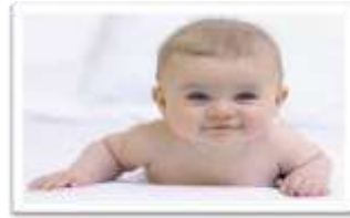
شكل الطفل الصغير