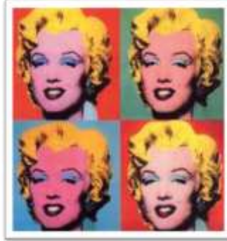
شكل (٩) اندي وار هول صورة مزدوجة لمارلين مونرو ، طباعة بالشاشة الحريرية

إلى إضافة ضربات الفرشاة الجريئة ، وتقنيات الطباعة المختلفة مزاجية بطرق الإصاق والكولاج ، لقد أعتقد انه " كلما استخدم الفنان الأشياء و العناصر في عمله من العالم الواقعي ، يصبح أكثر واقعية.