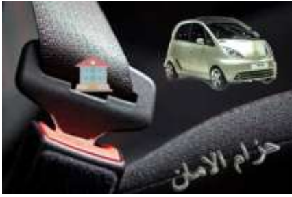
تصميم ملصق إعلان حزام الامان

فكرة الملصق: إعلان إستخدام حزام الأمان أثناء ركوب السيارة الدلالة البصرية: صورة للسيارة وهي تسير على الطريق بهيئة حزام الأمان أسود اللون الدلالة الرمزية: شكل المنزل في منتصف الحزام باللون الأحمر المضيء للتذكير دائماً بلحظة الوصول بأمان إلى العائلة وربط الحزام يؤدي لذلك