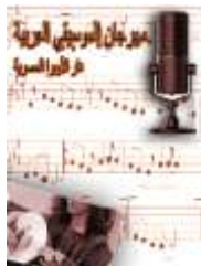
تصميم ملصق إعلان مهرجان القاهرة للموسيقى العربية

الدلالة اللغوية : كتابة مهرجان القاهرة للموسيقى العربية فى الصدارة ، و يليه المكان بدار الأوبرا المصرية .