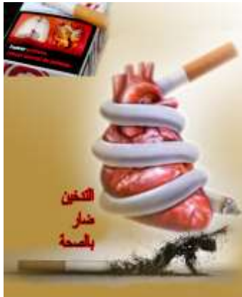
تصميم ملصق إعلان للتدخين

الدلالة الرمزية: السجارة رمز الإنسان المدخن في لحظة إطفاء السجارة رمز الإمتناع عن التدخين والذي يسبب الموت الذي يرمز إليه شكل القلب الملفوف عليه السجارة وكأن المدخن يموت نفسه