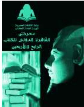
ملصق إعلان معرض القاهرة الدولي للكتاب

فكرة الملصق: الإعلان عن معرض القاهرة الدولي للكتاب الدلالة البصرية: صورة لوجه تمثال رمسيس في إضاءة ليلية ، وأشكال عديدة للكتب الدلالة الرمزية: تمثال رمسيس الثاني رمز لمصر الحضارة والإضاءة على وجهه رمز التنوير ، وشكل الكتب رمز للمعرض والتجمع الثقافي للكتاب