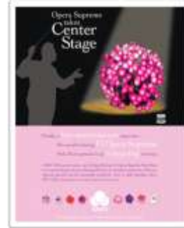
شكل (٤) ملصق ثقافي يوضح اعلان حفل موسيقي ، عن http://www.fullsteam.com