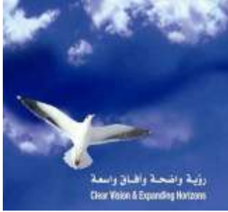
شكل (٢) ملصق يوضح تعميم الدلالة . عن

وخطوط وألوان . ونحن نعيش الآن في عصر إنتشرت فيه لغة العلامات والإشارات وأصبحت هذه اللغة عالمية يفهمها الجميع على مختلف جنسياتهم ولغاتهم المكتوبة والمنطوقة (١) .