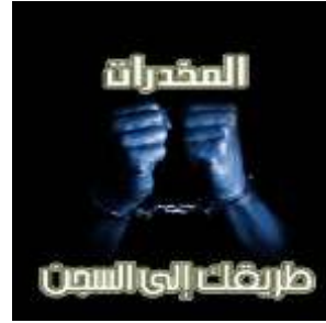
شكل (١) ملصق يوضح تخصيص الدلالة . عن