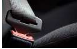
شكل حزام الأمان