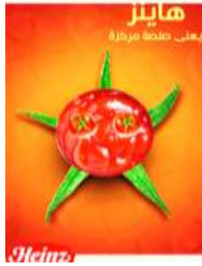
تصميم ملصق إعلان صلصة للطماطم