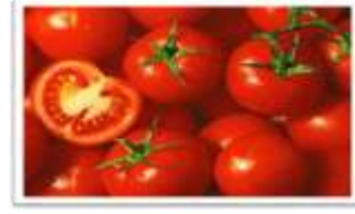
الشكل الطبيعي للطماطم