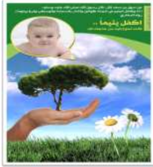
تصميم ملصق إعلان كفالة اليتيم

الدلالة اللغوية : كتابه عنوان الإعلان ، ووصف الإعلان عن طريق الهدف وهو كفالة اليتيم وعمل الخير والحث عليه .