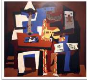
شكل (٦) بابلو بيكاسو ثلاثة موسيقيين (1921)

الآخر ، فى تدليل قوى على طلاقته الإبداعية ، وأصبحت تلك الملصقات أحد تلك الوسائط التعبيرية التى صممها لمعارضة المتنوعه ، وترويج أنشطة المناطق السياحية فى فرنسا وأسبانيا ، والاعلان عن الموضوعات المحببة الى قلبه وخاصة مصارعة الثيران.