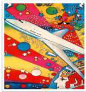
شكل (٥) ملصق سياحي ، " بيتر ماكس " Peter Max عن Lars Mueller:1999 :p3