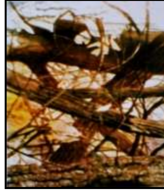
شكل (١) عمل محمد عمرو ٢٠٠٠