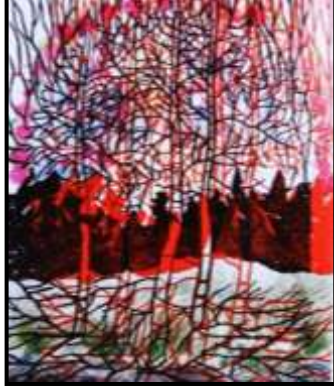
شكل (٢) عمل أماني حسن ٢٠١١