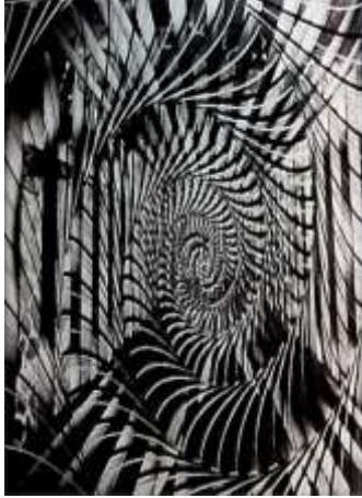
شكل (٤) عائشة عواد ٢٠٠٣