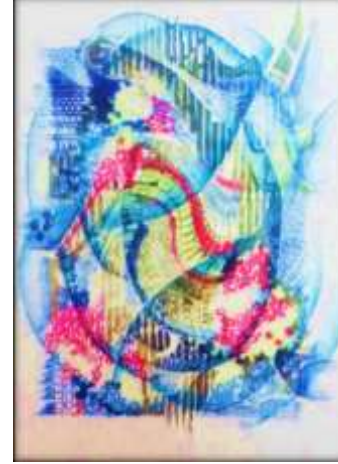
شكل (٣) عمل هبة مازن ٢٠١١