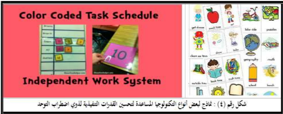
شكل رقم (٤) : نماذج لبعض أنواع التكنولوجيا المساعدة لتحسين القدرات التنفيذية لذوي اضطراب التوحد

المرئية ما هي إلا عبارة عن تمثيل مرئي لما سيحدث وما سيؤديه الفرد ذي اضطراب التوحد على مدار اليوم من أنشطة ومهام، فهي مفيدة للغاية في تعليم المصابين باضطراب التوحد كيفية إتباع التعليمات وكيفية تعلم المهارات الجديدة. أما الوسائل متوسطة التقنية المفيدة مع ذوي اضطراب التوحد لتحسين الوظائف التنفيذية لديهم فتتمثل في : الساعات المزودة بأجهزة إنذار، وأجهزة ضبط الوقت المرئية، وسماعات حظر الصوت، والآلات الحاسبة، وكذلك الكتب الصوتية والتسجيلات، فمن المهم للغاية هنا أن نؤكد على أن الأفراد ذوي اضطراب التوحد بصريون جداً، وبذلك قد تكون مقاطع الفيديو على سبيل المثال بديلاً جيداً عن الكتب الملونة أو الخطابات المنطوقة. لذلك نستطيع القول أن هناك العديد من أدوات التكنولوجيا المساعدة وفي مقدمتها التطبيقات الذكية مفيدة للغاية في تعليم الأفراد ذوي اضطراب التوحد مهارات التفكير والكتابة والتواصل، انظر الشكل رقم (٤) كما يلي: