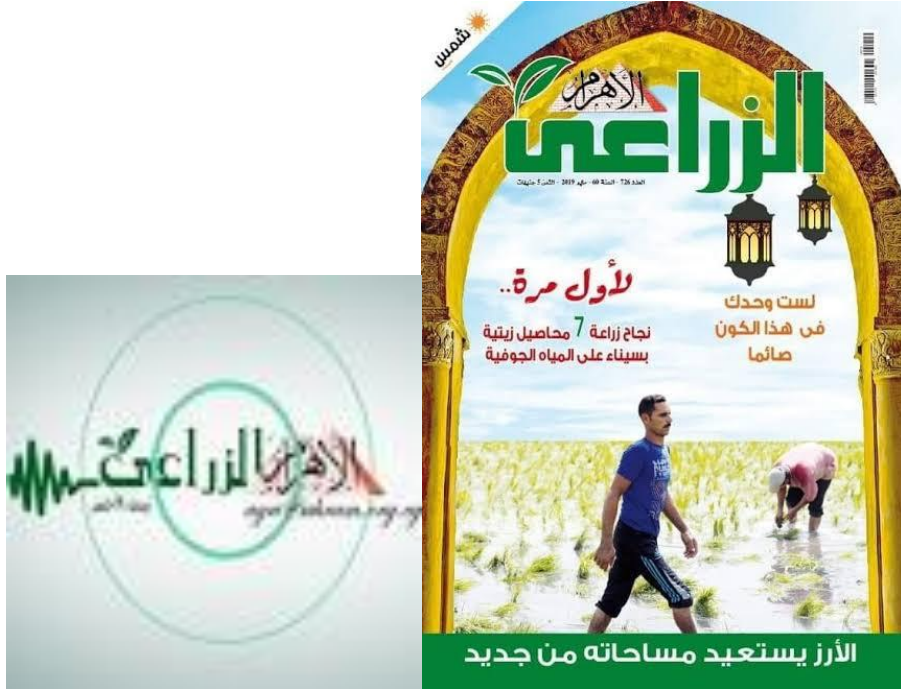
(شكل ٤) مجلة "الأهرام الزراعي" عدد مايو ٢٠١٩ ورمز قناتها الإلكترونية

مجلة "الأهرام الزراعي" هي الاسم الجديد الذي أطلق في منتصف أكتوبر ٢٠١٤ على "المجلة الزراعية" التي صدر العدد الأول منها في نوفمبر عام ١٩٥٨ من مؤسسة دار التعاون للطباعة والنشر، وهي تصدر منتصف كل شهر لتلبية احتياجات العاملين بقطاع الزراعة من معلومات وأبحاث وتجارب جديدة، إضافة إلى إلقاء الضوء على التحديات التي تواجه القطاع، وكل ما يتعلق به في قطاعات الثروة الحيوانية، والداجنة، والأسماك، والتصنيع الزراعي، والميكنة الزراعية (أسامة، ٢٠١٤). ويصحب المجلة موقع الكتروني ينقل الخبر ثنائية بثائية (شكل ٤).