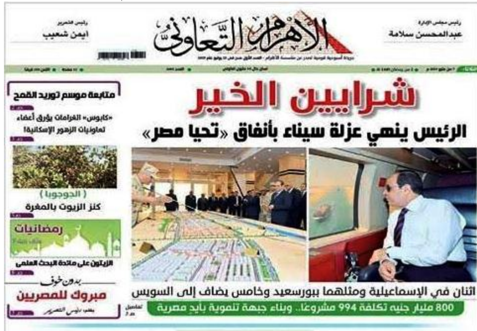
(شكل ٧) الصفحة الأولى لجريدة الأهرام التعاوني الأسبوعية ٤ مايو ٢٠١٩

وترتب على هذا الوضع استمرار الإصدار الورقي لجريدة "الأهرام التعاوني" أسبوعياً (شكل ٧) مع الإشارة إلى بعض موادها الصحفية على بوابة صحيفة الأهرام.