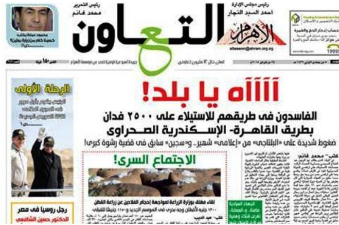
شكل (٣) جريدة التعاون في ٢٠١٢

ثانياً: مجالات وقضايا التنمية الريفية في مصر ومدى اهتمام الإعلام بها