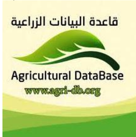
(شكل ٩) واجهة موقع قاعدة البيانات الزراعية

وبدأ رسم الهيكل العام للموقع من تصميم وبرمجة وإدخال بيانات وغيرها. وتم تدشين الموقع فعلياً على شبكة الإنترنت في سبتمبر ٢٠١٣ (شكل ٩). ومنذ هذا التاريخ وحتى ٢٠١٥ كان تسويق قاعدة البيانات يتم بشكل محدود من خلال العلاقات الشخصية، ثم تطور الترويج لقاعدة البيانات الزراعية بشكل قوي من خلال المعارض والندوات الزراعية المتخصصة وكذلك قنوات التواصل الاجتماعي على شبكة الإنترنت حتى وصلت الزيارات لقاعدة البيانات الزراعية أكثر من ٥٥ ألف زيارة شهرياً في ٢٠١٩ من أكثر من ١٠ دول عربية مع الترويج لها في ٢٥ معرض زراعي بمصر وسلطنة عمان والأردن ودبي وتركيا وكينيا. ويعمل الموقع تحت رعاية كل من وزارتي الزراعة واستصلاح الأراضي، والاتصالات وتكنولوجيا المعلومات، ووكالة المعونة الأمريكية USAI، وعدد من الشركات الزراعية الكبرى المحلية والعالمية.