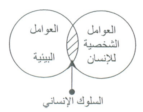
شكل رقم ٢- العلاقة بين العوامل الشخصية للإنسان والعوامل البينية (www.caoa.gov.eg/NR/rdlonlyres- (1)]