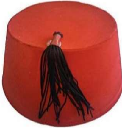
صوره (١١) توضح شكل الطربوش ( https://simple.wikipedia.com )

الطربوش نمساوي الأصل وقد جاءوا به الأتراك إلى بلادنا ، لفظ أصله "سربوش" إى غطاء الرأس بالفارسيه ثم عرب إلى " شربوش " وفيما بعد إلى "طربوش" وهو من اللون الأحمر الفاقع أو الداكن وذو شكل إسطوانى مبطن بالقش وذو شرابه من الخيوط الحريرية السوداء