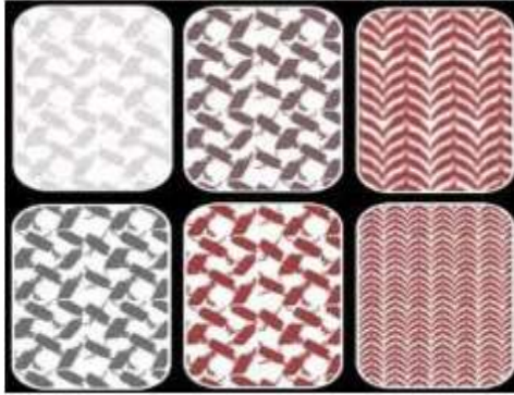
صورة (٥) توضح شكل التصميم للشماع والوانه

تحافظ دول الخليج العربي على إرتداء أغطية الرأس بصورة عامه والشماع أو الغتره الذي جاء إرتدائه بعد إعتبار إعتبار العمامه هو غطاء مصنوع من القماش الناعم والخفيف وتزين أرضيته بأشكال هندسيه باللون الأحمر والأسود .