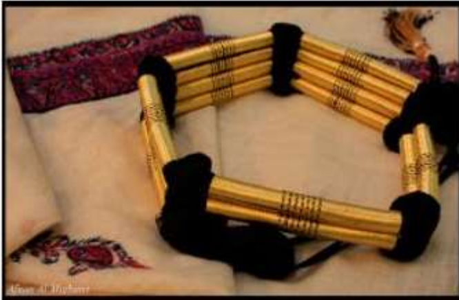
صوره (١٣) توضح شكل العقال الأسود ( http://www.alriyadh.com .)

ويسمى العقال في العراق باللهجه العراقيه "العكال" ويختلف نوع العقال الذي يلبس في المنطقه العربيه والشماليه من العراق عن العقال الذي يلبس في الفرات الأوسط والجنوب وهذا الإختلاف يعود إلى نوع البيئه والطقس الجوى لهذه المنطقه . ( https://www.ahlaldeth.com .)