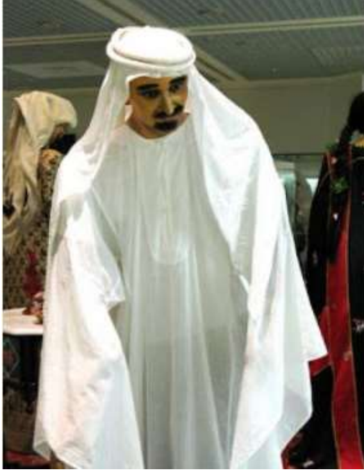
صوره (١٤) توضح شكل للعقال

وهى خشبه بطول ١٥٠سم بمسندين لصنع البطانه ولف وجه العقال .