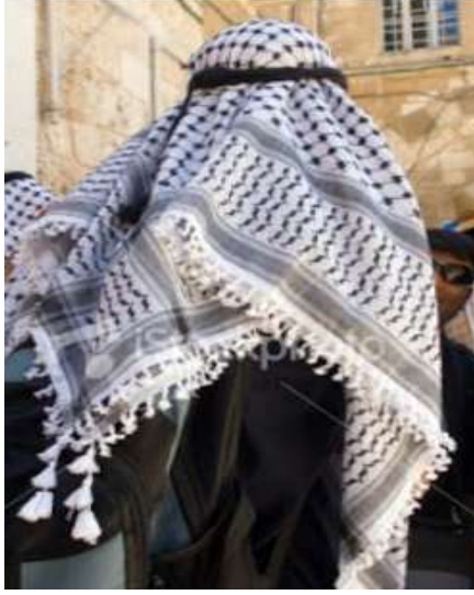
صوره (٦) توضح شكل الشماغ https://commons.wikimedia.org

والشماغ أو السداره أو الطربوش التركى أو الطربوش المغربى ، فقد شاعت فى مختلف أنحاء العالم الإسلامى العمامة البيضاء لشيوخ الدين ، بينما أخذت العمامة السوداء والخضراء ترمز إلى المنتمى إلى آل البيت مع العلم أن العمامة السوداء شائعة فى مناطق أخرى مثل أفغانستان من دون إدعاء الصلة النبوية .