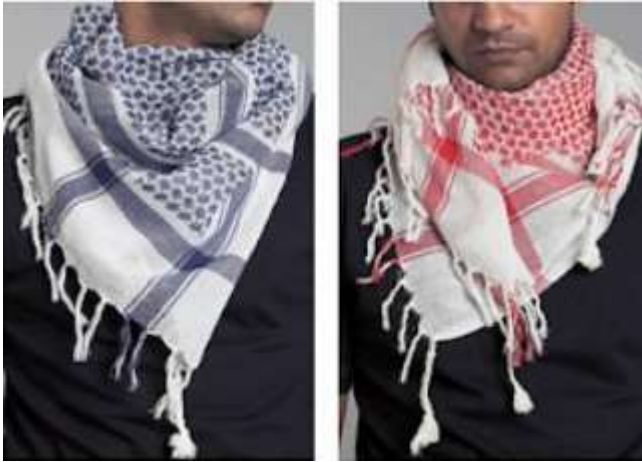
صوره (٧) توضح ألوان الشماغ

والشماغ عادة يتكون من قماش أبيض من القطن الرفيع وعليه نقوش مستطيله أو مربعه الشكل باللون الأحمر وهو المعتاد فى السعوديه ودول الخليج العربى وبادية الأردن والعراق وسوريا ، أما النقشه باللون الأسود فهو الدارج فى فلسطين والعراق .