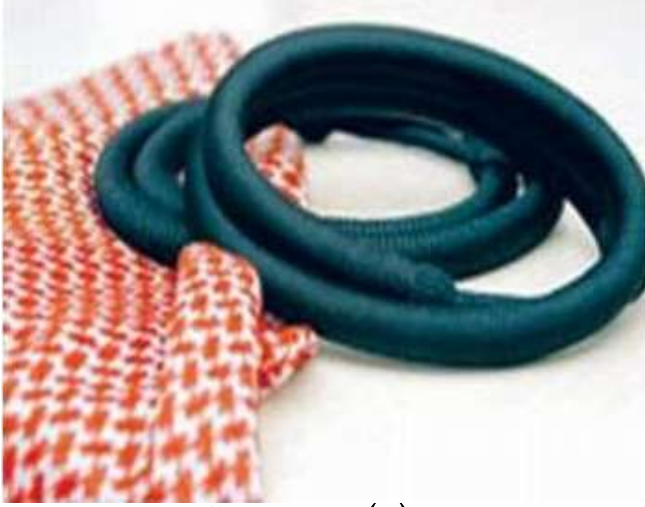
صوره (١٢) توضح شكل العقال

هو الذي يلبس على الرأس أو كما يقال تاج العرب يصنع من خيوط صوفيه ملتويه ويعتبر من مميزات لباس الرجل ، واشتهر بلس هذا العقال كل من دول الخليج وبلاد الشام والعراق وتوارثوه من أجدادهم .