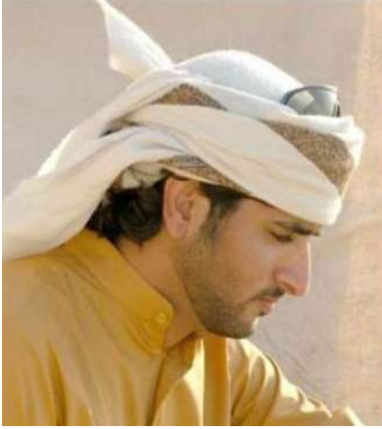
صوره (١٠) توضح شكل الشماع الإماراتي ( https://commons.wikimedia.org )