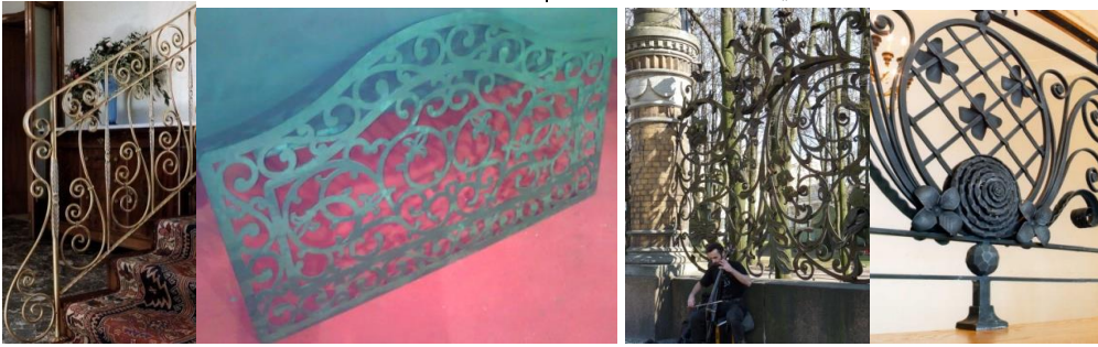
شكل رقم (٢) يوضح وحدات الزخرفة الحزونية وهي ذات تنوع كبير في الشكل والحجم، وذلك وفقاً للكيفية التي يتم استخدامها في تصميم المنتجات

ويجب الإشارة الي أن وحدات الزخرفة الحزونية التي يتم انتاجها بالطرق المعتاده من خلال تشكيل الأعواد الحديدية يدويا على البارد او الساخن، أو ألياً من خلال الماكينات لها جماليات شكلية مختلفه تماماً عن الجماليات التصميميه لوحدها الزخرفه الحزونية التي يتم انتاجها من الألواح المعدنية باستخدام تقنيات القطع بالبلازما او الليزر ففي الأخيره يكون عمق الوحدات الحزونية واحد وهو سمك اللوح الصاج التي تم قطعها منه مما يجعلها في النهايه مسطحة ، كما هو موضح بشكل (٢-ج)، يعكس الوحدات الحزونية التي تم انتاجها من اعواد فيمكن استخدام أعواد ذات ابعاد مختلفه (خاصه في العمق) حسب التصميم المطلوب مما يجعلها اكثر ثراءً وجمالاً وجاذبيه، كما هو موضح بشكل (٢-د)