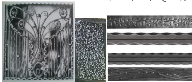
شكل رقم (٣) يوضح ملامس أعواد الحديد المستخدمة في صناعه المنتجات الحديدية

ويجب الإشارة الي ان الأعواد الحديدية التي تُستخدم في عمل المنتجات الحديدية بطبيعتها ذات ملمس شبيه ناعم يمكن اكسابها ملامس اصطناعيه منتظمه (ذلك باستخدام ماكينات لدرلفه الأعواد او الطرق عليها على البارد او الساخن)، كما هو موضح بشكل (٣-أ) أو غير منتظمه (وذلك بالطرق علي الاعواد يدويا على البارد او الساخن أثناء تشكيلها) او باستخدام بعض انواع الطلاء (مثل طلاء سطح المنتجات الحديدية بطلاء الإسكرا ب بواسطة الطلاء الإلكتر وستاتيكي)، كما هو موضح بشكل (٣-ب) وذلك في النهايه يعطيها ثراءً في الشكل وجاذبيه ، ومن الاتجاهات التصميميه التي اهتمت كثيراً بلمس الأعواد الحديدية في المنتجات الحديدية اتجاه الأرت ديكو، كما هو موضح بشكل (٣-ج)