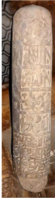
PL (5): Cairo, the the Mosque of Marzuq Al-Ahmadi 1043 AH/ 1633 AD.