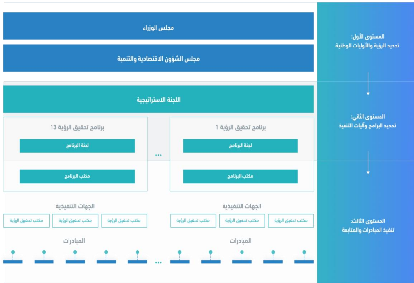
شكل رقم (٢) يوضح نموذج حوكمة "رؤية المملكة العربية السعودية ٢٠٣٠م

إلى آراء الجميع وتشجع الأجهزة الحكومية على تلبية احتياجات كل مواطن، وتعزيز من جودة الخدمات التي تقدمها الوحدة، حيث يطلب من الجميع التفاعل من خلال تحسين الموازنة بين الأولويات الاستراتيجية وتوزيع الميزانية، وتعزيز ضوابط تنفيذها وآليات التدقيق والمحاسبة وتحديد الجهات المسؤولة عن ذلك، وإدارة الموارد البشرية بأسلوب أمثل والاستفادة من أفضل الممارسات المتبعة في تقديم الخدمات المشتركة على مستوى الحكومة، وفيما يخص الإيرادات، رفع كفاءة صندوق الاستثمارات العامة وفعاليتها بما يضمن أن تكون عائداته رافداً جديداً ومستداماً للاقتصاد الوطني، وقد تصدى مجلس الشؤون الاقتصادية والتنمية في المملكة العربية السعودية لقضية الحوكمة، حيث طور المجلس نظام حوكمة متكاملًا لضمان تأسيس العمل ورفع كفاءته وتسهيل تنسيق الجهود بين الجهات ذات العلاقة، بما يمكن المجلس من المتابعة الفاعلة. (رؤية المملكة العربية السعودية ٢٠٣٠م، ص: ٦٠) ويوضح الشكل رقم (٢) نموذج حوكمة "رؤية المملكة العربية السعودية ٢٠٣٠م ضمن مستوياته الثلاث: