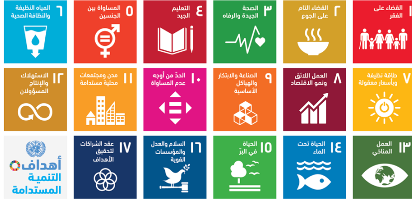
شكل (١): أهداف الأمم المتحدة الإنمائية