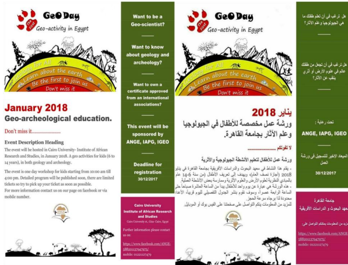
شكل (٤): الإعلان عن ورشتي الجيو_أركيولوجي

كما كان من المقرر عقد ورش عمل أخرى، في مجالات: الخرائط، والبيئة، لكن واجهتها العديد من الصعوبات المالية والإدارية. ويوضح الشكل (٥) نموذج الإعلان المبدئي لورشة الخرائط التي كان من المقرر عقدها.