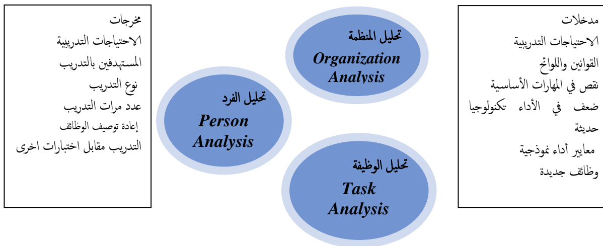
شكل رقم (١) يوضح مواقع تحديد الاحتياجات التدريبية في المنظمات