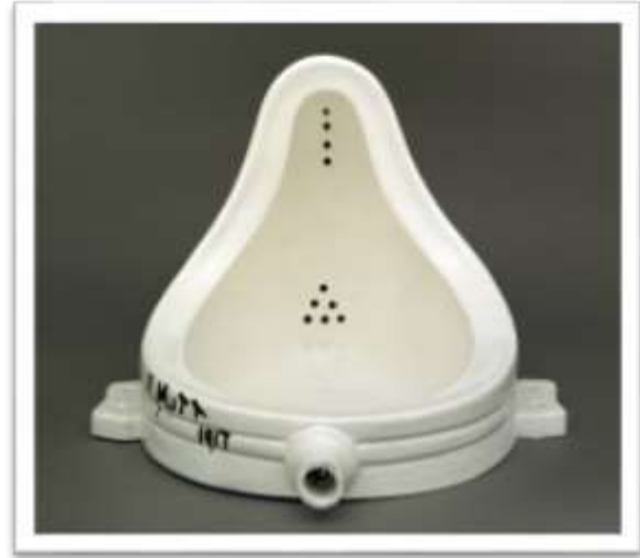
شكل (٣) النافورة

فاذا عدنا بالتاريخ إلى مصر القديمة ونظرنا إلى التراث المصري العظيم نظرة متأمله في أسباب بناء الأهرامات والمعابد والتماثيل سنجد أن الأمر يرتبط ارتباطاً وثيقاً بجوهر الديانة المصرية القديمة، حتى أن