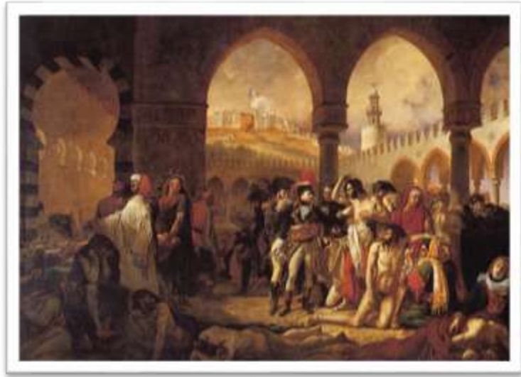
شكل (٤) نابليون يزور ضحايا يافا - أنطوني جرو - زيت علي توال (١٧٧١-١٨٢٥م) المصور الرسمي (١٨٠٤م - ١٨٠٤م)

تصور الامبراطور نابليون في حروبه ورحلاته واحتفالاته، فنجد دائماً الضوء مسلط علي الجانب الخاص بصفات الامبراطور المتميزة وعلي ما قام به من اعمال ومهما بلغت حجم المعلومات التي وصلتنا عن نابليون فهي لا تحاكي الصورة التي وصفها البارون " أنطوني جرو - Antoine-Jean Gros "