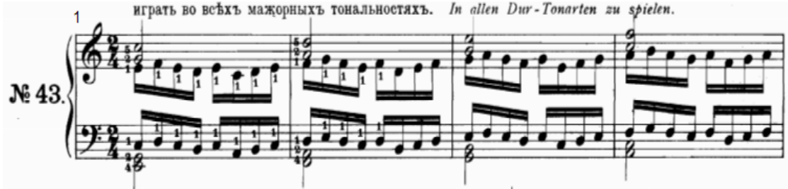
شكل رقم (٢٦)