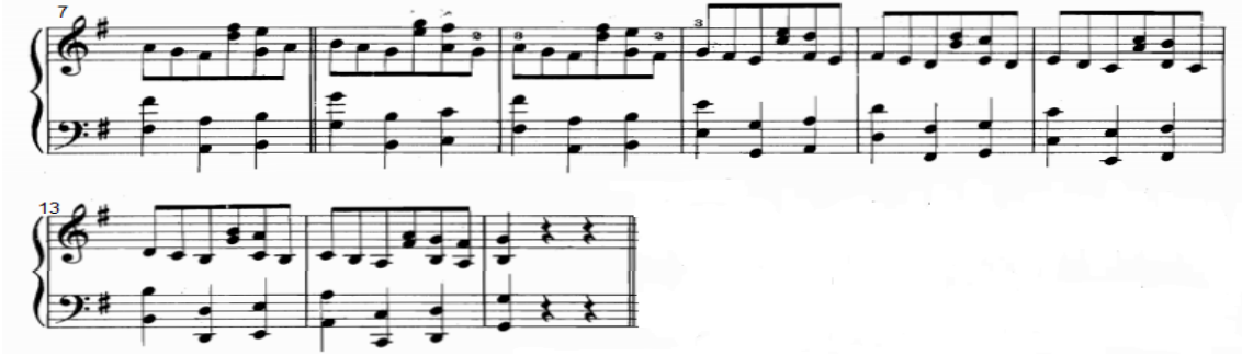
شكل رقم (٢١)

التدريب التكنيكي رقم (١٨) من الناحية النغمية والايقاعية