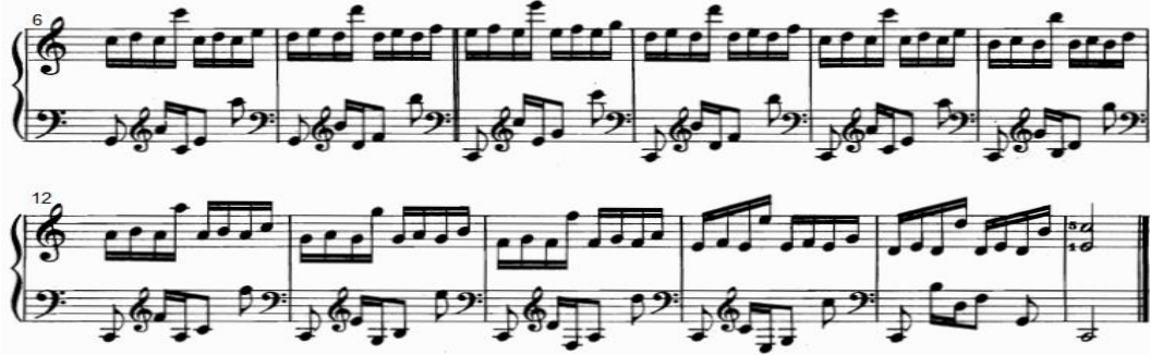
شكل رقم (١٢)

يوضح التدريب رقم (١٢) من الناحية النغمية والإيقاعية