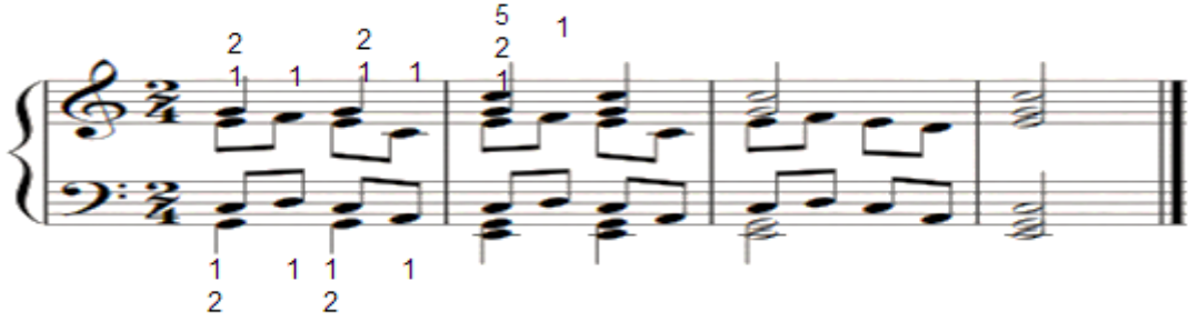
شكل رقم (٢٨)