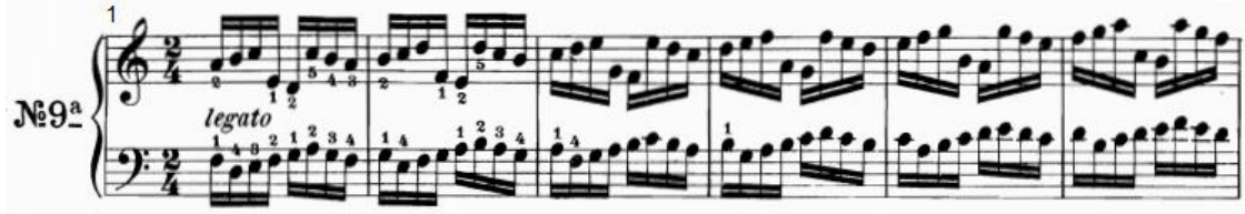
شكل رقم (٧)

عبارة عن نموذج قائم على تدرج سلمي صاعد ثم مسافة سادسة هابطة في اليد اليمنى ثم أداء مسافة سادسة صاعدة وتدرج سلمي هابط ، مرور الإصبع ٢ فوق الإصبع ١ ، أما اليد اليسرى فتؤدي نموذج قائم على مسافة ثالثة هابطة ثم تدرج سلمي صاعد وهابط ، مرور الإصبع ٢ فوق الإصبع ١ ، مع وجود حركة عكسية للأداء بين اليدين .