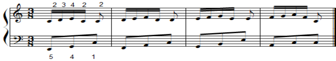
شكل رقم (١٦)

تمرين مقترح لتذليل صعوبة أداء نغمات أربيجية مع نغمات متتابعة