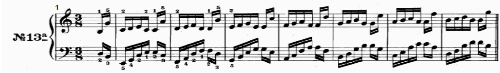
شكل رقم (١٤)

- اللحن : اليد اليمنى تؤدي نموذج قائم على أداء مسافة السادسة اللحنية ونغمات سلمية صاعدة ثم مسافة الثالثة هبوطاً ثم مسافة السادسة اللحنية مرة أخرى ، أما اليد اليسرى تؤدي نموذج قائم على نغمات أربيجية تتدرج سلمياً للوصول إلى نفس البداية مسافة أوكتاف لأعلى ، ثم النزول التدريجي للوصول لنغمة البداية مرة أخرى وينتهي التدريب في م (١٥) بقفلة تامة في سلم دو الكبير .