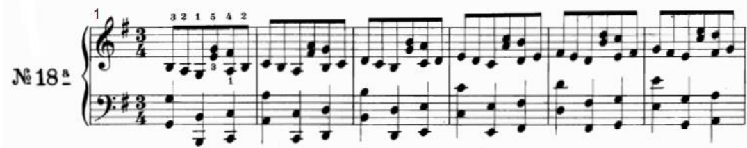
شكل رقم (٢٠)

- اليد اليسرى : تؤدي نموذج قائم على اوكتافات هارمونية تبدأ بنغمة أساس السلم ثم الدرجة السادسة هبوطاً ثم صعوداً الدرجة التي تليها ويؤدي هذا النموذج في تدرج سلمى حتى الوصول لجواب درجة البداية في م(٨) ثم النزول تباعاً حتى الوصول ل م(١٥) ونهاية التدريب بقفلة تامة في سلم صول الكبير .