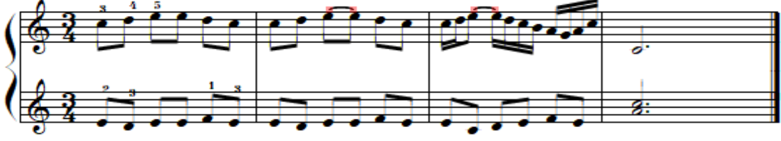
شكل رقم (١٩)

تمرين مقترح لتذليل صعوبة أداء رباط زمني مع أداء نغمات سلمية