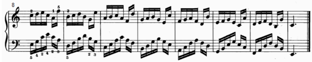
شكل رقم (١٥)

يوضح للتدريب التقني رقم (١٣) من الناحية النغمية والإيقاعية