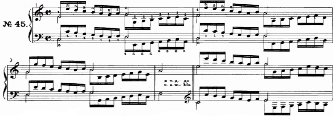
شكل رقم (٢٩)

- اليد اليسرى : أداء نفس نموذج اليد اليمنى ولكن يبدأ بالاصبع (٥) على أساس سلم دو الكبير .