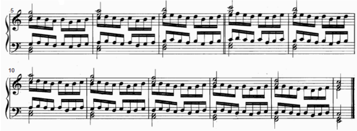
شكل رقم (٢٧)

يوضح التدريب رقم (٤٣) من الناحية النغمية والايقاعية