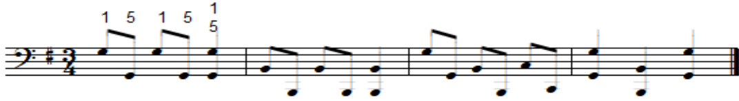
شكل رقم (٢٢)

تمرين مقترح لتذليل صعوبة أداء أوكتافات هارمونية متتالية باليد اليسرى