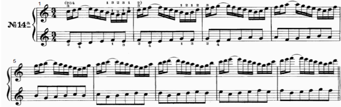
شكل رقم (١٧)

، ثم يتكرر هذا النموذج على درجات السلم حتى الوصول لدرجة جواب البداية في م (١٢) ثم يبدأ النموذج بالهبوط حتى الوصول لدرجة البداية والانتهاؤ بقفلة تامة في سلم دو الكبير . - اليد اليسرى : تؤدي نموذج قائم على مسافة الثالثة اللحنية الهابطة ، ثم تدرج سلمي صاعد ثم العودة لدرجة البداية ، يتكرر هذا النموذج صعوداً في تدرج سلمي حتى الوصول لدرجة جواب البداية في م (١٢) ويبدأ النموذج بالهبوط تدريجياً حتى نهاية التدريب في م (١٩) .