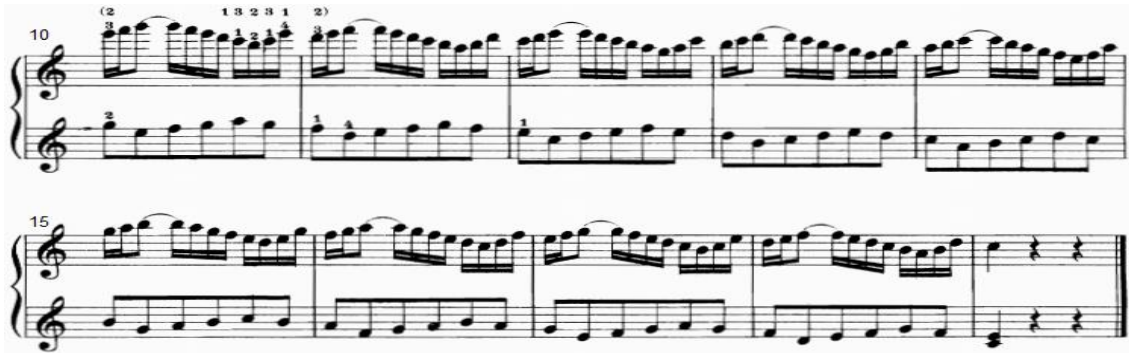
شكل رقم (١٨)

يوضح التدريب التكنيكي رقم (١٤) من الناحية النغمية والإيقاعية