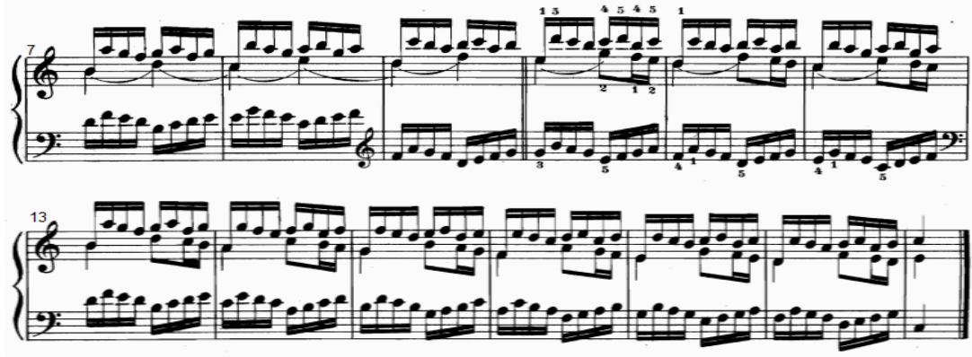
شكل رقم (٢٤)

التدريب التكنيكي رقم (١٩) من الناحية النغمية والإيقاعية