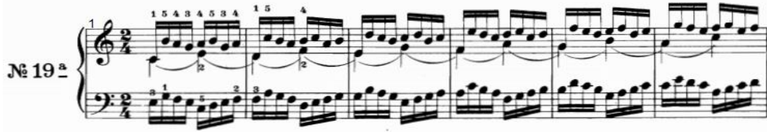
شكل رقم (٢٣)

المتتالية من درجات السلم حتى م(٩) ، ومن م(١٠) تم تغيير إيقاع الصوت الداخلي (A□□≈) ± ( بأداء نغمات سلمية هابطة وصولاً إلى م(١٩) وانتهاء التدريب بقفلة تامة في سلم دو الكبير . - اليد اليسرى : أداء نموذج قائم على مسافة الثالثة اللحنية صاعدة ثم تدرج سلمي هابط ثم أداء مسافة ثالثة لحنية هابطة ثم تدرج سلمي صاعد ، ويبدأ النموذج من النغمة التي تنتهي بها المازورة السابقة حتى م(١٠) ثم الهبوط التدريجي حتى م(١٩) والانتهاؤ بقفلة تامة في سلم دو الكبير .