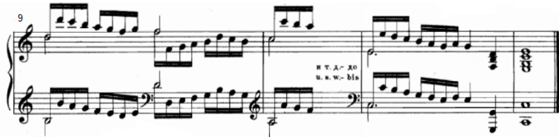
شكل رقم (٣٠)

يوضح التدريب من الناحية النغمية والإيقاعية