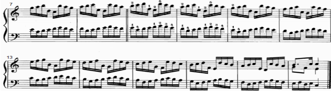
شكل رقم (٨)

يوضح التدريب رقم ٩ من الناحية النغمية والإيقاعية