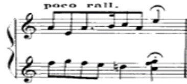
شكل رقم ( ٧ ) يوضح نهاية الحركة الأولى للصوناتين رقم (١)

٧. الإلتزام بأسلوب أداء علامة الاطالة أداء العلامة الدالة على الاطالة الغير محددة بزمن ( ) ومراعاة الدقة فى تنفيذ التلوين الصوتى والإبطاء التدريجى المشار إليه فى نهاية الحركة الأولى بالشكل التالى رقم (٧)