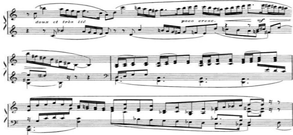
شكل رقم (١٠) يوضح الجملة الثالثة

الجملة الثالثة : تبدأ من بداية الجملة بقفزات لليد اليمنى وايضا لليد اليسرى مع استخدام الاقواس اللحنية ولاحظت الباحثة أن المؤلف تجاهل الاشارة الى الميزان للتأكيد على الحرية التامة في أداء عبارات غير متساوية في عدد الوحدات (□) وبالتالي غير متساوية في الطول البنائي مع تغيير في الايقاعات واداء المقطوعة بسرعة اسرع من الجملة الاولى كما موضح بالشكل التالي: