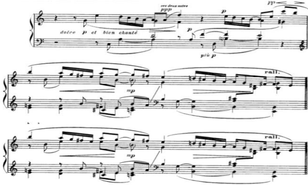
شكل رقم (٨) يوضح الجملة الأولى

اللحن : يتميز اللحن من بداية الجملة بقفزات لليد اليمنى وايضا لليد اليسرى مع استخدام الاقواس اللحنية ولاحظت الباحثة أن المؤلف تجاهل الاشارة الى الميزان للتأكيد على الحرية التامة في أداء عبارات غير متساوية في عدد الوحدات (□) وبالتالي غير متساوية في الطول البنائي. الجملة الأولى: تبدأ من بداية المؤلف وتنتهي بظهور اللحن الرئيسي في اليد اليسرى، غير محددة بخطوط الموازير، وتنتهي بخط مازورة مزدوج، استخدم المؤلف تغيير الميزان بين كما يوضحه الشكل التالي :