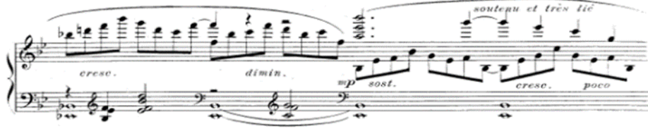
شكل رقم (١٧) يوضح أداء القفزة المباشرة بين نغمة منفردة وتآلف هارموني

٣. أسلوب أداء قفزة مباشرة بين نغمة وتآلف هارموني: