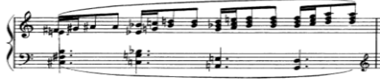
شكل رقم (١٣) يوضح أداء النغمات الهارمونية في كلتا اليدين

الاصابع بحركة طبيعية دون احداث ضغوط مفاجئة على نغمة دون الاخرى ، مع مراعاة ترقيم الاصابع بحيث تكون الاصابع قريبة من لوحة المفاتيح وممتدة بدلا من الانحناء الكامل بمساعدة الساعد الذى يسهم فى حرية حركة الذراع لاداء الحركة بسهولة وانسيابية مع الاحتفاظ بالعضد جهة الخارج . ٤. اسلوب اداء التآلفات الهارمونية المتصلة فى كلتا اليدين :