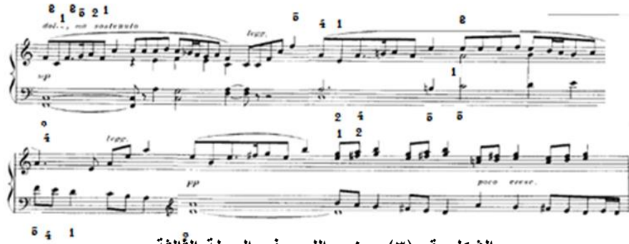
الشكل رقم (٣) يوضح اللحن في الجملة الثالثة

الجملة الثالثة: مبنية على استخدام نماذج ايقاعية سينكوبية، ونماذج لحنية متتالية، يظهر اللحن في الصوت الخارجي باليد اليمنى مع مصاحبة على شكل نغمات كمنزبوانطية في نفس اليد، والمصاحبة في اليد اليسرى مبنية على استخدام مسافات هارمونية بنماذج ايقاعي ممتدة ، استعان المؤلف بالأفواس الزمنية واللحنية في التقسيم العباري، تتسم بالخفوت والأداء المتواصل تنتهي بظهور جزء من اللحن الرئيسي في اليد اليمنى، كما يوضحه الشكل التالي: