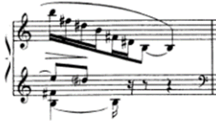
شكل رقم (١٢) يوضح أداء الأربيج