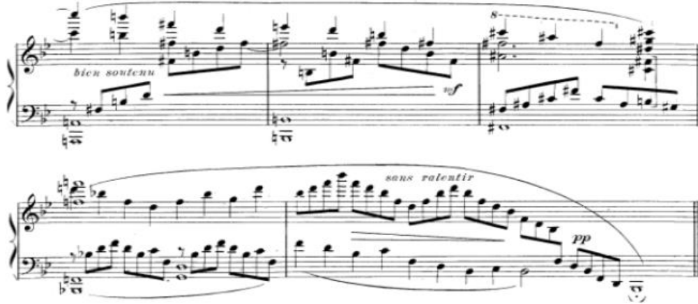
شكل رقم (١٦) يوضح الجملة الثالثة

الجملة الثالثة : تبدأ من البداية بنغمات هارمونية هابطة مع قفزات لليد اليمنى وايضا لليد اليسرى نغمات هارمونية مع قفزات ثلاثية مع استخدام الاقواس اللحنية ولاحظت الباحثة أن المؤلف لم يتجاهل اشارة الميزان للتأكيد على الحرية التامة في أداء عبارات متساوية في عدد الوحدات (□) وبالتالي متساوية في الطول البنائي اداء المقطوعة ببطئ من الجملة الاولى كما موضح بالشكل التالي