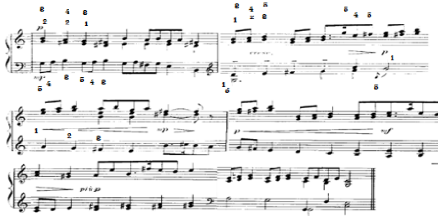
الشكل رقم (٢) يوضح اللحن في الجملة الثانية

الجملة الثانية: على نفس نمط الجملة الأولى فيما عدا ظهور بعض النغمات الملونة والتي تشير الى حركة لحنية كروماتيكية هابطة في المصاحبة باليد اليسرى، استعان المؤلف بالأسلوب البوليفوني وابتكارات من صوتين من خلال ظهور النموذج اللحني بين اليد اليسرى واليد اليمنى، والتنويع من خلال الثراء الهاموني وتغيير النموذج الإيقاعي، تتسم بالأداء المتواصل بدون وقفات والانتقال بين المفاتيح واستخدام حلية الأتشيكاتورا في اليد اليسرى، وتنتهي بظهور خط المازورة المزوج كما يوضحه الشكل التالي :