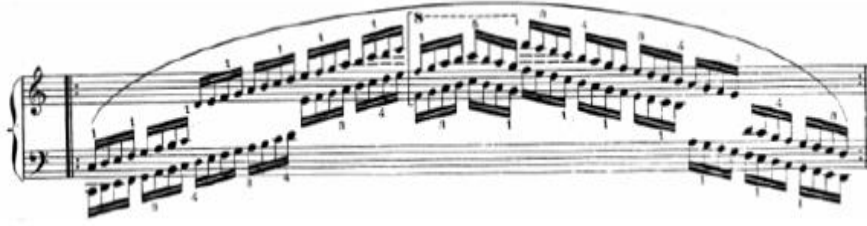
شكل رقم ( ٥ ) يوضح التمرين المقترح للتدريب على السلام في كلتا اليدين

٦. أسلوب أداء خط لحنى فى الصوت الداخلى باليد اليسرى (الجملة الثانية) مع نغمات كمنترابوانطية فى نفس اليد ، وعند تفسير الأداء يجب توضيح النغمات الكمنترابوانطية الممتدة والالتزام بزمنها كاملا من خلال الضغط عليها بمرونة وعدم شد العضلات ومراعاة الحركة الجانبية للأصابع المستخدمة فى العزف والإلتزام بالترقيم المقترح والذي يسمح بالأداء المترابط كما لا بد من مراعاة علامة الضغط المشدد (-) Tenuto حيث يتطلب ذلك الضغط على النغمة بإعطاءها ثلاثة ارباع زمنها على ان يكون ذلك فى حدود التدرج الصوتى المطلوب والمتجة للصوت الخافت بجانب مراعاة أداء حلية الاتشيكاتور على ان تسبق البلاش الذى يليها ولا تأخذ منة.