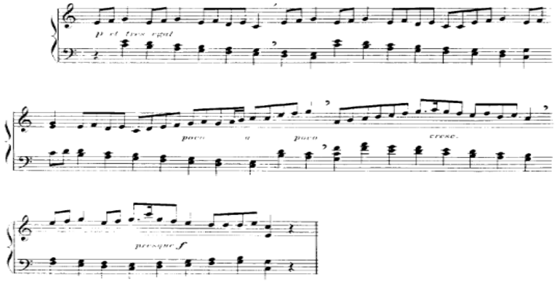
الشكل رقم (١) يوضح اللحن في الجملة الأولى

الجملة الثانية: على نفس نمط الجملة الأولى فيما عدا ظهور بعض النغمات الملونة والتي تشير الى حركة لحنية كروماتيكية هابطة في المصاحبة باليد اليسرى، استعان المؤلف بالأسلوب البوليفوني وابتكارات من صوتين من خلال ظهور النموذج اللحني بين اليد اليسرى واليد اليمنى، والتنويع من خلال الثراء الهاموني وتغيير النموذج الإيقاعي، تتسم بالأداء المتواصل بدون وقفات والانتقال بين المفاتيح واستخدام حلية الأتشيكاتورا في اليد اليسرى، وتنتهي بظهور خط المازورة المزوج كما يوضحه الشكل التالي :