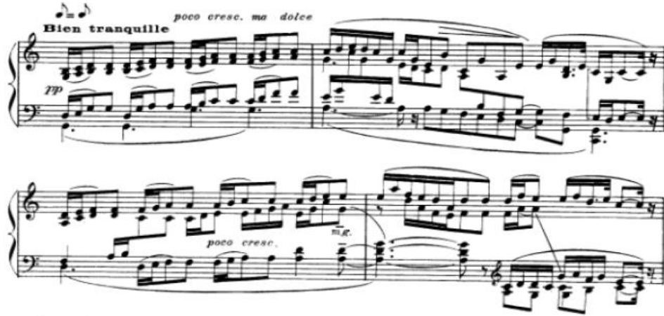
شكل رقم (٩) يوضح الجملة الثانية

الجملة الثالثة : تبدأ من بداية الجملة بقفزات لليد اليمنى وايضا لليد اليسرى مع استخدام الاقواس اللحنية ولاحظت الباحثة أن المؤلف تجاهل الاشارة الى الميزان للتأكيد على الحرية التامة في أداء عبارات غير متساوية في عدد الوحدات (□) وبالتالي غير متساوية في الطول البنائي مع تغيير في الايقاعات واداء المقطوعة بسرعة اسرع من الجملة الاولى كما موضح بالشكل التالي: