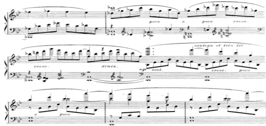
شكل رقم (١٥) يوضح الجملة الثانية

الجملة الثانية : تبدأ على نفس نمط الجملة الأولى فيما عدا ظهور بعض النغمات الملونة والتي تشير الى حركة لحنية لفقرات ثلاثية لليد اليمنى يقابلها نغمات ممتدة لليد اليسرى، استعان المؤلف بالأسلوب المحاكاة من خلال ظهور النموذج اللحني لليد اليمنى، والتنوع من خلال الثراء الهاموني لليد اليسرى تتسم بالأداء المتواصل والانتقال بين المفاتيح، وتنتهي بظهور خط المازورة المزوج كما يوضحه الشكل التالي :