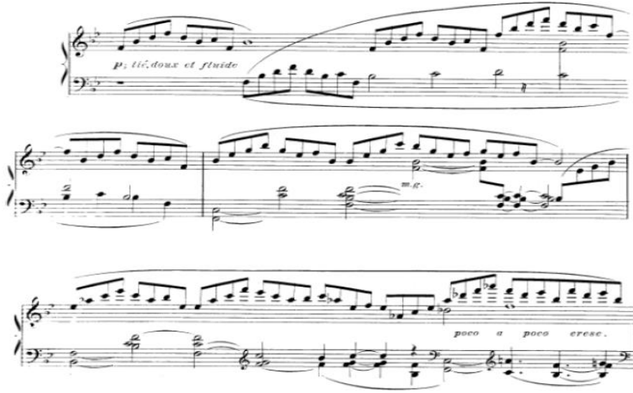
شكل رقم (١٤) يوضح الجملة الأولى

الجملة الثانية : تبدأ على نفس نمط الجملة الأولى فيما عدا ظهور بعض النغمات الملونة والتي تشير الى حركة لحنية لفقرات ثلاثية لليد اليمنى يقابلها نغمات ممتدة لليد اليسرى، استعان المؤلف بالأسلوب المحاكاة من خلال ظهور النموذج اللحني لليد اليمنى، والتنوع من خلال الثراء الهاموني لليد اليسرى تتسم بالأداء المتواصل والانتقال بين المفاتيح، وتنتهي بظهور خط المازورة المزوج كما يوضحه الشكل التالي :