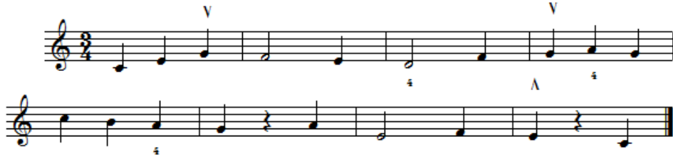
شكل رقم (١٦) يوضح تمرين مستوحى من الجزء الثاني من مقطوعة رقم (٢٥) من كتاب سوزوكي THE Little Sevcik