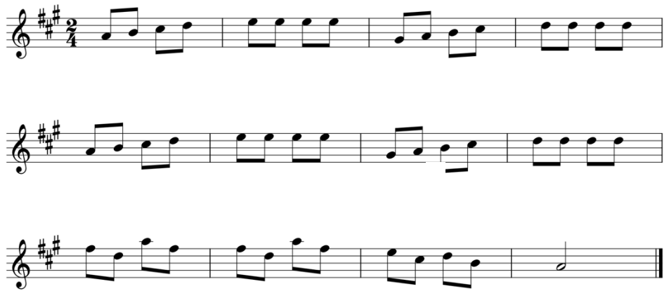
شكل رقم (٧) يوضح تدريب مستوحي من الجزء الأول من مقطوعة "Song of the Wind" من كتاب سوزوكي "Suzuk Violin Method-Vol 01"