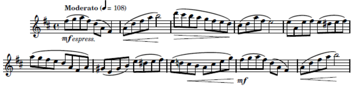
شكل (١) يوضح التتابع اللحني الصاعد الهابط وإستخدام ديناميكيات التعبير

العفقات الطبيعية في المناطق الصوتية المختلفة للفلوت، والتي يجب أن يجيدها العازف بشكل مهاري وتنتهي هذه التيمة اللحنية بقفلة تامة في سلم ري الكبير .