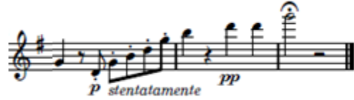
شكل (٩) يوضح انتهاء العمل

وفي م ٥٦ بدأ بالتمهيد للانتهاج من العمل بعمل أربيج صاعد علي مسافة اكتافين بداية من نغمة ري بصوت خافت P وبصعوبة stentatamente وبأداء متقطع Staccato انتهاءً بنغمة صول ٣ بوقفة مطولة ◡ للاحساس بالقفلة التامة علي اساس سلم المقطوعة سلم صول الكبير في منطقة الجوابات .