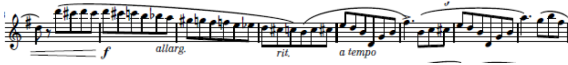
شكل (١٧) يوضح حلية التريل والتلوين الصوتي والأداء المتقطع

وبداية من م ٥٨ يقوم عازف الفلوت بختام الصيغة اللحنية الثانية B عن طريق عمل تتابع لحني بأداء قوي F كروماتيك بتدرج rit انتهاء في م ٦٣ علي حساس السلم فا دييز للعوده الي إعادة الصيغة الأولى A2 .