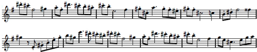
شكل (٧) يوضح الأداء المتقطع Staccato

الصيغة الثانية B: تبدأ من م ١٧ : م ٣٢ ويقوم المؤلف في هذه التيمة اللحنية بالانتقال الي سلم آخر بعمل تتابع لحني هابط في سلم (مي الكبير) بأستخدام اسلوب الأداء المتقطع Staccato فيقوم العازف بالتدريب علي التحكم في أن يكون اللسان غير مرئى أثناء العزف، لأن ظهوره بين الشفاه يعيق وضوح أساليب النطق وفتحة الفم أثناء " الأداء المتقطع Staccato ويعتمد العزف في هذه التيمة علي ضربات اللسان الفردية Single Tanguing لكي يستطيع عزف الأداء المتقطع Staccato.