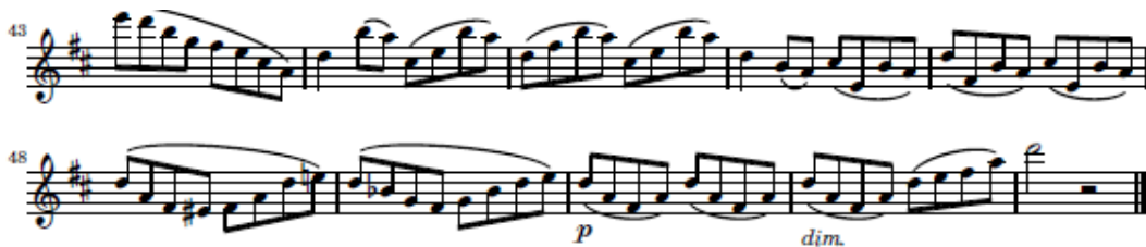
شكل (٤) يوضح الاختلاف في نهاية المقطوعة