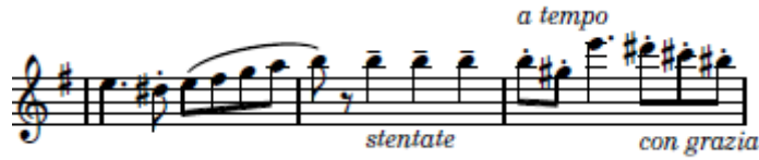
شكل (٦) يوضح التحويل لسلم مي الكبير وبداية الصيغة الثانية B

الصيغة الثانية B: تبدأ من م ١٧ : م ٣٢ ويقوم المؤلف في هذه التيمة اللحنية بالانتقال الي سلم آخر بعمل تتابع لحني هابط في سلم (مي الكبير) بأستخدام اسلوب الأداء المتقطع Staccato فيقوم العازف بالتدريب علي التحكم في أن يكون اللسان غير مرئى أثناء العزف، لأن ظهوره بين الشفاه يعيق وضوح أساليب النطق وفتحة الفم أثناء " الأداء المتقطع Staccato ويعتمد العزف في هذه التيمة علي ضربات اللسان الفردية Single Tanguing لكي يستطيع عزف الأداء المتقطع Staccato.