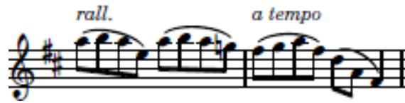
شكل (٣) يوضح الأنتقال من الصيغة B الي الاعادة A2

يقوم العزف بإعاده الصيغة الأولى م٣٣ الي نهاية المقطوعة ولكن يوجد أختلاف بداية من م٤٤ بإستعراض تام في هذا الجزء وإستخدام الاربيجات والتتابع اللحني عن طريق القفزات اللحنية ه٥ صاعدة وأنتهت المقطوعة بقفلة تامة في سلم المقطوعة الصلي ري الكبير .