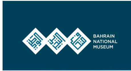
شكل رقم 17