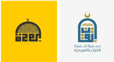
شكل رقم ١٤ استخدام الخط الكوفي الهندسي في تصميم الشعار 4

3. 2. 1- تصميم الشعار 2 : الشعار هو رمز أو صورة أو عنصر مرئي يستعمل للدلالة على علامة تجارية أو سلعة معينة أو أي مؤسسة، ويكون الشعار عادة مصمماً بحيث يوصل الفكرة بسرعة. ويتكون الشعار عادة من عناصر: رسم أو رمز أو تشكيل معين للخط أو رمز وخط. يمكن أن يرسم الخطاط الشعار بشكل يجعل منه أيقونة تمزج بين جمالية المقروء وإبداع الفنان، فإما أن يكون على شكل هندسي أو على شكل عضوي، مثل البنائيات والبيوت والأشخاص، ويعد الخط العربي الكوفي Kufic هو من أشهر أنواع الخطوط العربية الإسلامية ويشيع استخدامه في تصاميم شعار الخط العربي 3 كما في (الشكل رقم ١٤). ويوجد أنواع كثيرة من الشعار التي تعتمد على استخدام الصورة أو الكلمة أو الحرف أو مجموعة حروف وفقاً لما يراه المصمم مناسباً للهوية المؤسسية، وفي هذا البحث تم تناول الشعار الذي يعتمد في تصميمه على الحرف أو مجموعة من الأحرف مثل أعمال الفنان طارق العتريسى