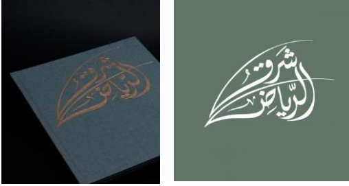
شكل رقم 15

تصميم شعار شرق الرياض طارق العتريسي المملكة العربية السعودية