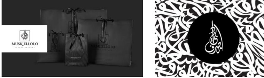
شكل رقم ١٣ استخدام الخط العربي في تصميم الشعار و توظيفه في تصميم الهوية التجارية للشركة

يعد الخط العربي حالة نادرة من حالات الفن البصري المعاصر، الذي يميل إلى التجريد وإقامة علاقات تشكيلية متفرقة بين الحروف وشخصياتها كأحد أشكال التعبير البديعة باستخدام أساليب التشكيل المختلفة. ويلجأ البعض إلى استلهام الأفكار والأشكال من أصول الخط العربي الكلاسيكية وقواعده المتينة، واستنباط حروفاً وأشكالاً جديدة منها، ومنهم من يكتفي بتلك القواعد ويستخدمها كشعار يدل على العلامة التجارية، أما البعض الآخر فينطلق بحرية تامة متحرراً من تقاليد وأساليب الخط الكلاسيكي نحو إنشاء خطٍ حرٍ ومعاصر لجعله أكثر إبداعاً في عالم الفن والتطور، وتتعدد أشكال الخط الحر وأنواعه مما يفتح أبواباً مستمرة جديدة للإبداع. كما يتيح الفرصة للمصممين بإخراجه بطريقة فنية. (شكل رقم ١٣) 1