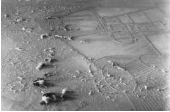
Man Ray et Marcel Duchamp, Dust, 1920

كانت روز سيلوي أحد الأسماء المستعارة لدوشامب وشخصيته الأنثوية وكان رأي هناك لأخذ لقطة لدوشامب في كل مرة يظهر فيها بشخصية روز سيلفي. لكن تلك الصور كانت مجرد جزء صغير من صداقتهما الفريدة الدائمة والتعاون الفني بينهما. انتشرت جمالياتهم المشتركة عبر وسائط مختلفة.