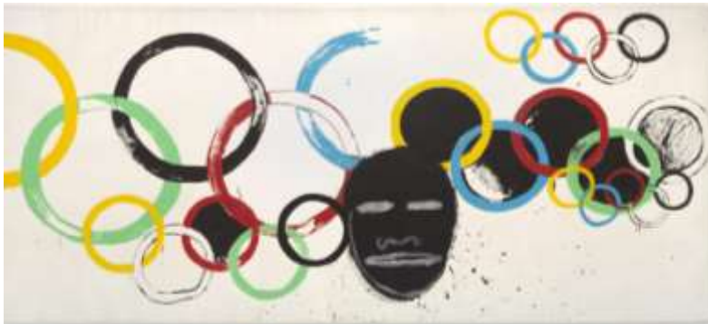
Olympic Rings, Andy Warhol and Jean-Michel Basquiat

من عام 1980 إلى عام 1986 ، تعاون فنان البوب الشهير آندى وار هول وأعجوبة الجرافيتي ، جان ميشيل باسكيات في عدد من القطع الفنية التي قادتهم إلى