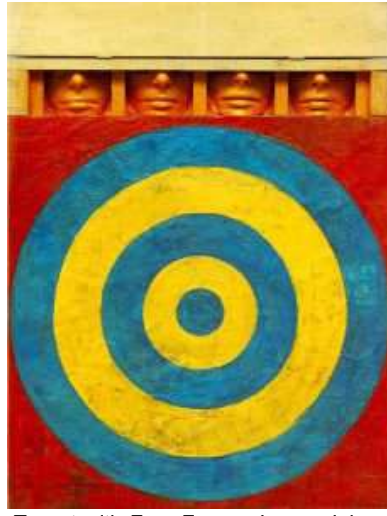
Target with Four Faces, Jasper Johns

تعاون بين التعبيريين التجريديين Jasper Johns و Robert Rauschenberg. ابتكرا فنًا رائعًا في وسط حركة الدادا الجديدة الأمريكية ، في الواقع في علاقة رومانسية بالإضافة إلى ، تعاونهما الفني في الخمسينيات من القرن الماضي ، أثرا بشكل كبير على عمل بعضهما البعض وحقيقة أن هناك تشابهًا عميقًا في فنهم. مهد هذان الفنانان الطريق لحركة فن البوب من خلال محور الاختلافات بين الفنون الجميلة والثقافة الجماهيرية.