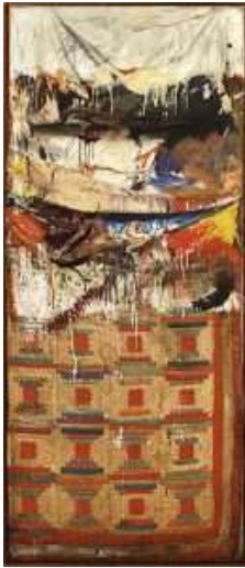
Bed, Robert Rauschenberg