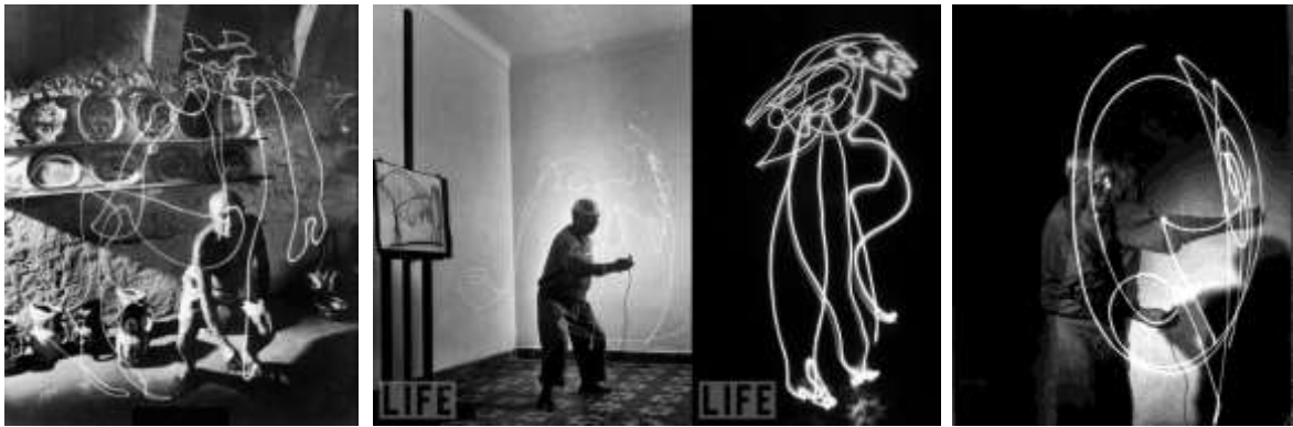
Pablo Picasso painting with light, Photograph by Gjon Mili | Source: Visual News