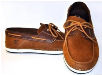
صورة (6) حذاء إليو الدكّ

أحذية إليو اللوفر (loafers): وهذا الحذاء صورة (5) يشبه النوع السابق في أنه مكون من جزء رئيسي من الجلد (جانبي الحذاء) ويجمع مع وجه الحذاء (الفرنشة) بحياكة سروجي، إلا أنه يختلف عنه في كون النعل منفصل، وقد يكون النعل ملصق بأسفل الحذاء أو محاك بجانب الحذاء (نعل عليّة) وهو نعل ذو حواف عالية وبه مجرى ليتم حياكته حول الحذاء وبه كعب منخفض الارتفاع،