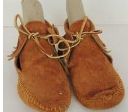
صورة (1) الأصلي لحذاء الإليو

حذاء الإليو الذي يعرف أيضًا باسم الموكاسين (moccasin)، هو نوع من الأحذية أتى إلينا من الهنود الحمر،