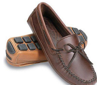
صورة (4) حذاء إليو الموكاسين