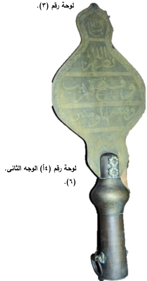
لوحة رقم (٤) الوجه الثاني. (٦).