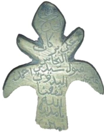
لوحة رقم (٤) الوجه الأول.