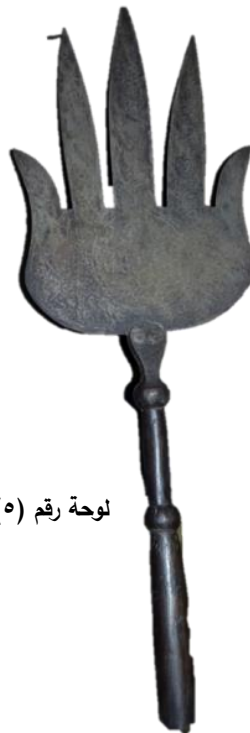
لوحة رقم (٥).